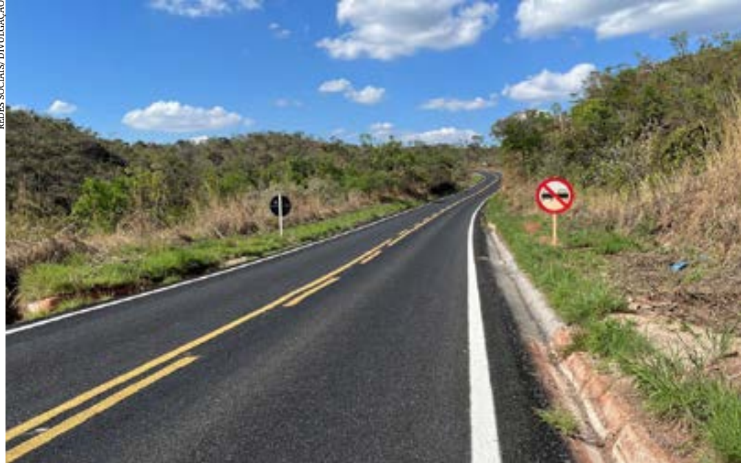
Trecho da rodovia MGC-367, entre Bocaiuva e Couto de Magalhães de Minas, no Vale do Jequitinhonha

Programa que conta com cerca de cem empreendimentos está recuperando a malha rodoviária nas regiões mais críticas do estado