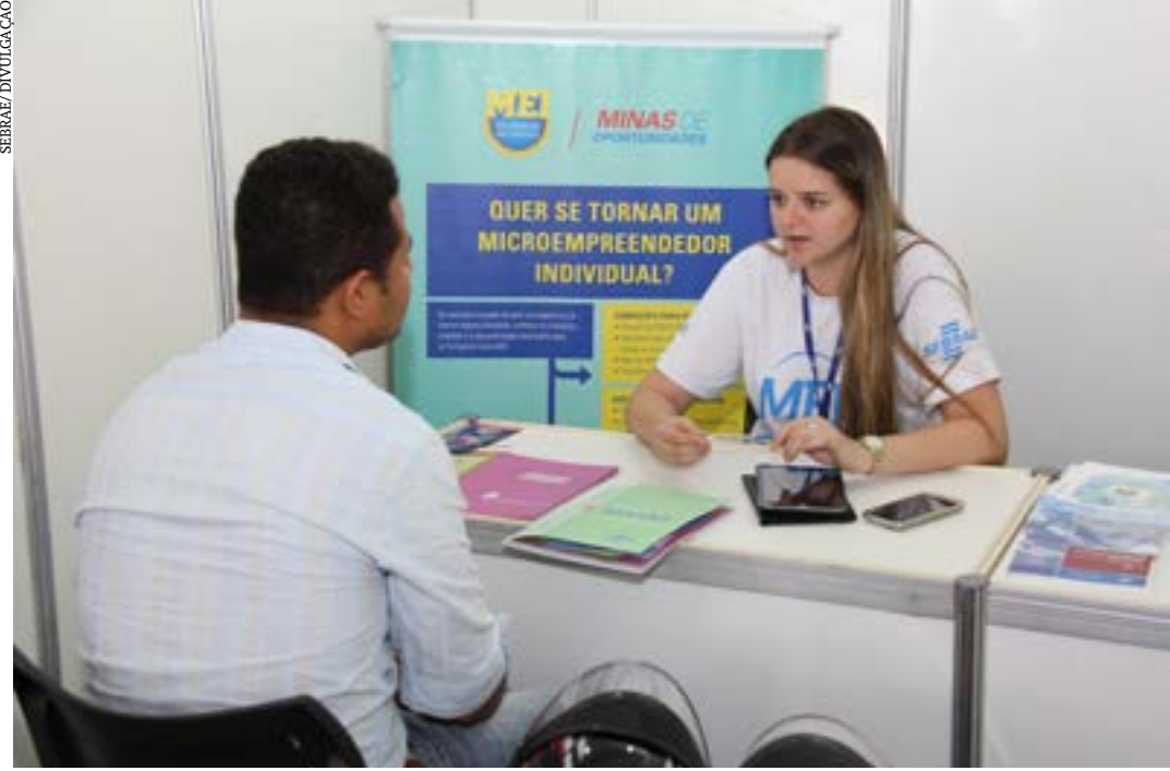
Apesar da variação, estado concentra um acumulado total de 1,6 milhão MEI e é o terceiro em número de formalizações no país

"Percebemos um número cada vez maior de jovens que empreendem para ter sua independência financeira. Por outro lado, há os idosos que se aposentam e querem se manter ativos no mercado ou necessitam de uma renda extra para complementar sua aposentadoria", destaca Laurana Viana. (Agência Sebrae)