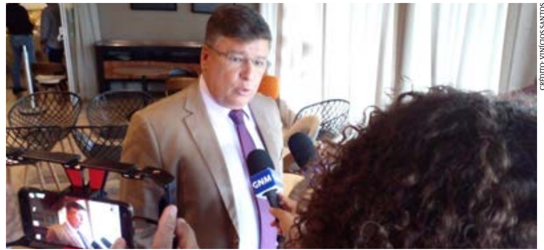
O senador da República Carlos Viana em entrevista à TV Gazeta Norte Mineira, na tarde dessa quinta-feira (26)