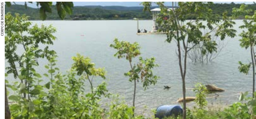
CORPO DE BOMBEIROS

Mergulhadores do 7º Pelotão do Corpo de Bombeiros Militares de Janaúba encontraram na manhã dessa quinta-feira (26), o corpo de um homem que havia se afogado no lago da barragem do Bico da Pedra. Ele se encontrava num barco em companhia de um colega no final da tarde de quarta-feira, quando a embarcação virou.