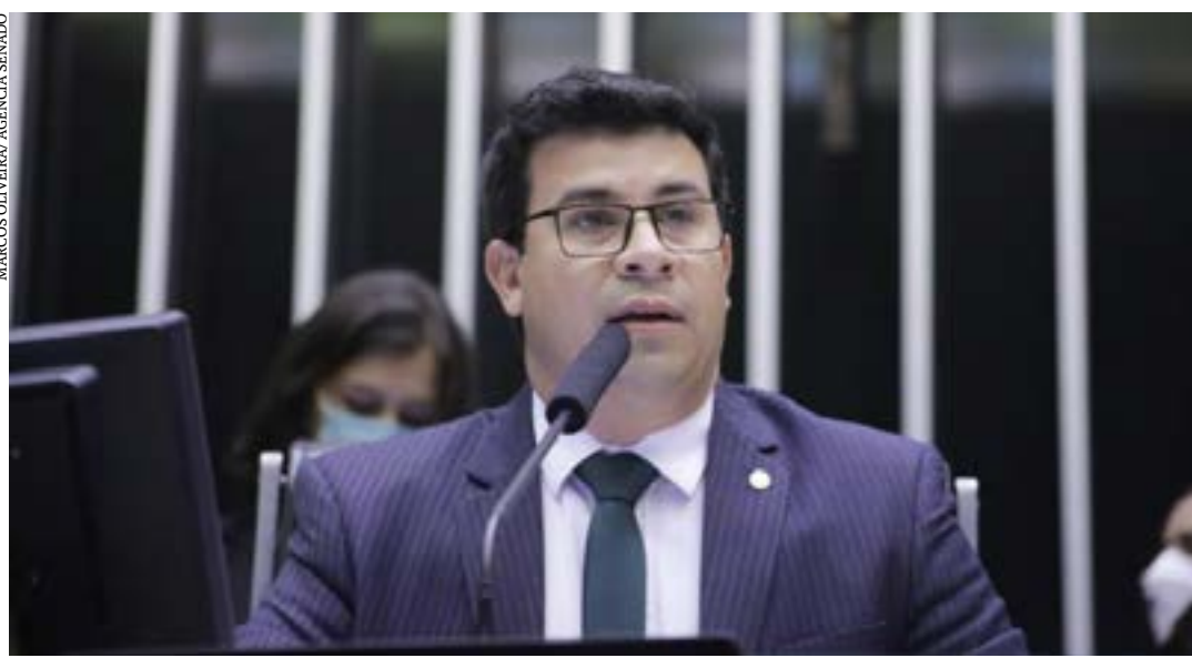
A primeira sessão preparatória, para a posse dos senadores eleitos em outubro, começa às 15h

“Por se tratar de um evento que reúne na mesma solenidade os chefes dos três Poderes da República, a sessão que abre os trabalhos legislativos segue um roteiro minucioso, com a participação também das Forças Armadas”, explicou Guerzoni. (Agência Senado)