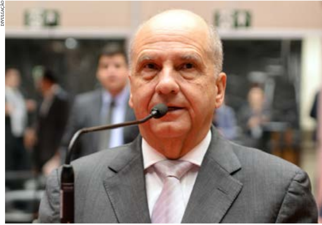
Parlamentar cobra o cumprimento do prazo nas obras realizadas na rodovia