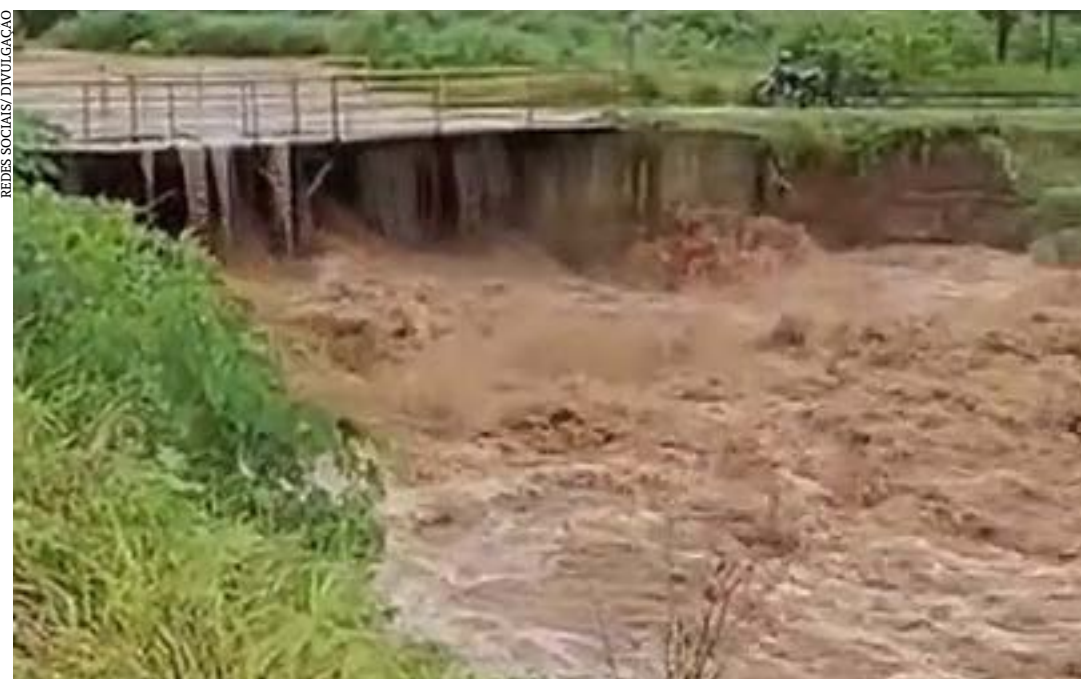
Os estragos causados no Ribeirão de Salinas

Nessa quinta-feira (26), uma forte chuva atingiu a cidade de Salinas. Devido ao grande volume de água, as ruas e casas ficaram alagadas e o temporal provocou muitos prejuízos em diversas áreas da cidade. Não foi registrada nenhuma ocorrência de pessoas