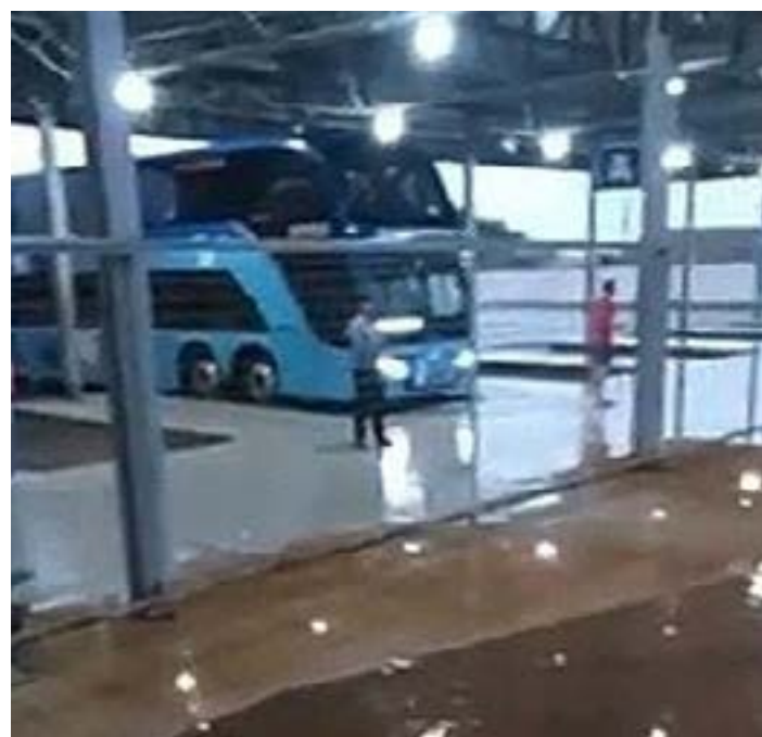
A rodoviária do município ficou alagada

A assessoria de comunicação do município informou que as equipes da Defesa Civil, Corpo de Bombeiros, Secretaria de Obras e Secretaria de Desenvolvimento Social estão realizando o monitoramento da situação e mapeando os prejuízos. Ainda segundo a as-