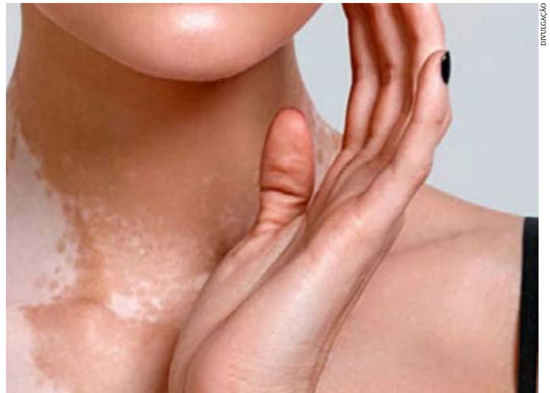
Manchinhas com até 5mm de circunferência são frequentes nos brasileiros e, às vezes, confundidas com vitiligo, mas são benignas, não coçam, não doem e não são contagiosas

Apesar disso, o melhor tratamento ainda é a prevenção com o uso correto do protetor solar, inclusive para impedir a piora das manchas. "É importante estar atento para a quantidade e a frequência corretas, com reaplicação a cada 3 ou 4 horas. A quantidade adequada de protetor solar para o rosto e o pescoço é o equivalente a uma colher de chá (cerca de 2 ml) e, para o restante do corpo, são indicadas três colheres de sopa (cerca de 10 ml). Essa regra deve ser seguida principalmente se tiver em exposição direta ao sol, em atividade física, praia, clube ou trabalho e se houver banho de piscina ou mar é preciso reaplicar mais vezes", finaliza.