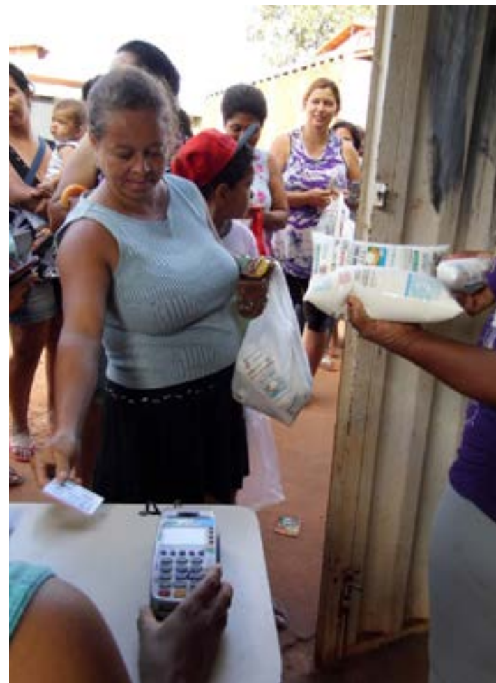
O programa marcou a vida de grande número de famílias da região, proporcionando reforço alimentar às crianças, idosos e pessoas em situação de vulnerabilidade social

Antes de lançar o edital, o Governo de Minas Gerais realizou no