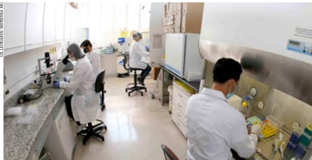
Doença se manifesta de diferentes formas e atinge animais domésticos, silvestres e até o homem