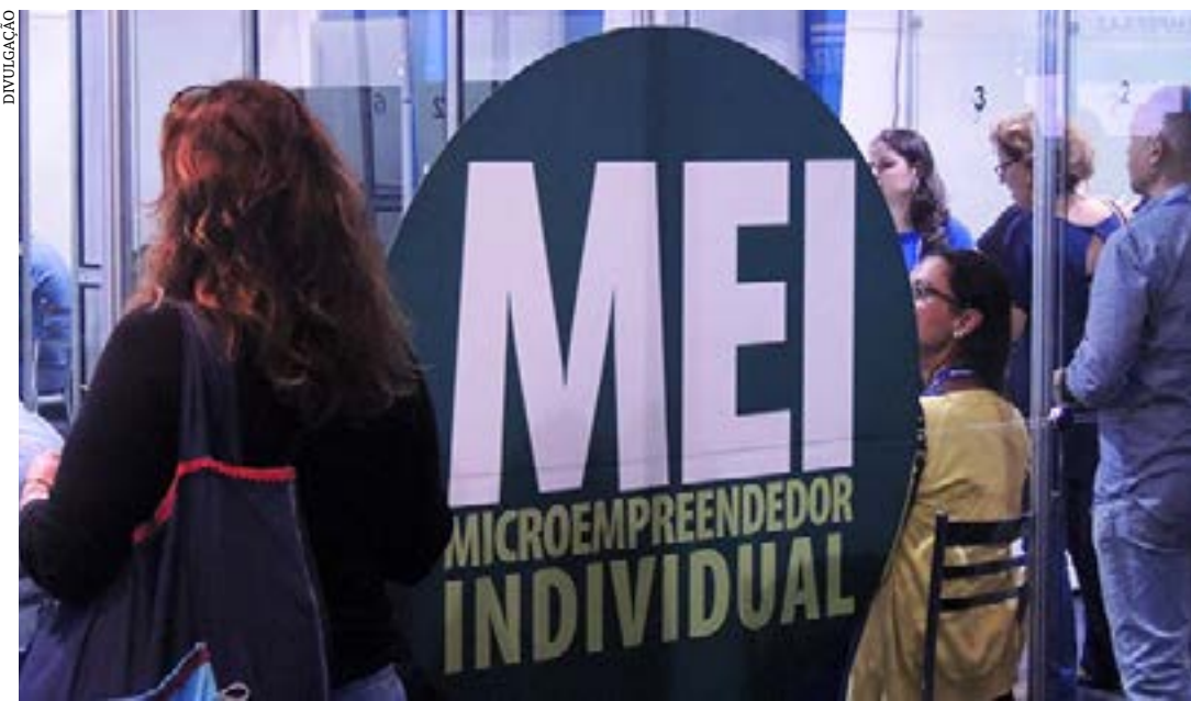
Com parcelas mínimas de R$ 50, MEI inadimplentes podem regularizar a situação e assegurar benefícios

Dos mais de 1,5 milhão de microempreendedores individuais (MEI) formalizados em Minas Gerais, até junho do ano passado, cerca de 41,5% estavam inadimplentes com o pagamento do Documento de Arrecadação do Simples Nacional (DAS). Segundo dados da Receita Federal, o total de débitos no estado ficou abaixo da média nacional, que registrou um percentual de 49% de contribuintes sem quitar a guia.