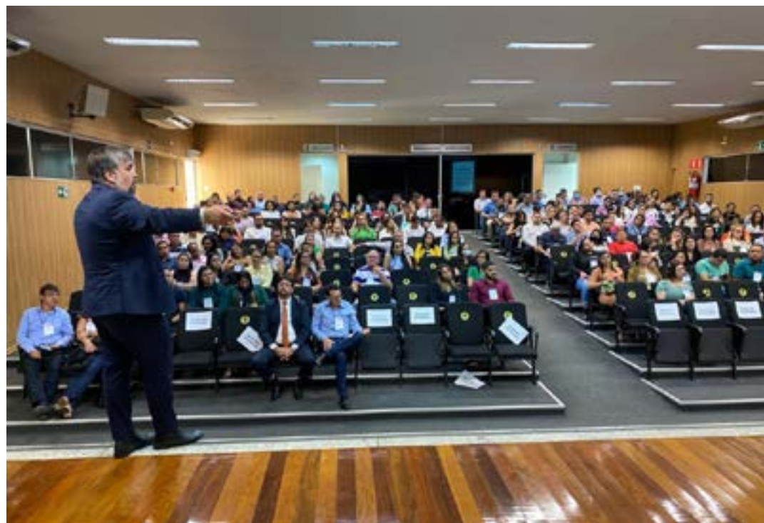
Em setembro, cerca de 300 pessoas participaram do primeiro evento de capacitação sobre a Nova Lei de Licitações

Este é o segundo curso gratuito oferecido para os municípios a fim de capacitá-los e prepará-los para a adequação da Nova Lei. Em setembro, cerca de 300 pessoas participaram do primeiro evento. (Ascom Codanorte)