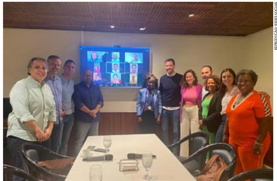
Deputados de esquerda fecharam apoio ao parlamentar em reunião nessa terça-feira (24)

do a maior bancada. Porém, um parlamentar do próprio partido negou que essa possibilidade ainda era discutida internamente.