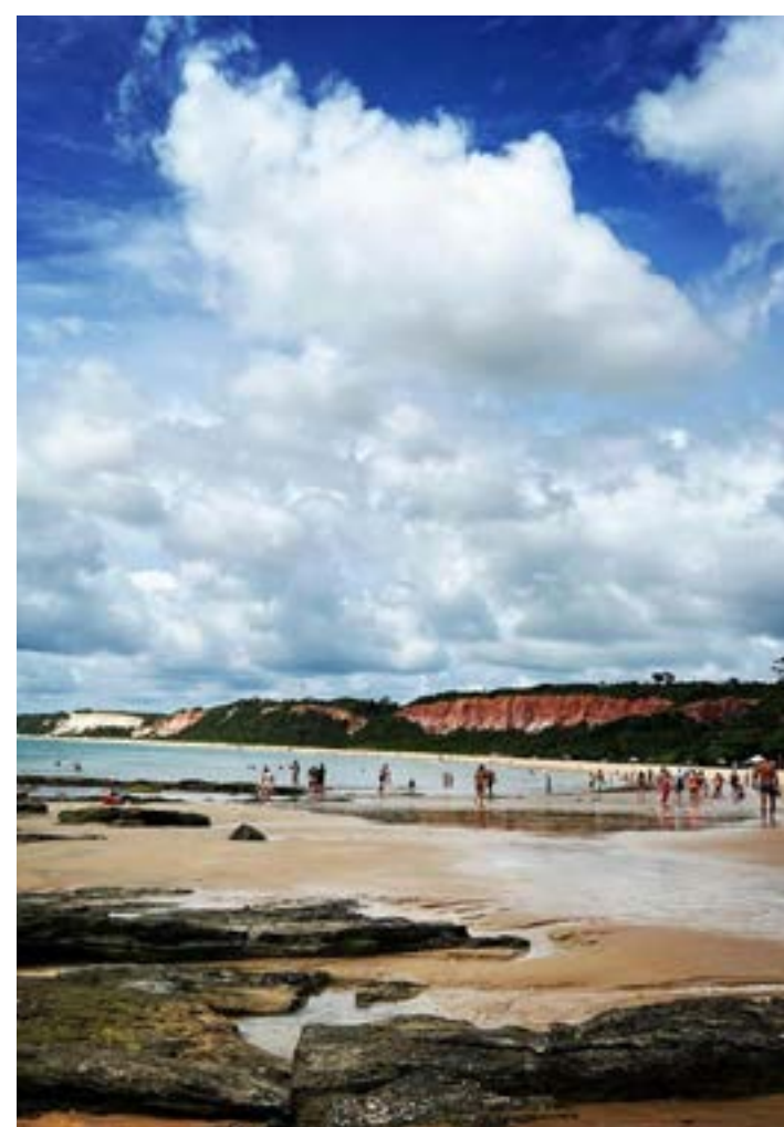
UM DOS MEUS hobby aqui em Arraial, é fotografar. Veja esta da praia de Pitinga, que ficou top.