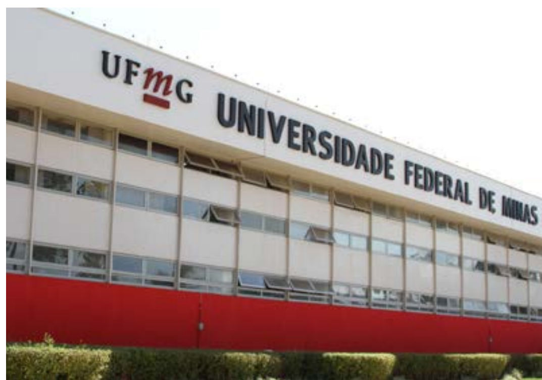
A mudança na comprovação de renda valerá apenas para o ingresso via Sisu