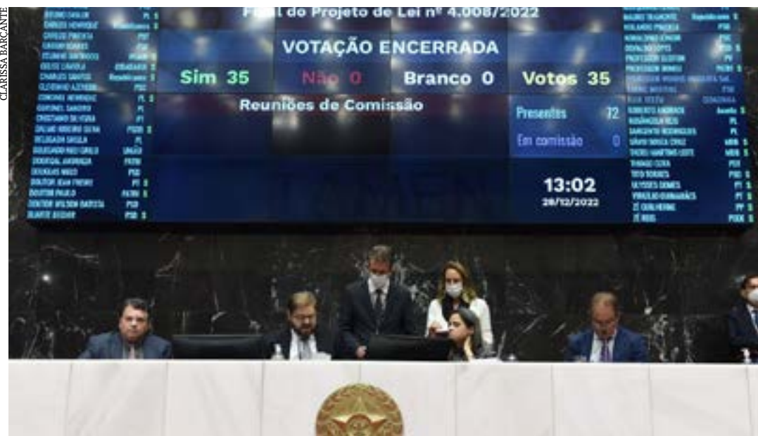
O orçamento para 2023 foi aprovado pelo Plenário da ALMG no final de dezembro do ano passado

Por outro lado, a Companhia de Desenvolvimento de Minas Gerais (Codemge) vai reduzir seus investimentos em 52%. A empresa recebe os lucros da exploração do nióbio de Araxá (Alto Paranaíba). O maior montante de investimentos – R$ 3 bilhões – será da Cemig Distribuição. Sozinha, a empresa será responsável por 38,7% dos investimentos programados pelas estatais mineiras. (Portal ALMG)