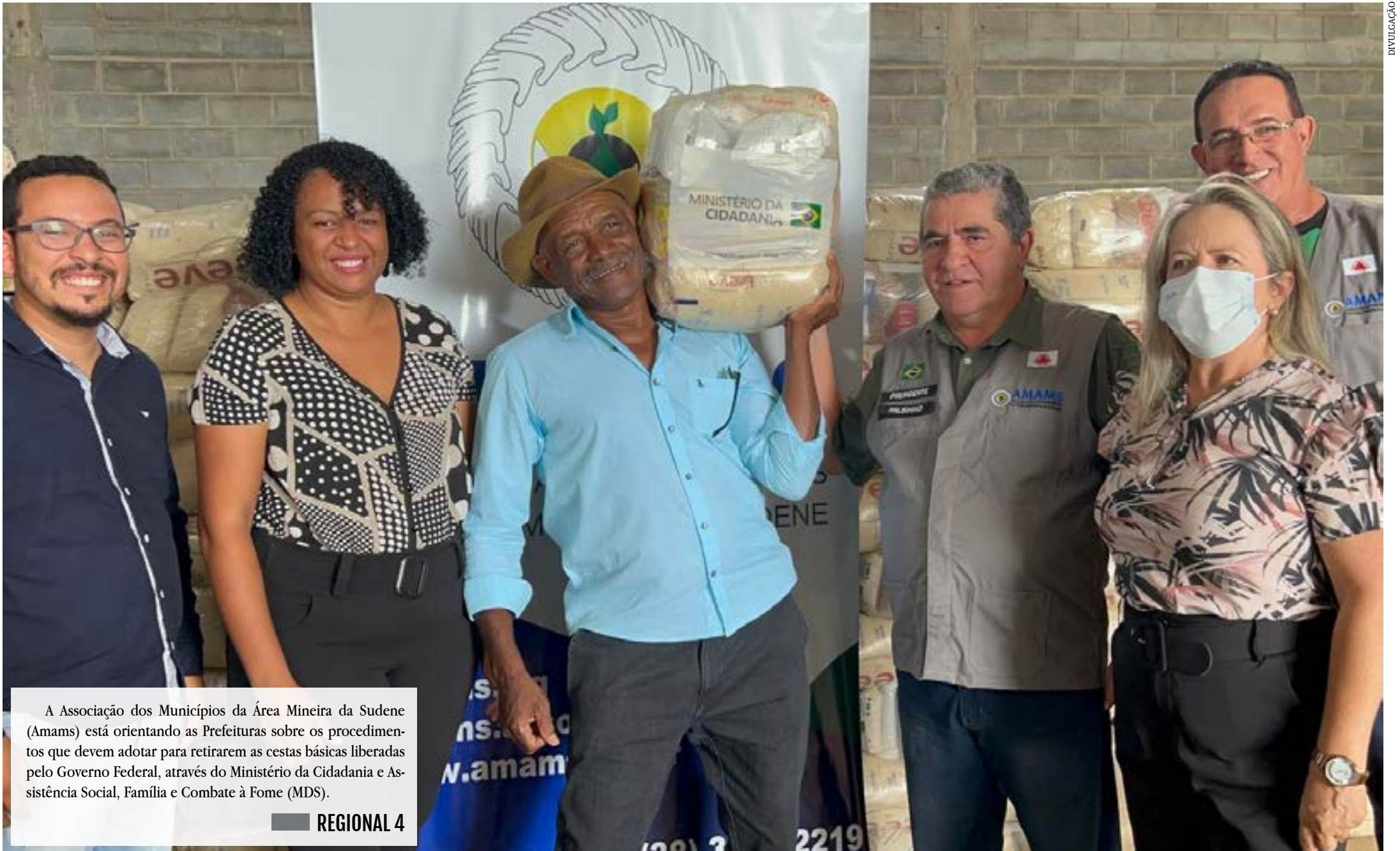
A Associação dos Municípios da Área Mineira da Sudene (Amams) está orientando as Prefeituras sobre os procedimentos que devem adotar para retirarem as cestas básicas liberadas pelo Governo Federal, através do Ministério da Cidadania e Assistência Social, Família e Combate à Fome (MDS).