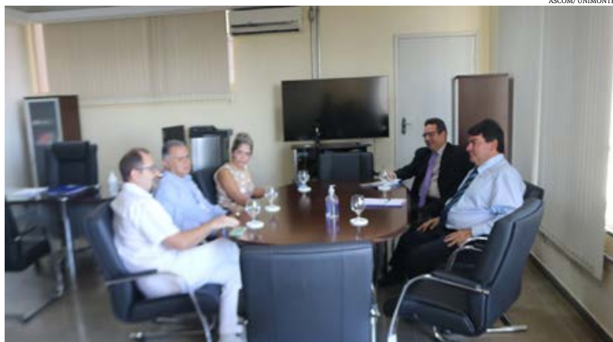
A Reitoria da Universidade Estadual de Montes Claros (Unimontes) e a Secretaria Municipal de Saúde estão discutindo como incrementar o bom funcionamento do Hospital Universitário Clemente de Faria (HUCF) para desempenhar ações conjuntas voltadas para a assistência à saúde da população.