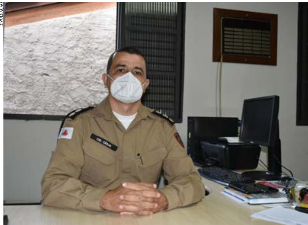
O coronel nomeado