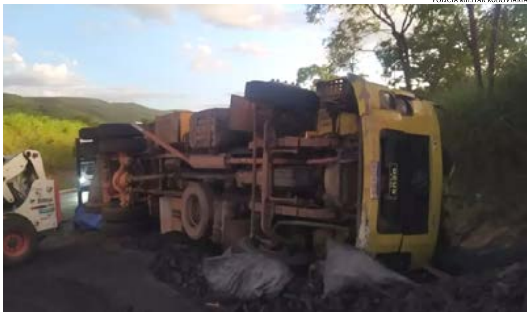
POLÍCIA MILITAR RODOVIÁRIA

Na tarde da última sexta-feira (11), um motorista ficou ferido após tombar o caminhão que dirigia na BR-135, em Joaquim Felício. De acordo com a Polícia Militar Rodoviária, o homem, de 30 anos, contou que perdeu o controle após tentar direcionar o veículo para a direita. Em seguida, o caminhão caiu em uma canaleta e tombou. A carga de carvão ficou espalhada na pista.