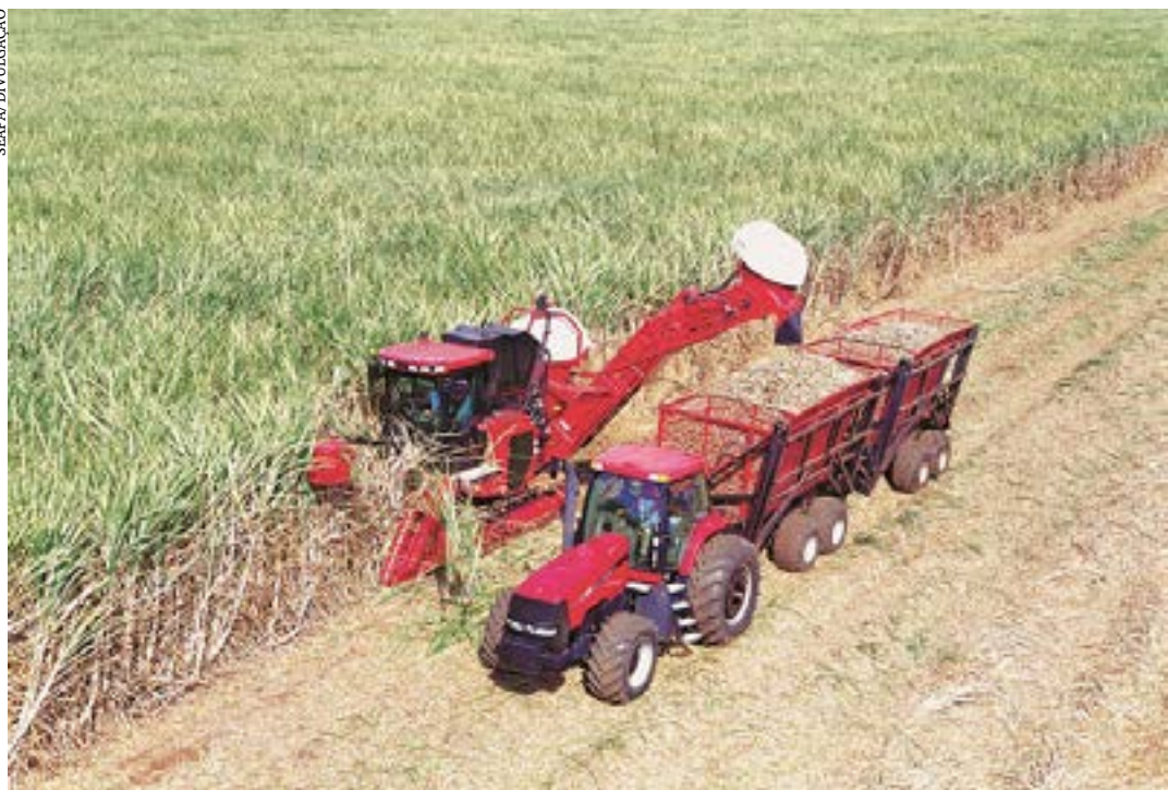
Volume de 13,6 milhões de toneladas também se destaca como o maior já comercializado pelo segmento

A carne bovina liderou os embarques do segmento com US$