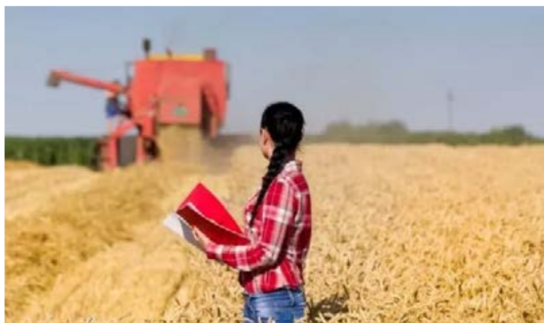
- Pesquisa mostra que para mais de 80% das mulheres o gênero é considerado irrelevante para o progresso da carreira no agronegócio

cio” realizada pela Fundação Dom Cabral no ano passado, para 69% das mulheres que responderam à pesquisa, o gênero não é relevante na tomada de decisões sobre uso do dinheiro e de investimentos nas famílias empresárias do agronegócio e, para 81% delas, esse também não é um atributo relevante no processo de sucessão. Na visão das mulheres do campo, elas são reconhecidas nas fazendas por sua capacidade de liderança, independente do gênero, sendo que 83% daquelas que fazem parte das novas gerações encontram maior abertura para assumir posições de chefia. Esses dados comprovam que as mudanças culturais passaram a fazer parte da agenda cotidiana do setor do agronegócio. (Compre Rural)