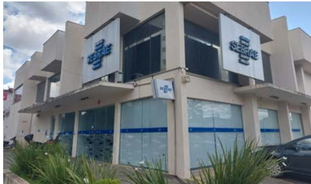
Na programação, palestras gratuitas promovidas pelo Sebrae Minas nos dias 24 e 25 de janeiro, em Montes Claros

Local: Agência de Atendimento Sebrae Minas Monte Claros – avenida Mestra Fininha, 1.448, bairro Funcionários (Agência Sebrae)