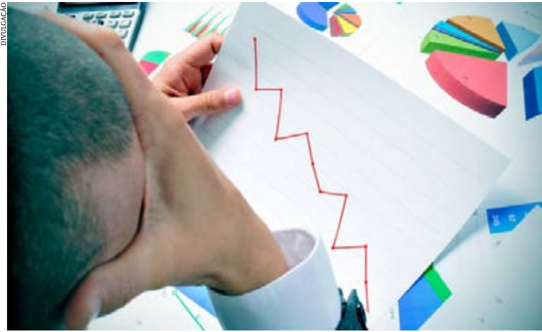
Pesquisa do Sebrae Minas registra quedas sucessivas do Iscon nos últimos três meses de 2022

Em dezembro, os microempreendedores individuais (MEI) foram novamente os mais otimistas entre os portes, repetindo o comportamento confiante obtido no mês anterior, com um Iscon de 109 pontos. As microempresas (ME) registraram 107 pontos, 2 pontos abaixo do registrado em novembro. Já as empresas de pequeno porte (EPP) registraram 102, 2 pontos acima do registrado no mês anterior. (Agência Sebrae)