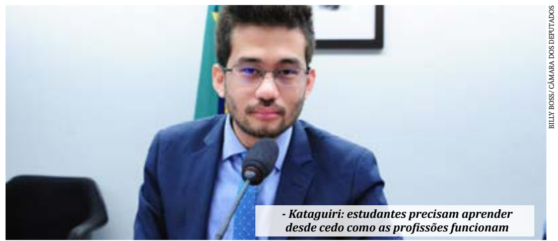
- Kataguiri: estudantes precisam aprender desde cedo como as profissões funcionam

O projeto tramita em caráter conclusivo e será analisado pelas comissões de Educação; e de Constituição e Justiça e de Cidadania. (Agência Câmara)