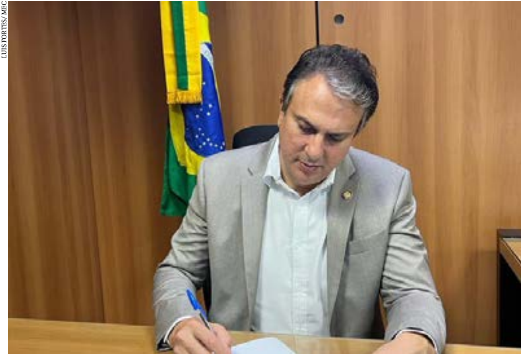
Portaria foi assinada pelo ministro da Educação, Camilo Santana