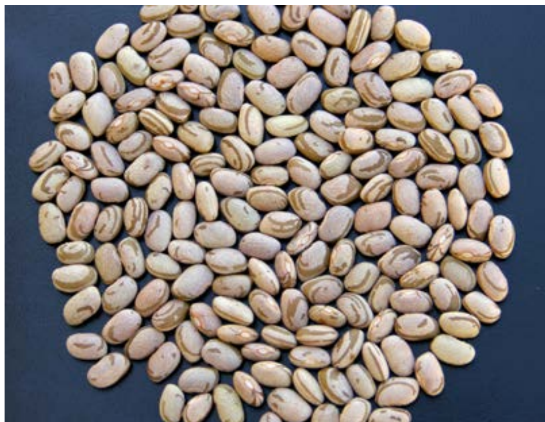
Pacote com dez quilos de sementes pode render até seis vezes mais; expectativa é reforçar orçamento das famílias produtoras

Praticamente todos os municípios mineiros produzem algum tipo de cultura, sendo o milho, feijão e mandioca os produtos de maior distribuição no estado.