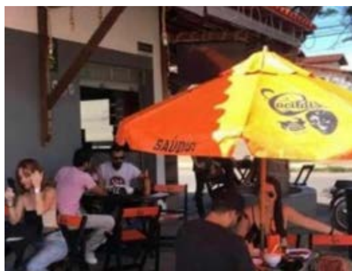
MARQUEM encontro com amigos no barzinho “Fala Fina” na esquina mais charmosa do bairro Morada do Sol.