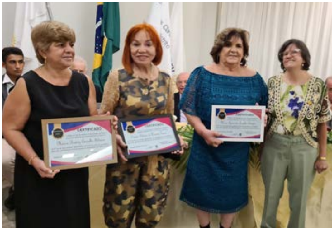
As entregas dos certificados