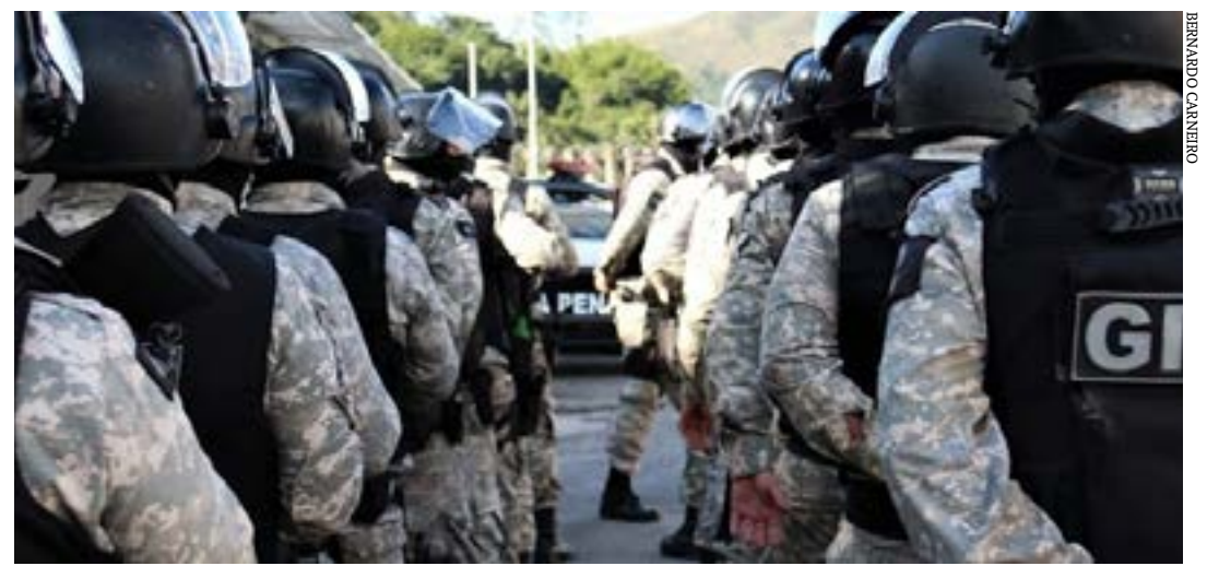
Último concurso foi realizado em 2013; 2.420 vagas serão preenchidas ao final de todas as etapas

A Sejusp já recebeu autorização da Secretaria de Estado de Planejamento e Gestão (Seplag) para a realização de concurso para o cargo de agente socioeducativo. Estão sendo realizados os trâmites para a contratação da empresa executora. (Agência Minas)