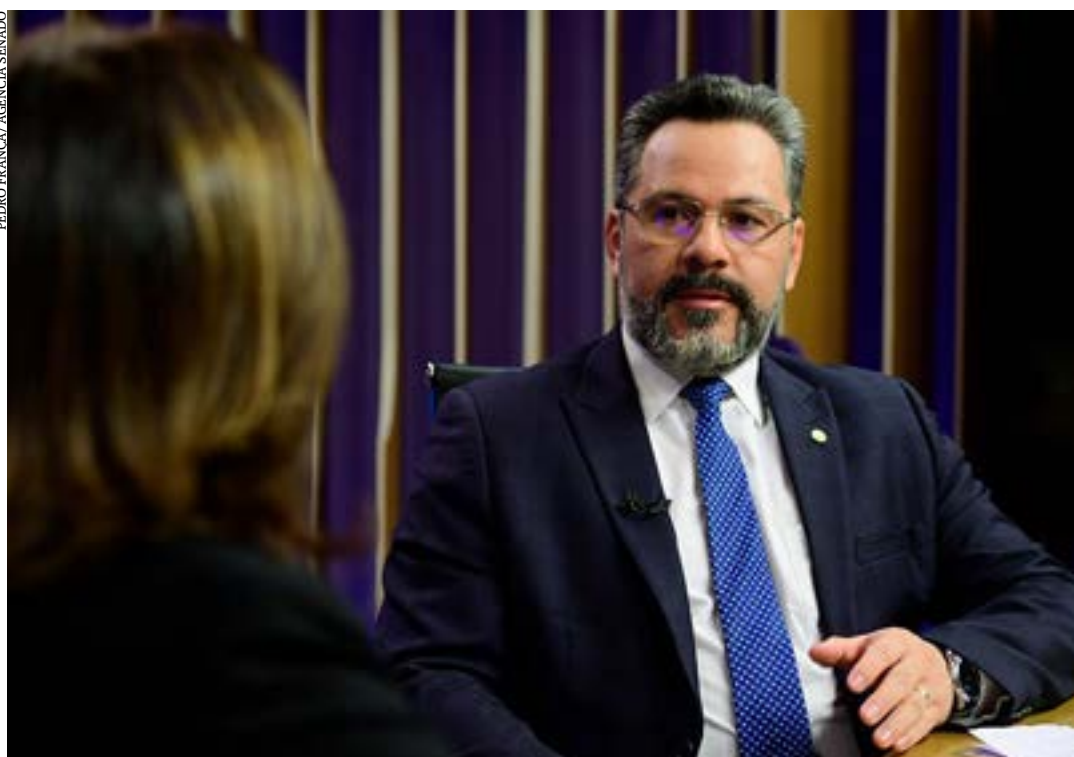
Senador pelo Acre foi deputado federal até a legislatura passada

Já sobre o governo Lula, Alan Rick disse que fará uma “oposição responsável”, e defende que o União Brasil adote uma postura independente em relação ao governo. (Agência Senado)