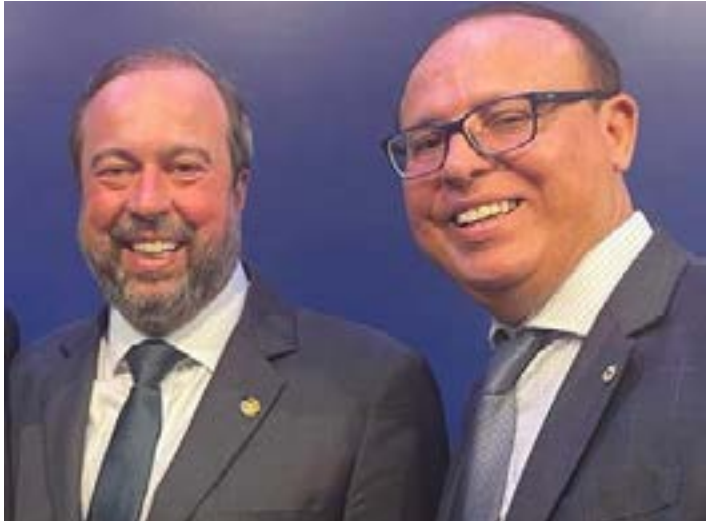
Ministro de Minas e Energia, Alexandre Silveira, e deputado estadual Gil Pereira, durante a solenidade de posse em Brasília

Novo ministro anunciou criação da Secretaria Nacional de Transição Energética, cuja meta é posicionar o Brasil como líder mundial em energia limpa