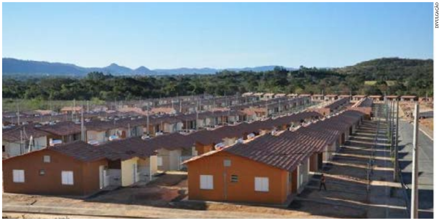
O residencial Montes Claros é um conjunto habitacional contemplado com os cursos

É importante destacar que os cursos estão disponíveis somente para os moradores dos residenciais. Os interessados devem procurar as associações de moradores de cada residencial para realizar sua inscrição.