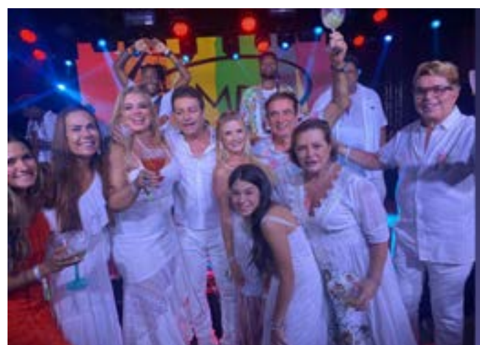
BRINDANDO com amigos o novo ano no réveillon do Kuara