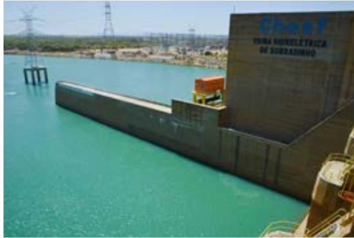
Rio São Francisco nasce em Minas Gerais e as águas da sua bacia também movimentam grandes hidrelétricas no Nordeste brasileiro, incluindo a de Sobradinho, na Bahia (foto), e de Xingó (entre Alagoas e Sergipe)