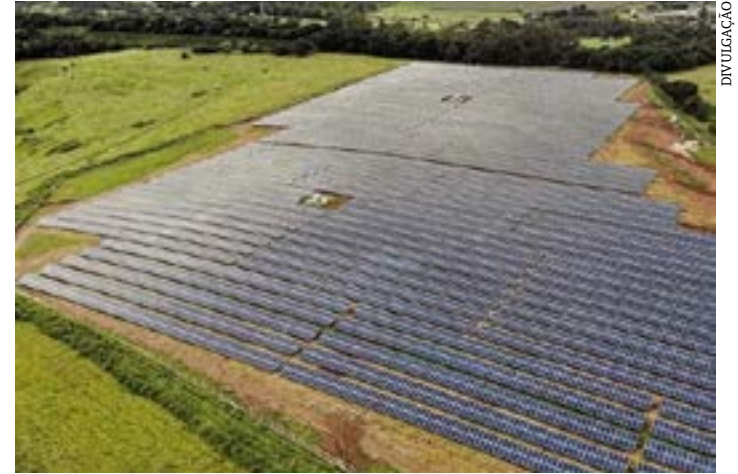
Líder nacional, MG é o primeiro Estado a bater a histórica marca de 4 GW em operação de energia solar fotovoltaica: geração de milhares de empregos, renda, receitas públicas e energia limpa e renovável para toda a população

O deputado Gil Pereira (PSD) prestigiou na segunda-feira (2), em Brasília, a posse do senador mineiro Alexandre Silveira (PSD) como novo ministro de Minas e Energia, numa concorrida cerimônia que contou com a presença de várias autoridades do meio governamental e político brasileiro.