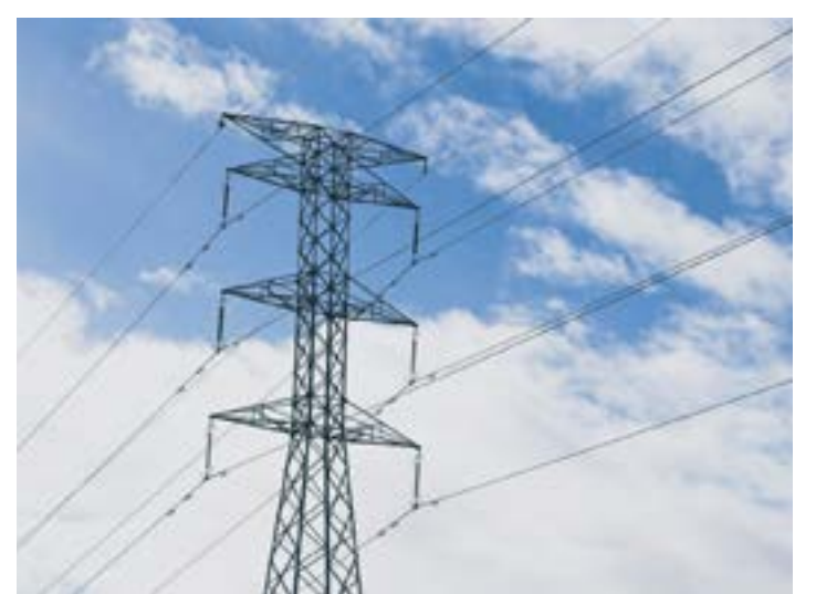
Polo mundial do setor fotovoltaico, Norte de MG receberá novas linhas de transmissão ('linhões'), que viabilizam a implantação de novos parques solares