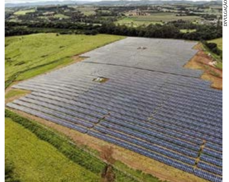
Nos últimos 150 dias, o ritmo do avanço mensal tem sido de praticamente 1 GW, o que coloca a fonte solar na terceira posição da matriz elétrica brasileira

A potência instalada da fonte solar fotovoltaica cresceu mais de 60% de janeiro até a metade de dezembro, saltando de 14,2 GW para 23 GW. Nos últimos 150 dias, o ritmo do avanço mensal tem sido de praticamente 1 GW, o que coloca a fonte na terceira posição da matriz elétrica brasileira, à medida que o setor recebe incentivos, devendo em breve ultrapassar a eólica.