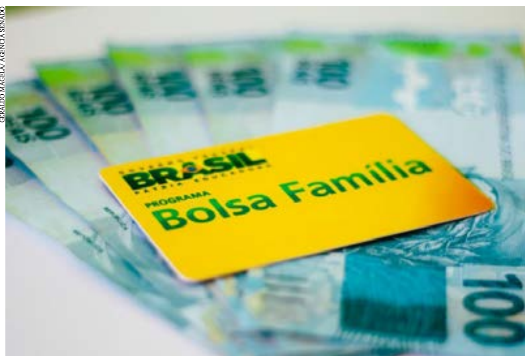
Pagamento do Bolsa Família dependia da aprovação da PEC da Transição

A Câmara dos Deputados aprovou, em 2022, 101 projetos de lei, 54 medidas provisórias, 39 projetos de decreto legislativo, 15 propostas de emendas à Constituição, 8 projetos de lei complementar e 8 projetos de resolução. Além disso, a Comissão de Constituição e Justiça (CCJ) aprovou, em caráter conclusivo, 93 projetos de lei. Uma das últimas matérias analisadas pelos deputados no ano foi a chamada PEC da Transição.