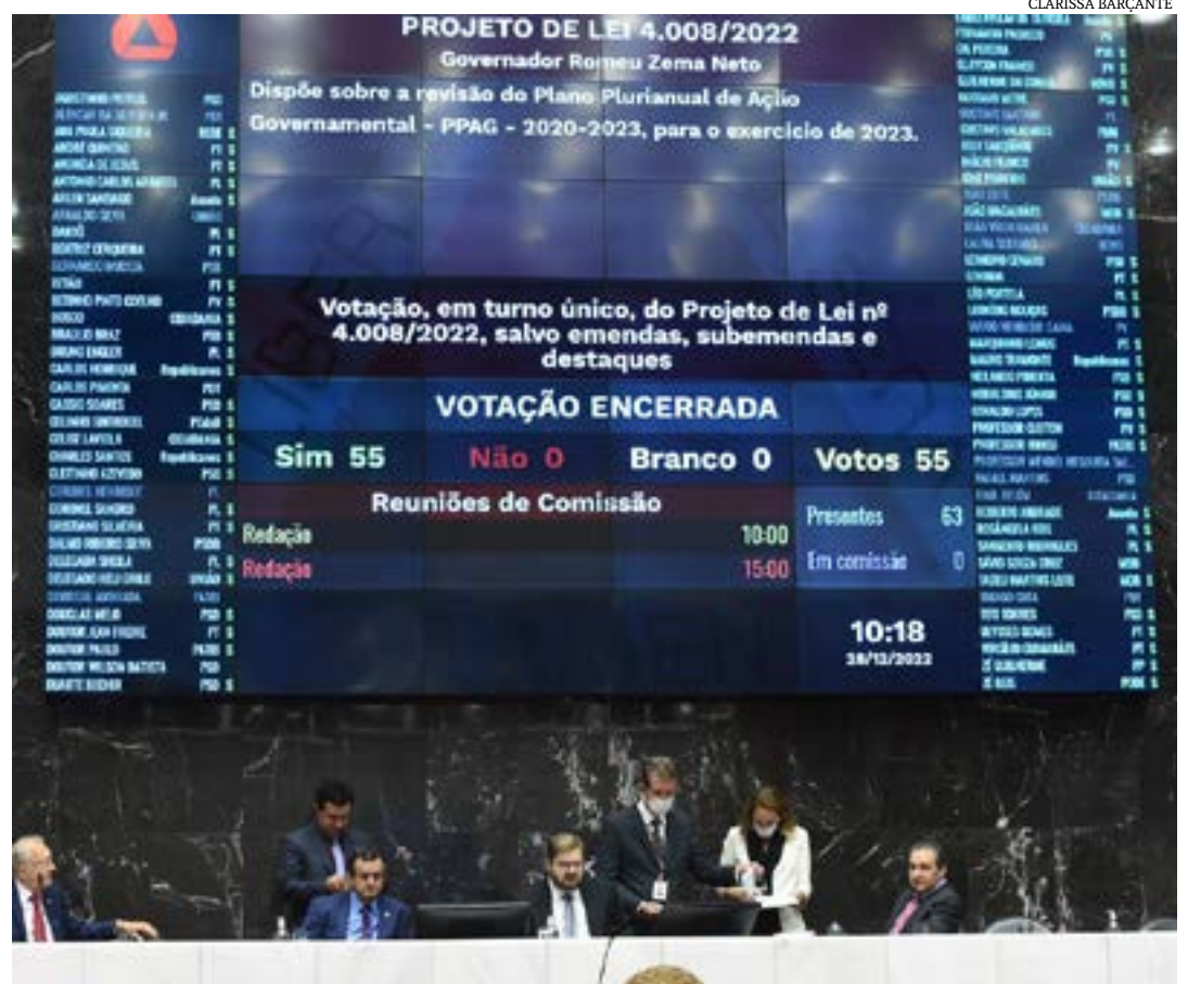
Plenário aprovou os projetos orçamentários em reunião na manhã desta quarta-feira

O Orçamento 2023 foi elaborado, ainda, de modo a cumprir as determinações constitucionais de gastos com saúde (R$ 8,9 bilhões) e educação (R$ 18,6 bilhões).