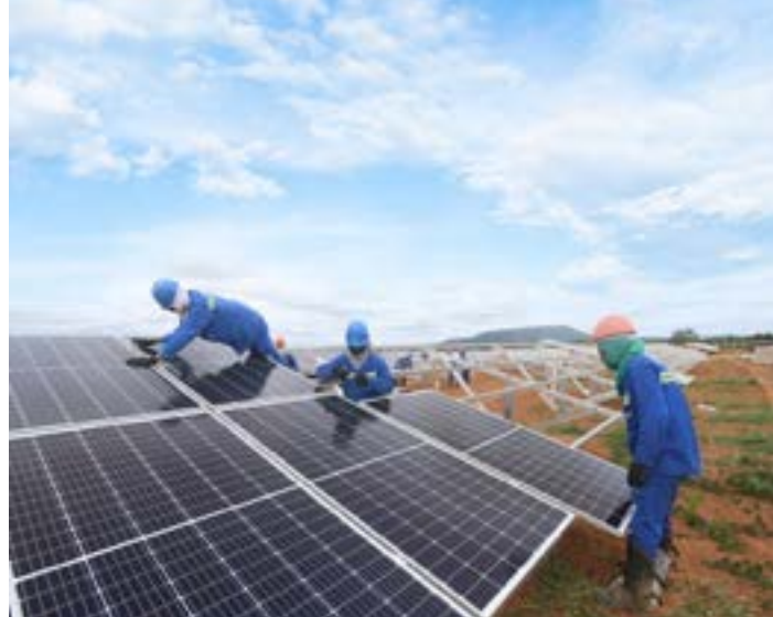
Energia solar já gerou mais de 690 mil empregos, trouxe ao Brasil cerca de R$ 116,6 bilhões em investimentos e mais de R$ 36,6 bilhões em receitas públicas revertidas em saúde, educação e infraestrutura