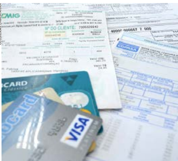
Orientação é que o consumidor priorize o pagamento de dívidas com juros altos e das contas de água e luz, para evitar o corte do fornecimento do serviço

Com o dinheiro do 13º salário na conta, a hora é propícia para trabalhadores e aposentados tratarem de planejar a melhor forma de utilizá-lo. O Procon da Assembleia Legislativa de Minas Gerais (ALMG) dá algumas dicas para preservar o equilíbrio financeiro dos consumidores.