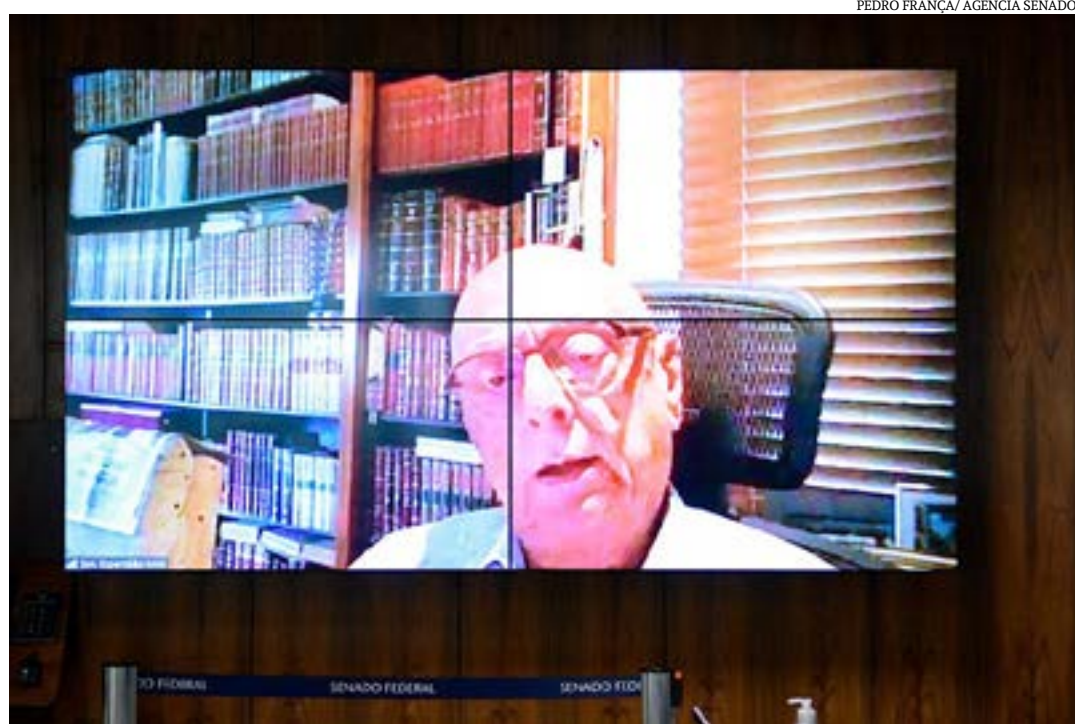
Esperidião Amin foi o relator da matéria no âmbito da Comissão de Educação do Senado (CE)

Além disso, o substitutivo faz referência aos direitos digitais (prevendo o desenvolvimento de mecanismos de conscientização sobre o uso e o tratamento de dados pessoais, nos termos da Lei Geral de Proteção de Dados Pessoais), à promoção da conectividade segura e à proteção dos dados da população mais vulnerável (em especial,