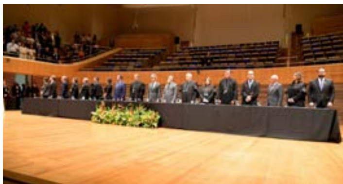
Mesa de honra composta por representantes da Corte Eleitoral, Assembleia Legislativa, Defensoria Pública, OAB, Ministério Público Estadual e Poder Judiciário