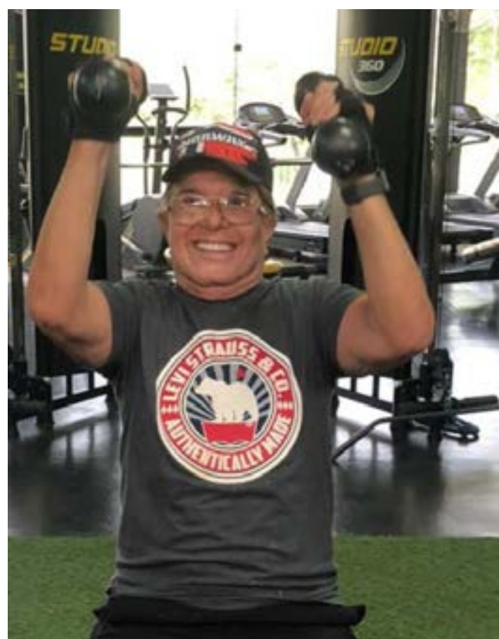
COMO SEMPRE firme diariamente na Academia 360 Studio Fitness.