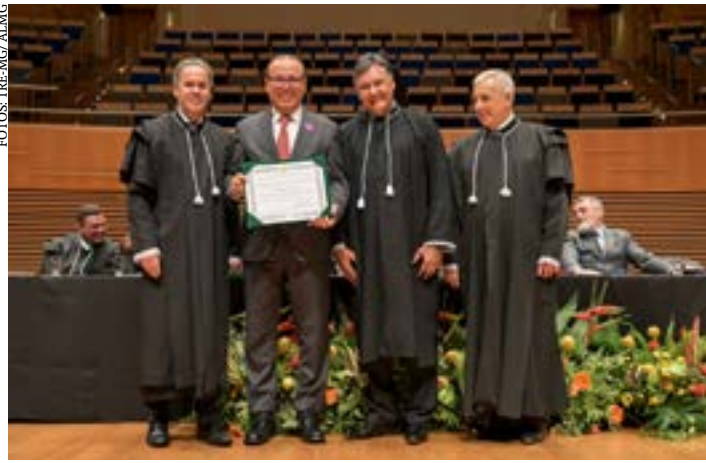
Com trabalho reconhecido e consolidado, dentre aqueles nomes que vão permanecer no Parlamento mineiro, destaca-se o deputado Gil Pereira, que assumirá o oitavo mandato consecutivo em 2023

“Meta é fortalecer o meu reconhecido trabalho na Assembleia Legislativa que tornou MG líder em geração de energia solar, empregos e renda”, ressaltou o parlamentar