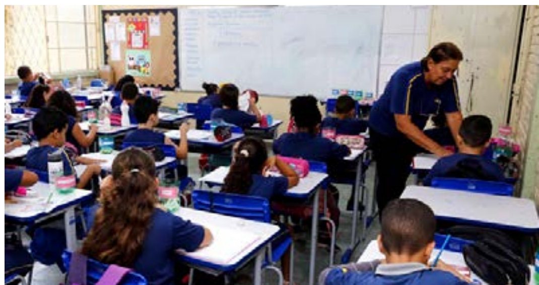
Ações voltadas para recomposição de aprendizagem, em função da Covid-19, estão entre os destaques

elaborar proposta de calendário diferenciado, considerando as especificidades das comunidades locais, devendo submetê-lo à aprovação do Colegiado Escolar e à homologação pelo Serviço de Inspeção Escolar. (Agência Minas)