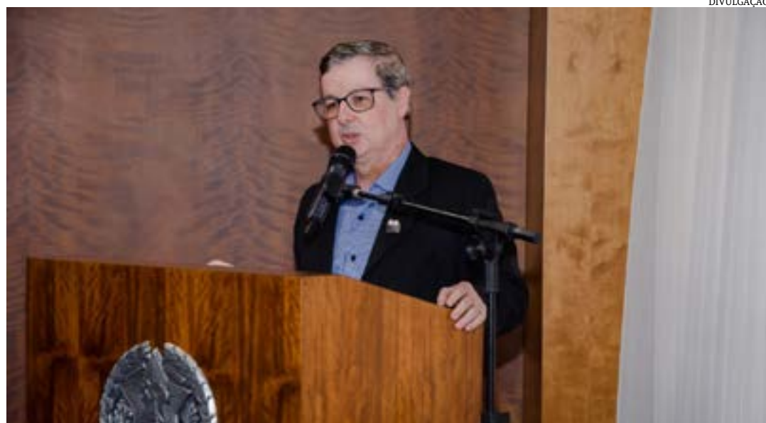
Prêmio busca incentivar as fundações mineiras a adotarem as melhores práticas de gestão, governança, integridade e conformidade