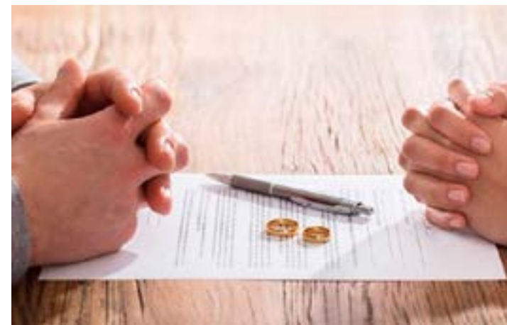
Número é o menor registrado desde 2010. Isolamento social nos anos auge da pandemia e prática de atos de forma online podem explicar recorde de atos em 2021

exemplo, para declarar o Imposto de Renda. Os serviços desta plataforma também estão disponíveis em aparelhos celulares. (Ascom CNB/CF)