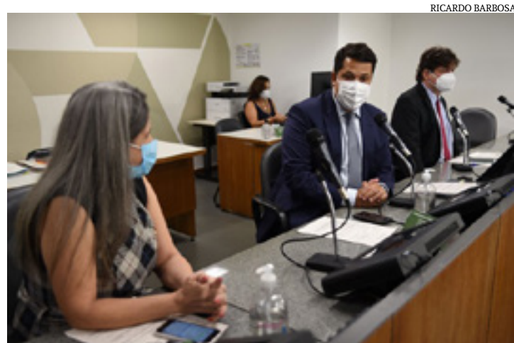
A Comissão de Saúde se reuniu na tarde desta terça-feira (8)

são de Constituição e Justiça (CCJ) aprovou o substitutivo nº 1, que incorpora o conteúdo essencial da proposta à Lei 14.443, de 2002, a qual já dispõe sobre a matéria e autoriza o Poder Executivo a implantar programa de prevenção e de tratamento da obesidade e das doenças dela decorrentes.