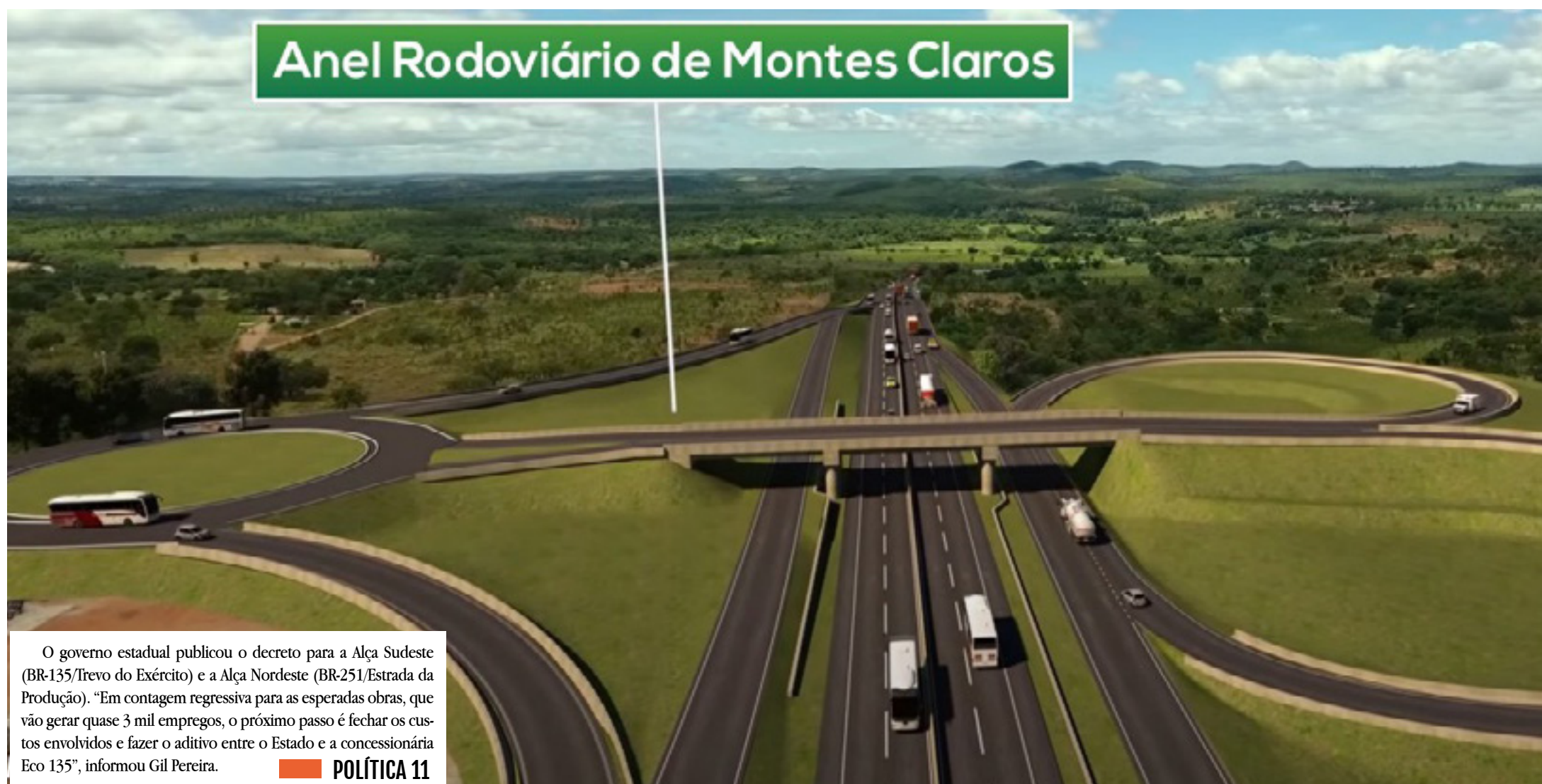
Anel Rodoviário de Montes Claros