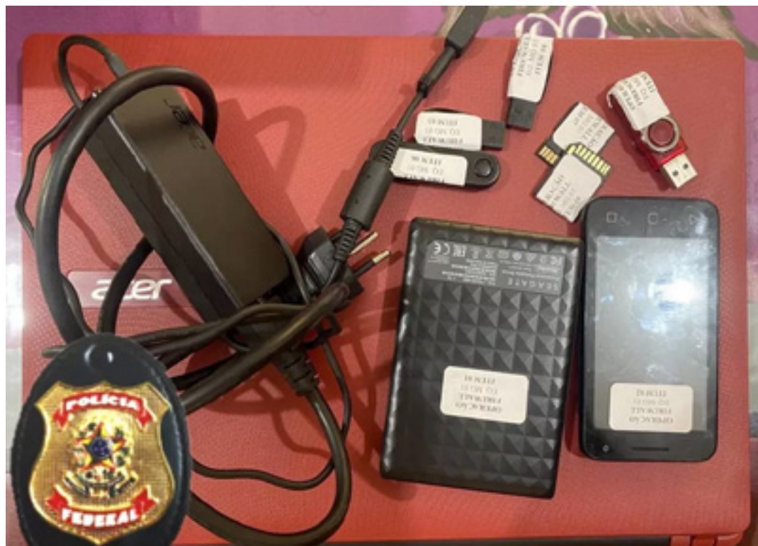
Polícia Federal apreendeu computador, celular e pen drives

Durante a ação, foram apreendidos pen drives, HDs e um notebook.