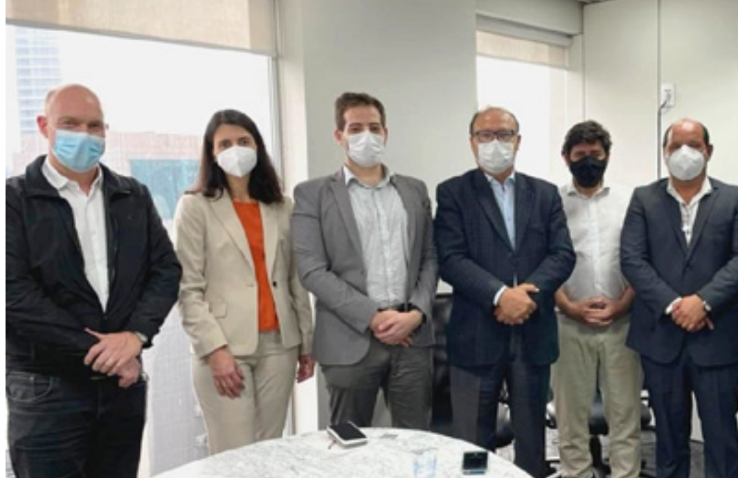
Reunião em São Paulo definiu o acordo final: 16/08/21