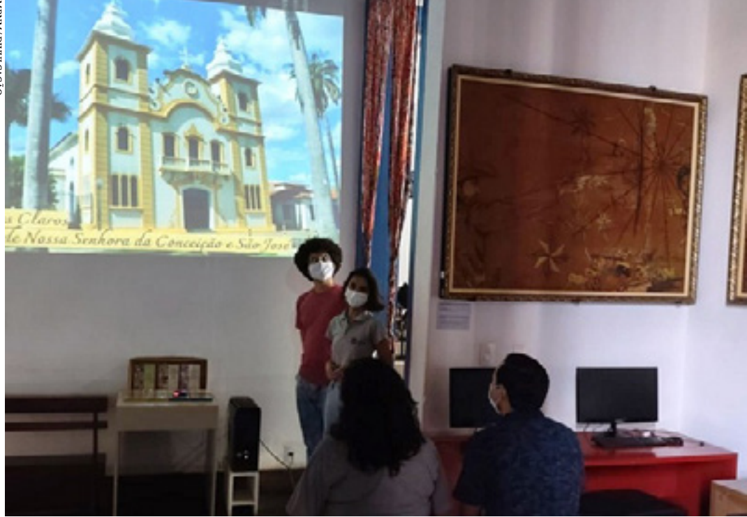
Mostra de imagens sobre igrejas do Norte de Minas acontece no Salão de Projeções do Museu, e entre os destaques a Matriz de Montes Claros, onde a cidade começou

Durante a pandemia, as atrações virtuais mantiveram a interação cultural e histórica com o público