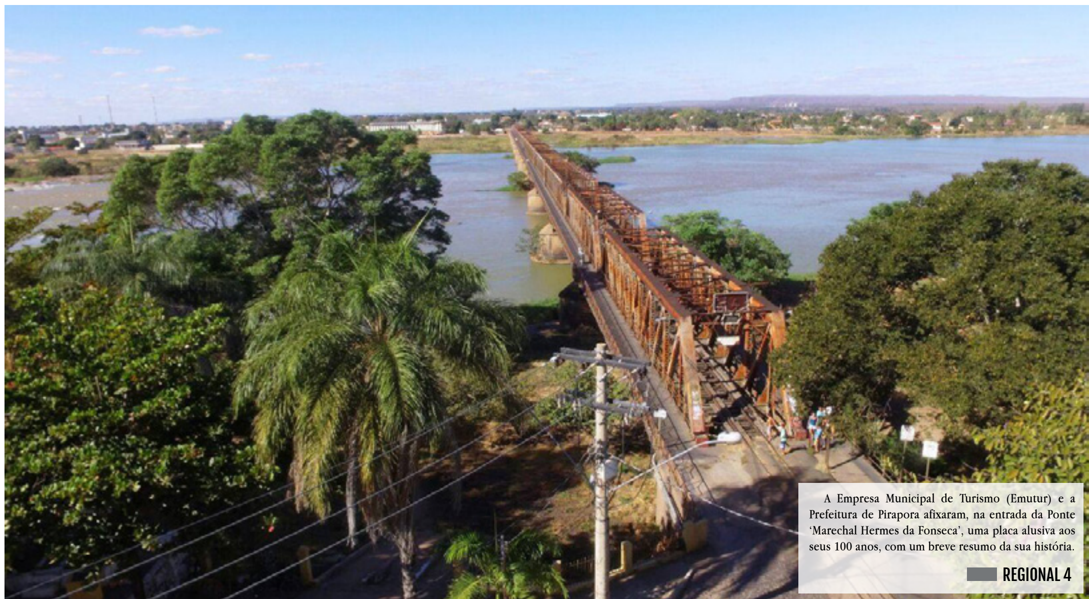
A Empresa Municipal de Turismo (Emutur) e a Prefeitura de Pirapora afixaram, na entrada da Ponte 'Marechal Hermes da Fonseca', uma placa alusiva aos seus 100 anos, com um breve resumo da sua história. REGIONAL 4