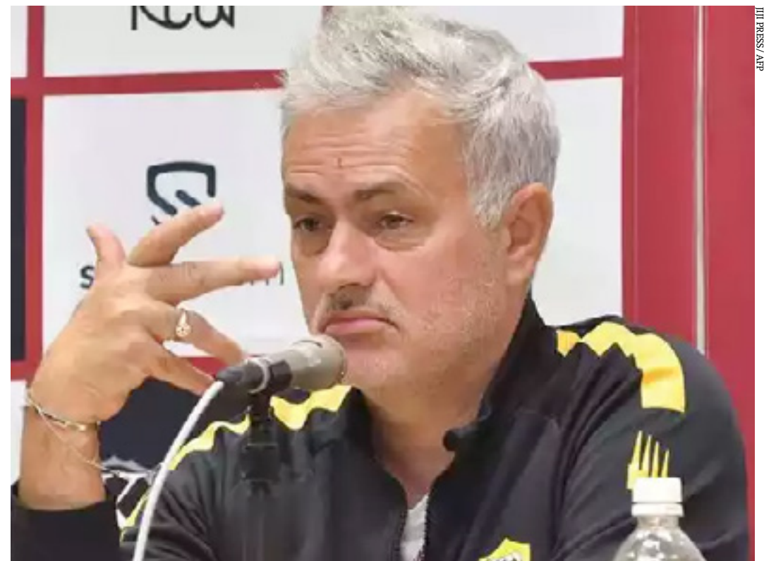
Mourinho é um dos estrangeiros apontados por Ronaldo para assumir a Seleção Brasileira

Ao fim da resposta, teve espaço até para uma "brincadeira", em tom de apelo, à CBF. "Espero que não pensem no Pezzolano, por favor", sorriu. ( Superesportes )