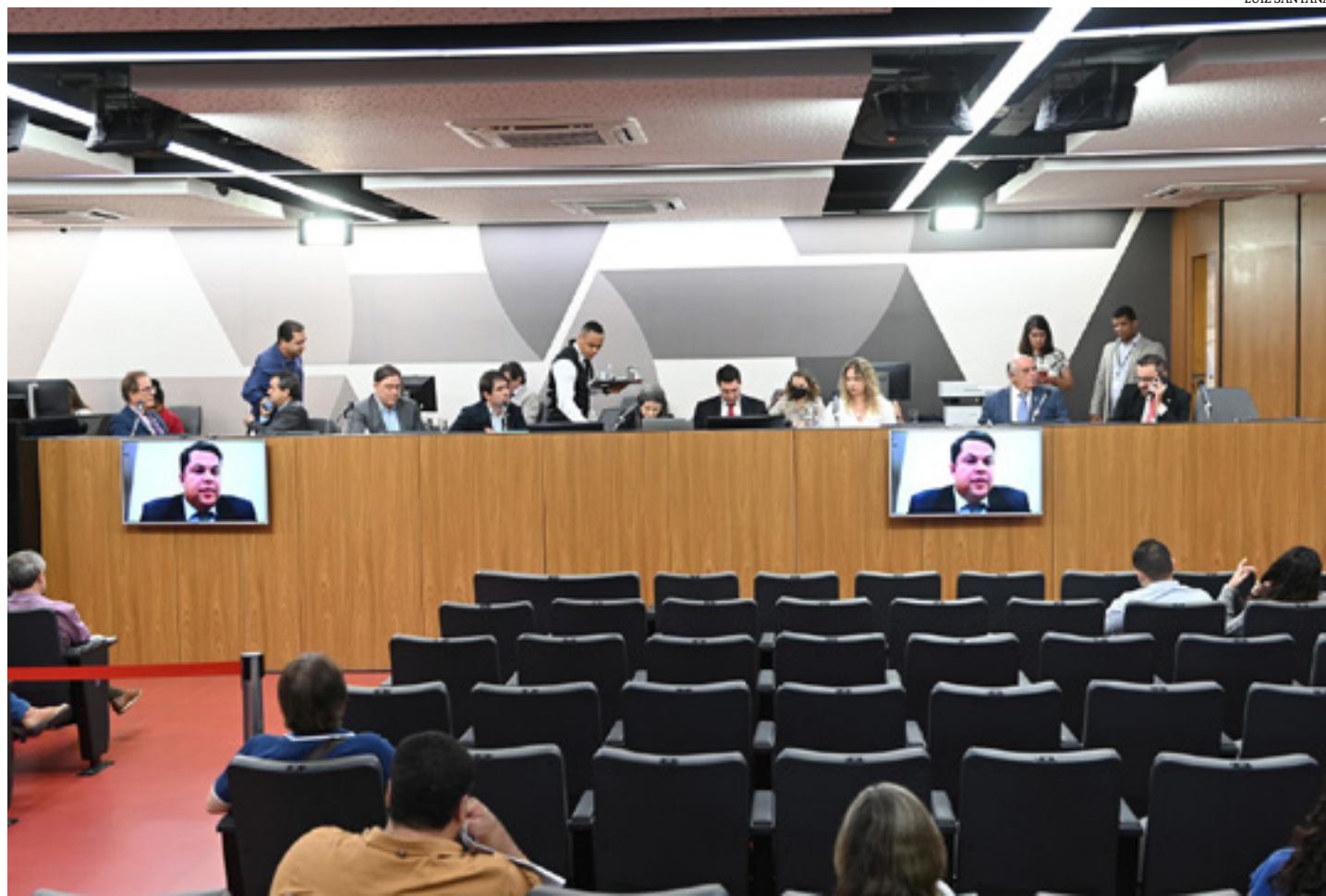
A interiorização dos serviços de saúde foi uma das principais preocupações dos deputados discutidas no Assembleia Fiscaliza