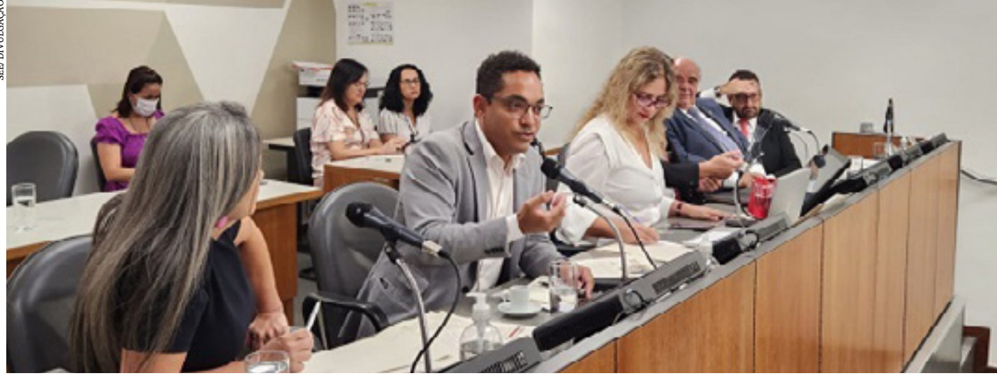
Secretaria apresenta principais ações da pasta em reunião na ALMG. Aproximação com SREs e diretores escolares é um dos pontos de destaque nesta gestão

As principais realizações na área da Educação em Minas Gerais, em 2022, foram apresentadas pela Secretaria de Estado de Educação (SEE), nessa segunda-feira (12), durante o 2º ciclo do Assembleia Fiscaliza, programação promovida pelo Legislativo para acompanhamento de ações e balanço da gestão de cada área do Executivo estadual.