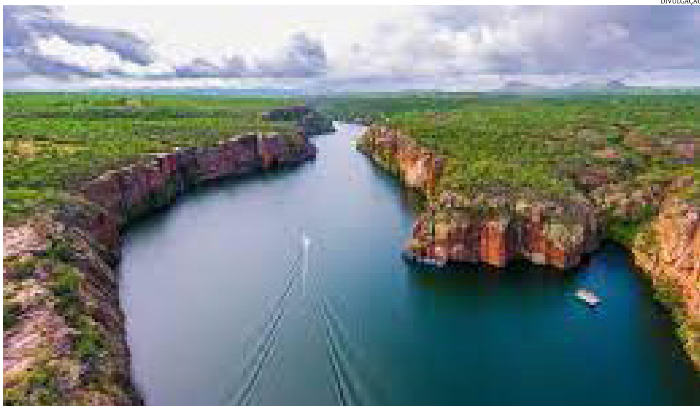
- Rio São Francisco

Entre os artefatos, ela diz que já foram achados esqueletos datados de 8.000 anos atrás. “No caso das pinturas, a gente não consegue determinar tempo, mas pode ser muito superior [a 8.000 anos]. Era uma região habitada por diversos grupos étnicos”, afirma.