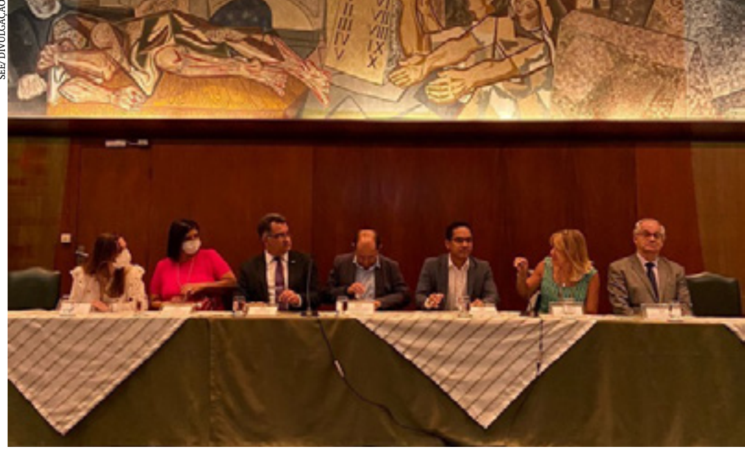
SEE participa da ação realizada pela Undime-MG destacando o Atendimento Educacional Especializado (AEE)

Além do AEE oferecido em sala de recursos, que é um atendimento em caráter complementar e realizado no turno inverso da escolarização do aluno, existem também os atendimentos na forma de apoio que acompanham os alunos durante o turno de escolarização, por meio do professor de apoio à comunicação, linguagem e tecnologias assistivas; o tradutor intérprete de Libras; e o guia-intérprete. Os profissionais para o apoio e suporte aos alunos são disponibilizados nas escolas conforme a necessidade e as atribuições a serem desenvolvidas por cada estudante. (Agência Minas)