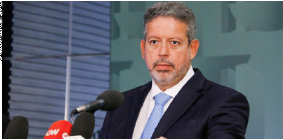
Lira afirmou que a Câmara avançou na pauta do agronegócio

O presidente da Câmara dos Deputados, Arthur Lira (PP-AL), afirmou que os produtores rurais brasileiros têm consciência da importância da preservação ambiental e destacou o Código Florestal como a legislação mais avançada no mundo. Lira disse, no entanto, que problemas orçamentários na área do meio ambiente impedem a adoção de políticas que melhorem a imagem do País no exterior. Ele participou de evento da Frente Parlamentar Agropecuária nessa terça-feira (22), em Brasília.