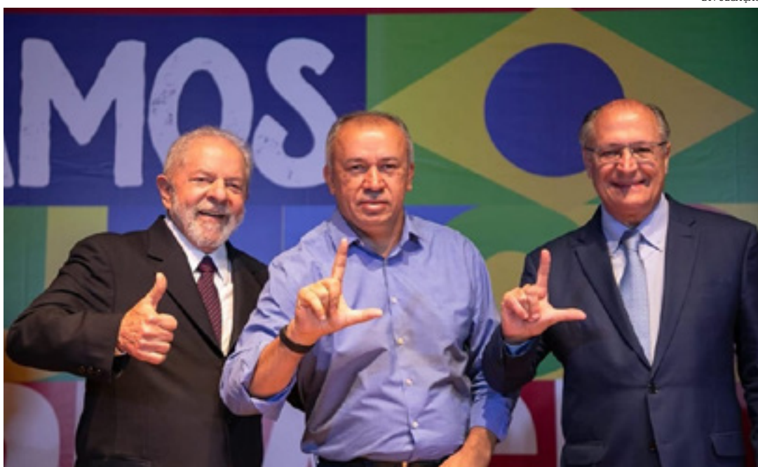
O presidente eleito, Luiz Inácio Lula de Silva, o deputado, Paulo Guedes e o vice-presidente eleito, Geraldo Alckmin

A população pode acompanhar diariamente os debates por meio do portal oficial da transição “O Brasil do Futuro”: gabinete-datransicao.com.br. O site reúne informações sobre o que é o gabinete de transição, boletins informativos, documentos técnicos e notícias, além de uma lista com os nomes das pessoas que fazem parte da equipe.