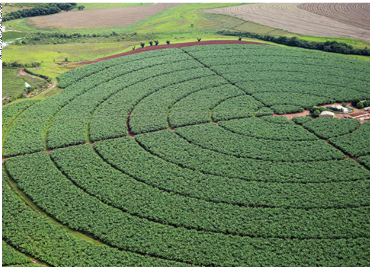
Alta se deve ao comportamento positivo de indicadores, diz Fiesp

O Índice de Confiança do Agronegócio (IC Agro) avaliado pela Federação das Indústrias do Estado de São Paulo (Fiesp) fechou o terceiro trimestre de 2022 em 116,3 pontos, um crescimento de 6,1 pontos sobre o levantamento anterior e de 5,4 pontos sobre o primeiro trimestre de 2022. Segundo a Fiesp, a alta se deve à melhoria da avaliação da economia e ao comportamento positivo de alguns indicadores.