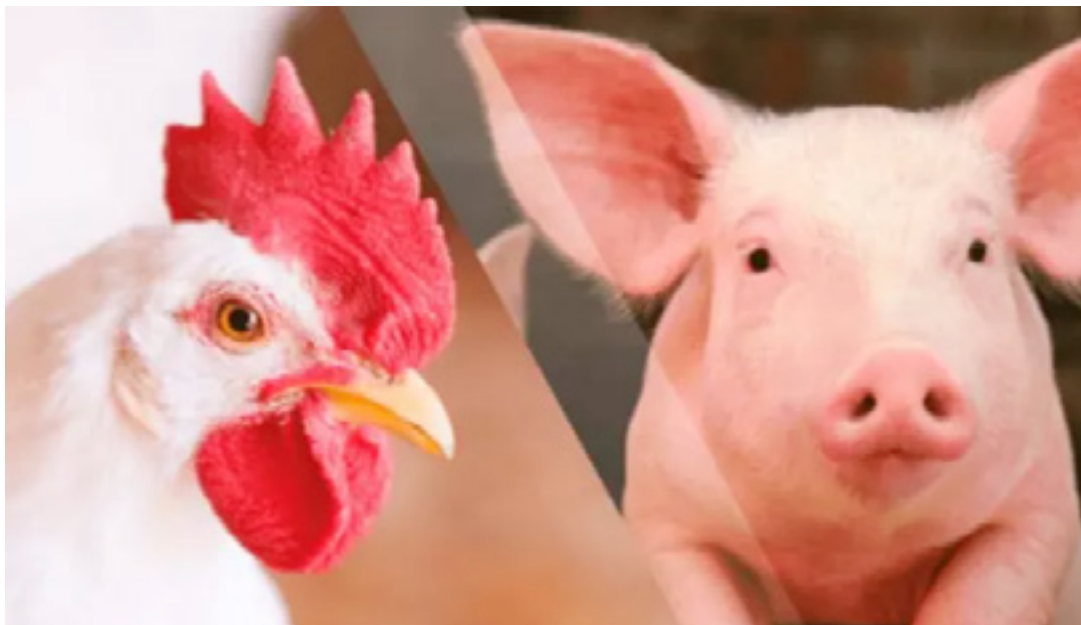
Frango apresentou queda em todos os itens de composição, com exceção de sanidade (que se manteve estável) e nutrição (alta de 0,19% em relação a setembro)

gestão da granja a planilha eletrônica feita pela Embrapa. A planilha pode ser baixada de graça no site da CIAS. (Embrapa Suínos e Aves)