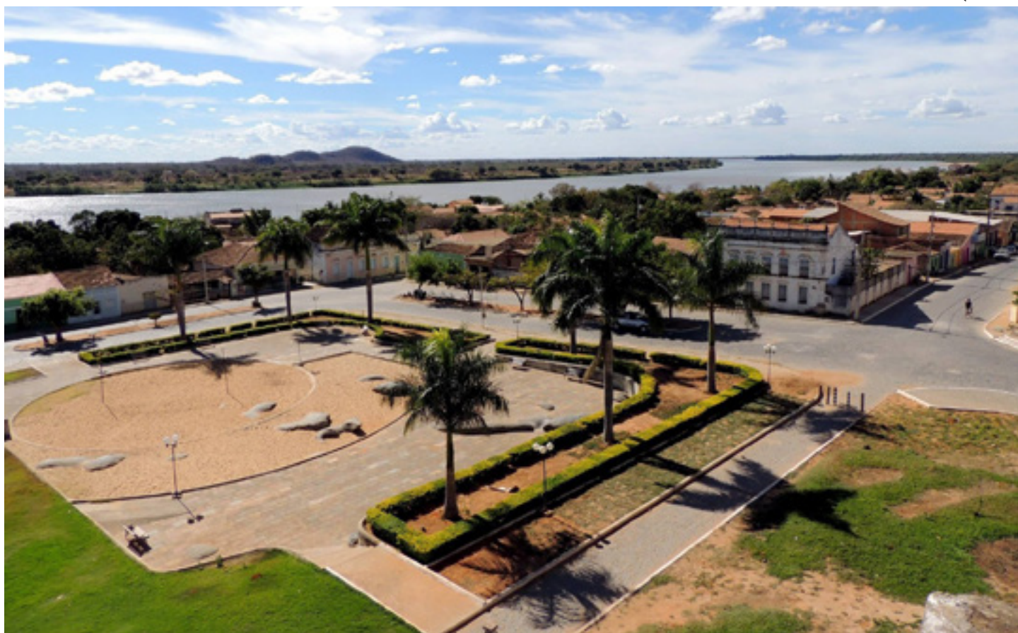
Município promove o evento nesta terça-feira (22)