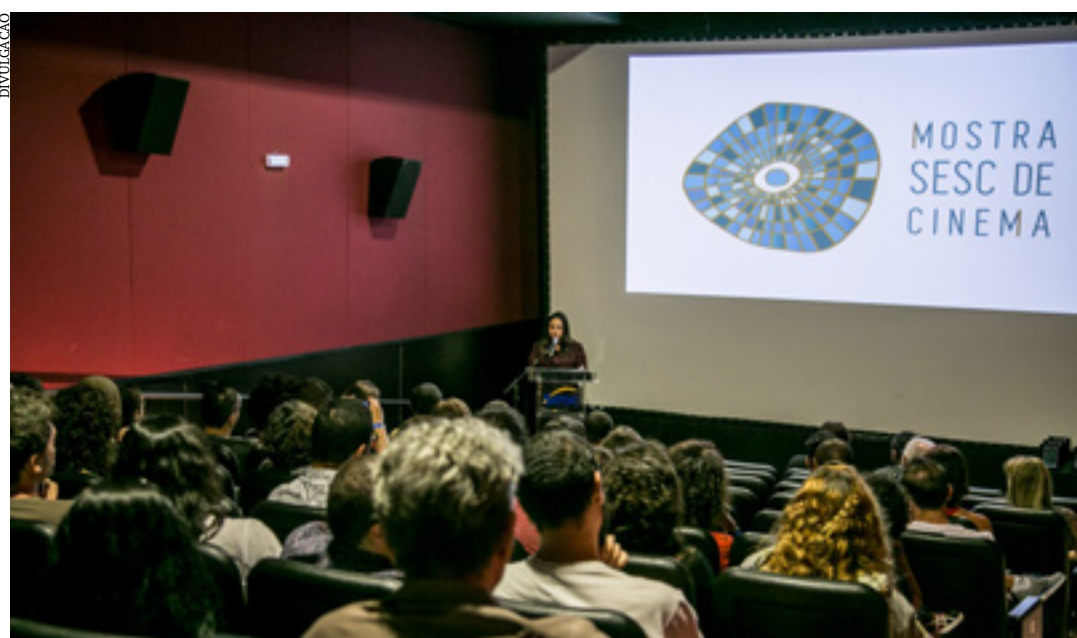
Além da etapa nacional, etapa mineira leva exibições presenciais a Montes Claros e outras cidades dezembro

22 de dezembro – 18h África em São João del Rei Não vim no mundo para ser pe-dra Minero di Mina Adeus, Calon (Ascom Sesc-MG)