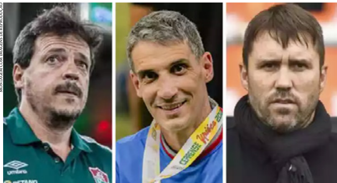
Fernando Diniz, Vojvoda e Eduardo Coudet eram opções de voto na enquete para a torcida do Atlético

Foram pouco mais de 24 horas de votação. Uma enquete promovida pelo Superesportes revelou o favorito de parte da torcida do Atlético para assumir o comando técnico do clube mineiro em 2023. Trata-se do argentino Juan Pablo Vojvoda, que dirige o Fortaleza.