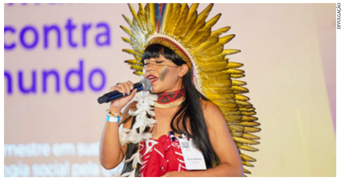
A deputada federal Célia Xakriabá

A nomeação de Célia Xakriabá fez criar uma expectativa sobre a pavimentação da BR-135, no trecho de Itacarambi a Manga, passando por São João das Missões, onde está a reserva indígena Xakriabá. A obra foi embargada em 1988, pelo Tribunal de Contas da União (TCU), por suspeita de superfaturamento. No ano passado, o Ministério da Infraestrutura chegou a anunciar a obra, mas sem que fosse retomada. (GA)