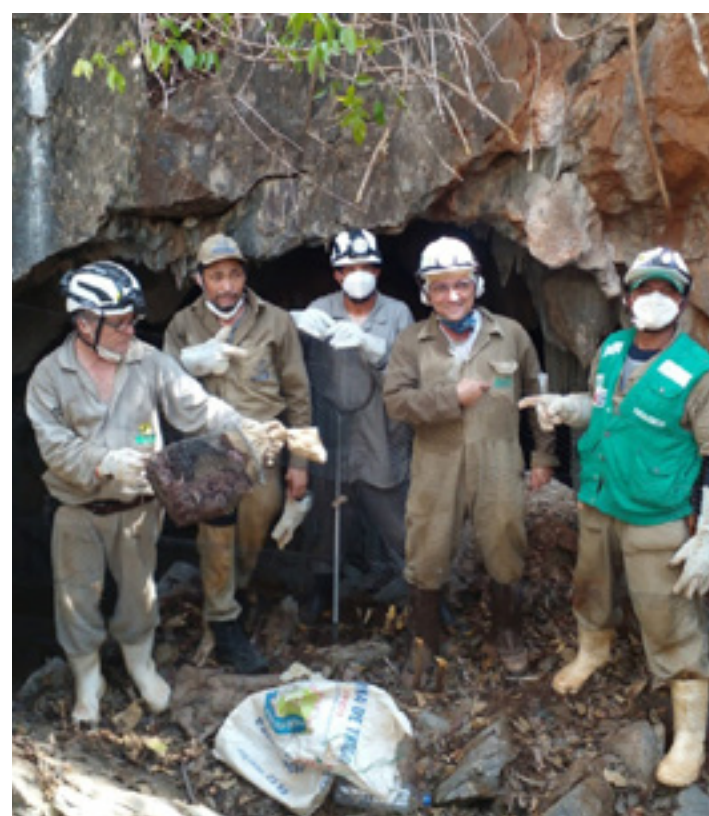
Parceria com a Superintendência Regional de Saúde de Montes Claros incluiu cursos teóricos e práticos

SAÚDE ÚNICA - A saúde única é uma abordagem que reconhece a saúde humana intrinsecamente ligada à saúde dos animais e ao meio ambiente compartilhado, tendo