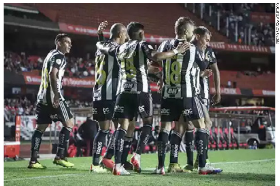
Atlético pode ficar muito próximo da vaga se vencer o Cuiabá nesta quinta-feira

*Dados do Departamento de Matemática da UFMG (Superesportes)