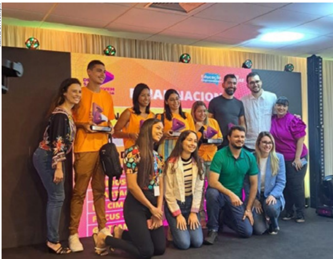
Equipe 'Líderes da Nova Geração' ficou em segundo lugar no jogo virtual promovido pelo Sebrae Minas

A equipe Líderes da Nova Geração, formada por alunos do 2º módulo do curso técnico em Administração, do Instituto Federal de Educação Ciência e Tecnologia do Norte de Minas Gerais (IFNMG), em Janaúba, foi uma das vencedoras do prêmio nacional Desafio Jovem Empreendedor 2022. A final foi realizada, em Recife (PE).