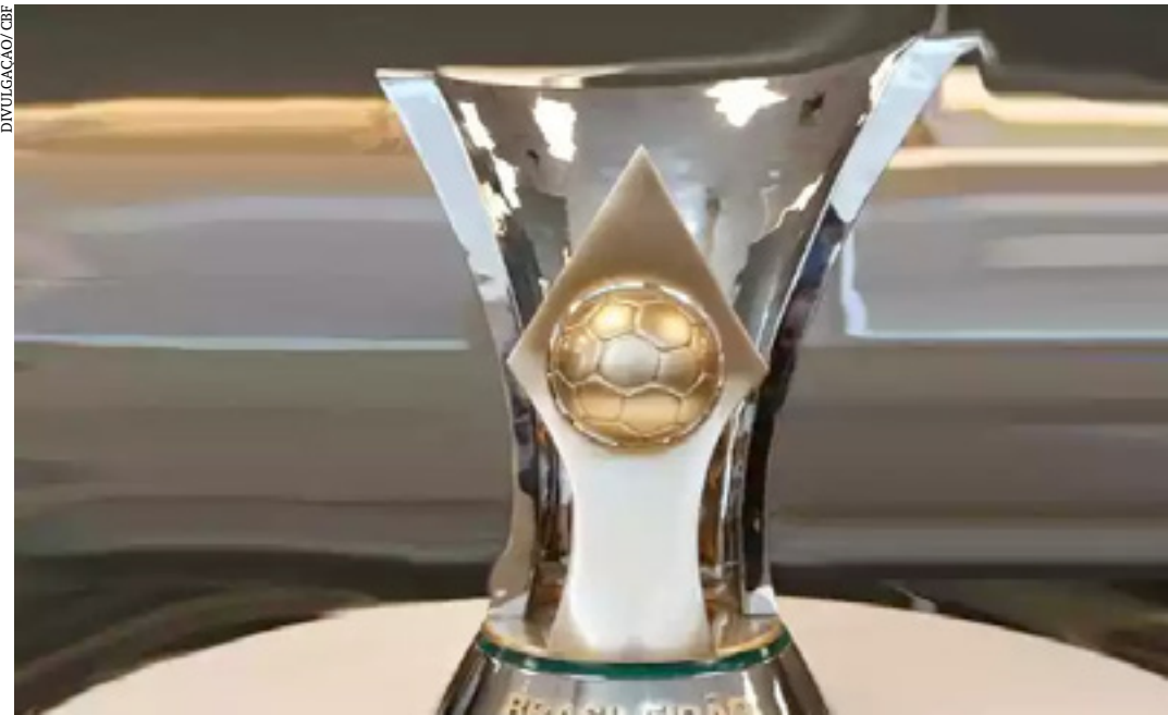
Campeonato Brasileiro pode ser vendido para grupo dos Emirados Árabes Unidos

O negócio está ativo no Brasil desde 2011 e construiu um portfólio de ativos privados e públicos por meio da conclusão de uma série de transações, incluindo fusões e aquisições, reestruturações, entre outros. A empresa está sediada no Rio de Janeiro e é apoiada pelos escritórios da Mubadala Capital em Nova York e Abu Dhabi. ( Superesportes )