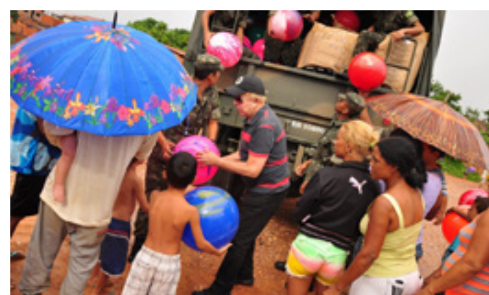
NA PRÓXIMA SEMANA, iniciarei a tradicional CAMPANHA DO NATAL para fazer a alegria das criancinhas carentes em dezembro. Já encomendei alguns brinquedos e espero voltar a contar com a participação de todos que poderão me enviarem UMA BOLA, CARRINHO E BONECAS. Veja nesta foto da última distribuição. Estamos juntos nesta TRADICIONAL CAMPANHA que vem acontecendo há várias décadas.