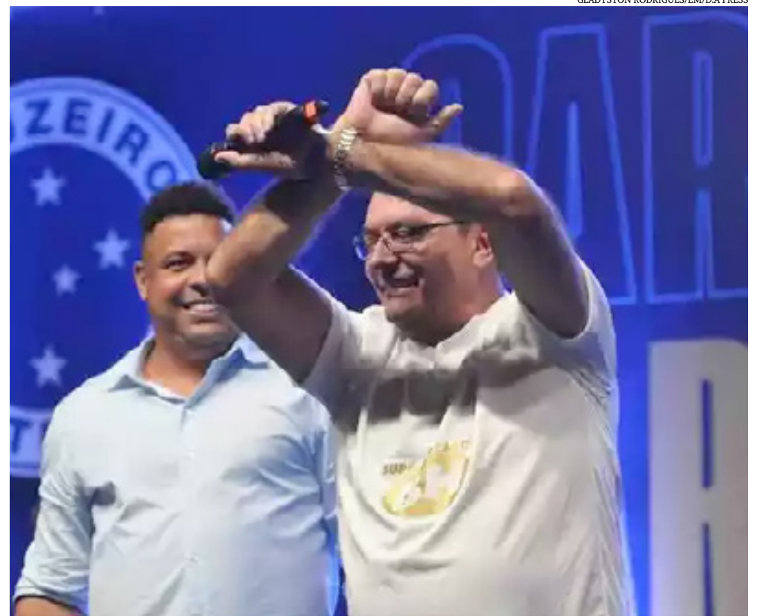
Pedro Lourenço alinha parceria com Ronaldo e o Cruzeiro para 2023