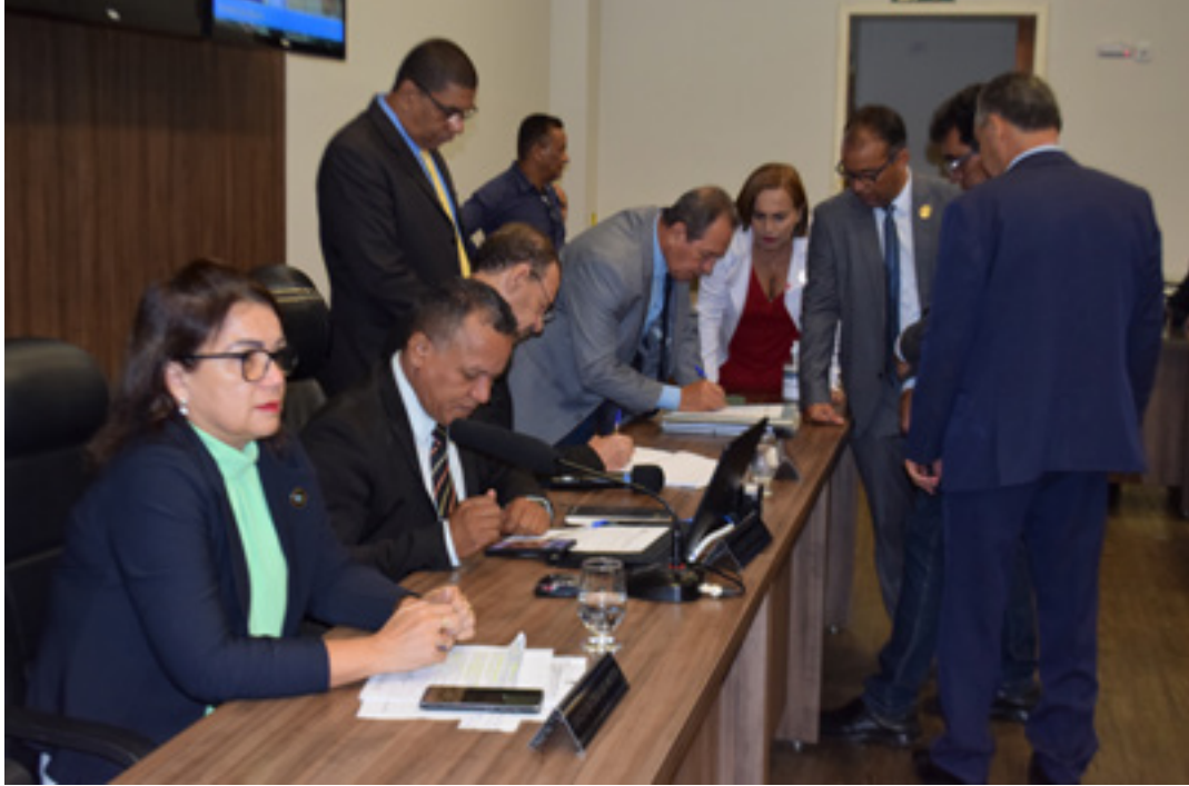
A reunião desta terça-feira na Câmara de Vereadores