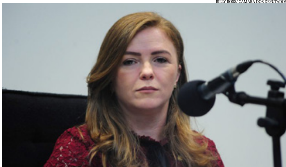
Deputada Leandre, relatora da proposta