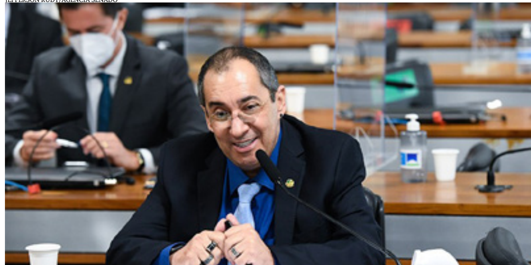
O projeto é de autoria do senador Jorge Kajuru

Está em tramitação no Senado projeto que regulariza, na Consolidação das Leis do Trabalho (CLT), o fornecimento de alimentação, no local de trabalho, ou de auxílio-alimentação, para os empregados em empresas com mais de 100 servidores. Para que isso aconteça, o PL 2.548/2022, de autoria do senador Jorge Kajuru (Podemos-GO), adiciona novo artigo na CLT aprovada pelo Decreto-Lei 5.452/1943.