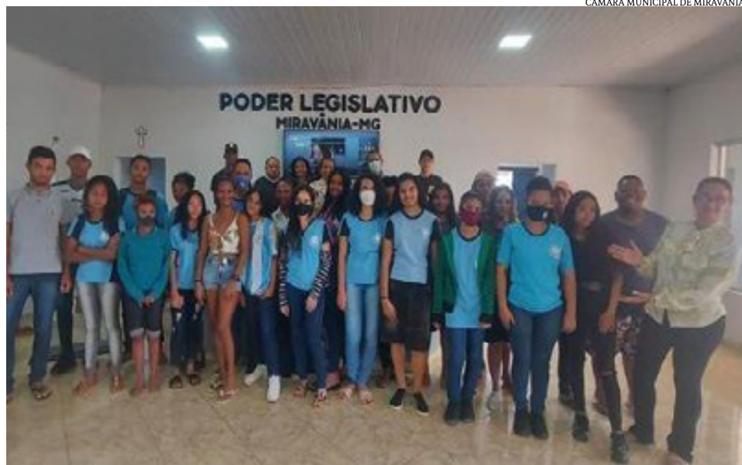
Estudantes de Miravânia foram atuantes nas redes sociais e garantiram prêmio de protagonismo juvenil