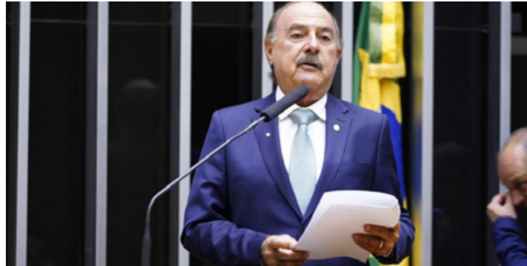
Calil: "É preciso sensibilizar os gestores da importância do teste do pezinho"