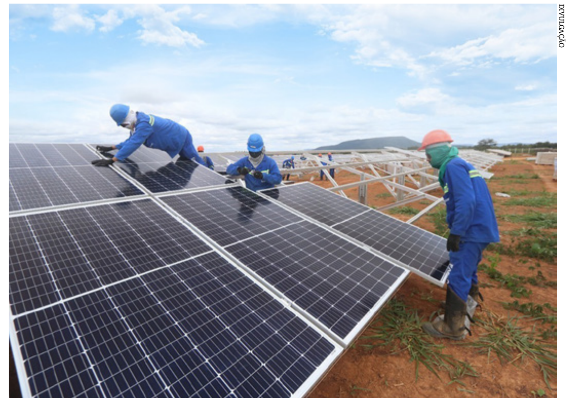
Mais de 107 mil empregos foram criados no Estado, que recebeu, somente entre 2019 e 2022, cerca de R$ 50 bilhões em projetos solares

REFERÊNCIA INTERNACIONAL | Polo mundial do setor so-