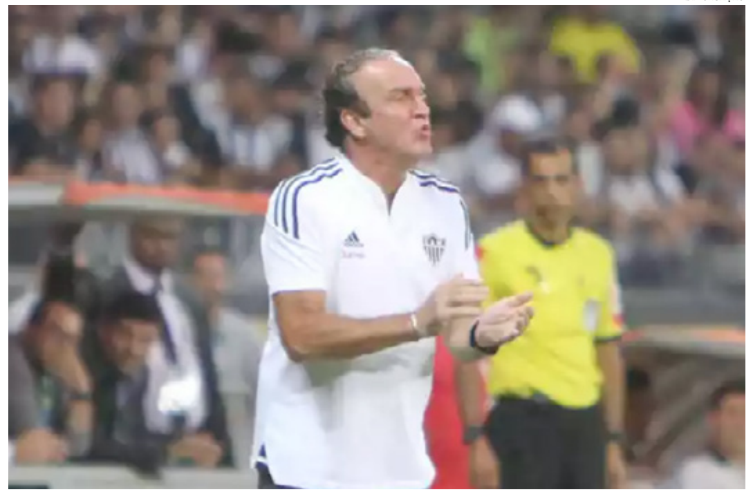
O Atlético enfrentará o Flamengo às 20h30 do próximo sábado (15/10), no Maracanã, no Rio de Janeiro. A partida será válida pela 32ª rodada da Série A. (Superesportes)

"Trabalhar tudo. Continuar insistindo em melhorar todos, não o time. A gente tem 15, 16 jogadores titulares. Continuar usando esses jogadores e insistir no que a gente tem feito, nas opções táticas que a gente tem feito. (...) Conseguimos jogar o adversário para trás e ter o controle do jogo, mas as decisões finais foram erradas. Os lances decisivos foram muito claros. Uma bola dessa que entra muda todo o jogo", encerrou.