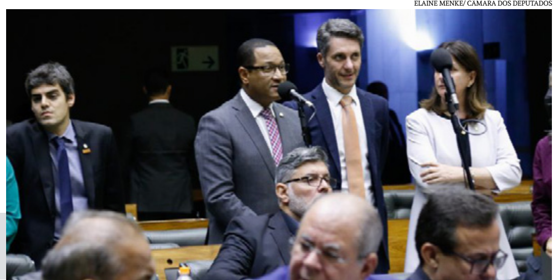
ELAINE MENKE/CÂMARA DOS DEPUTADOS