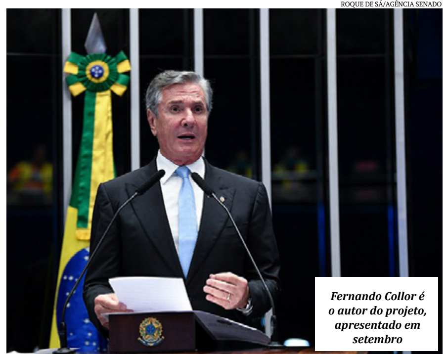
Fernando Collor é o autor do projeto, apresentado em setembro

Pouco mais de um ano após sua criação, o Congresso Nacional aprovou nova lei, com mudanças nas regras e tornando o programa perma-