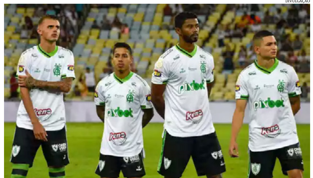
G4, soma 52 pontos. Até o fim do campeonato, o América enfrentará três equipes que estão à sua frente na tabela: Flamengo, Internacional e Palmeiras. (Superesportes)

Atualmente, a equipe comandada por Wagner Mancini está na 8ª colocação, a dois pontos do 7º, Atlético, que tem 47. O Flamengo, último time dentro do