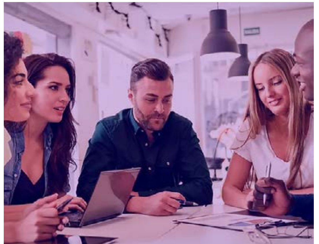
Pequenos negócios representam 99% das empresas mineiras e, nos últimos três anos, geraram 84% de todo o saldo de empregos do estado

tos 51% Microempreendedores Individuais (MEI) 27% Micro e Pequenas Empresas (MPE) 22% Produtores rurais 99% das empresas de Minas Gerais 57% dos empregos 41% da massa salarial