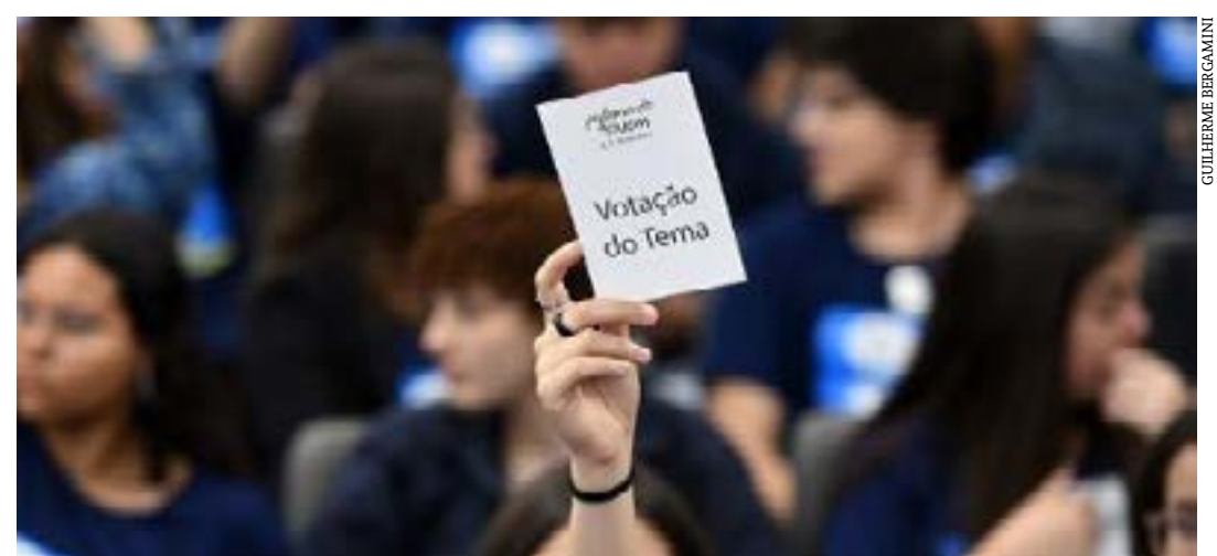
Mercado de trabalho foi o tema mais votado por alunos do ensino médio durante a etapa estadual

O PJ Minas é um programa de formação política e cidadã destinado aos estudantes do ensino médio, realizado pela ALMG em parceria com câmaras municipais e com apoio da PUC Minas. Participaram, em 2022, 121 câmaras municipais, divididas em 18 polos. (Portal ALMG)