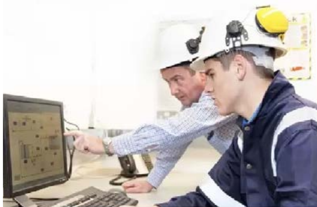
Formação gratuita oferece oportunidade para jovens entre 18 e 23 anos

Estão abertas as inscrições do processo seletivo de mais um ciclo do Programa de Aprendizagem Cemig, para o curso de Eletricista de Linhas de Redes Aéreas de Distribuição de Energia Elétrica. Trata-se de uma iniciativa da companhia, em parceria com o Serviço Nacional de Aprendizagem Industrial (Senai), que visa a formação de mão de obra especializada para o setor de energia do estado de Minas Gerais. As inscrições podem ser realizadas até o próximo dia 12/10, no endereço cemig.com.br .