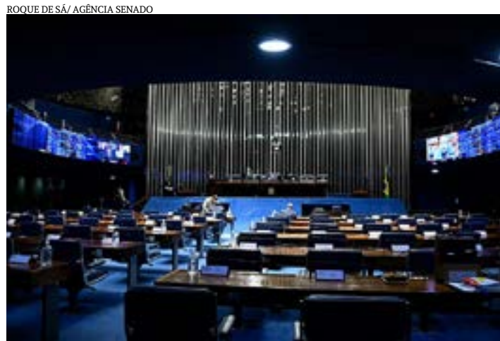
Plenário do Senado: legislatura com início em 2023 terá número menor de bancadas, 15, sendo 4 grandes

“Seguramente os votos a mais que obteve foram capitalizados pelos seus candidatos ao Legislativo. Isso explica o fato de a bancada ter crescido”. (Agência Senado)