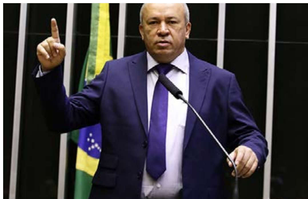
Paulo Guedes (PT)