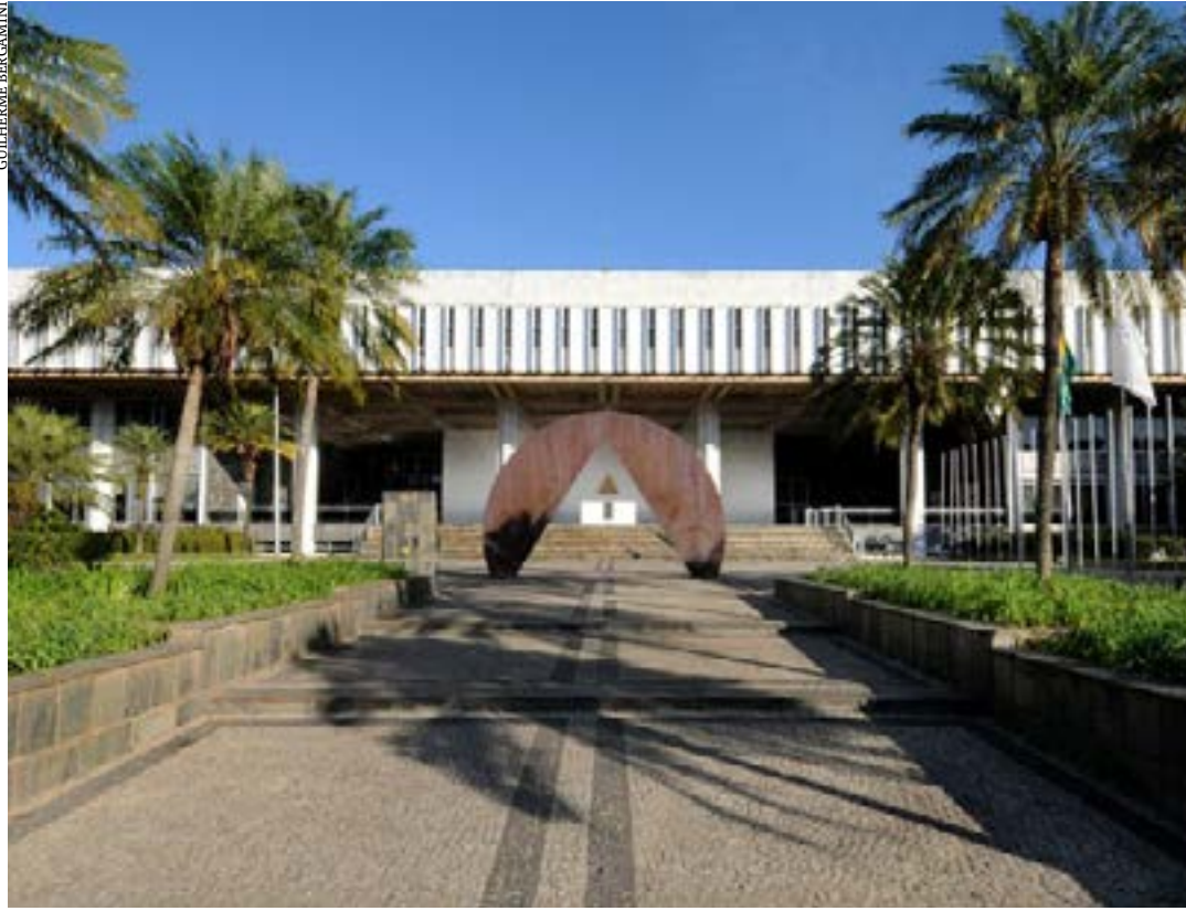
Dos 66 atuais deputados que tentaram a reeleição para a ALMG, 52 retornaram, perfazendo um índice de 67,53% de sucesso

Em 2006, as mudanças ocorreram em 40,25% das vagas. A renovação nas eleições de 2010 e 2014 representou pouco mais de um terço dos deputados que tentaram reeleição: 36,36% e 33,77%, respectivamente. Já em 2018 a renovação ficou em 40,25%. (Portal ALMG)