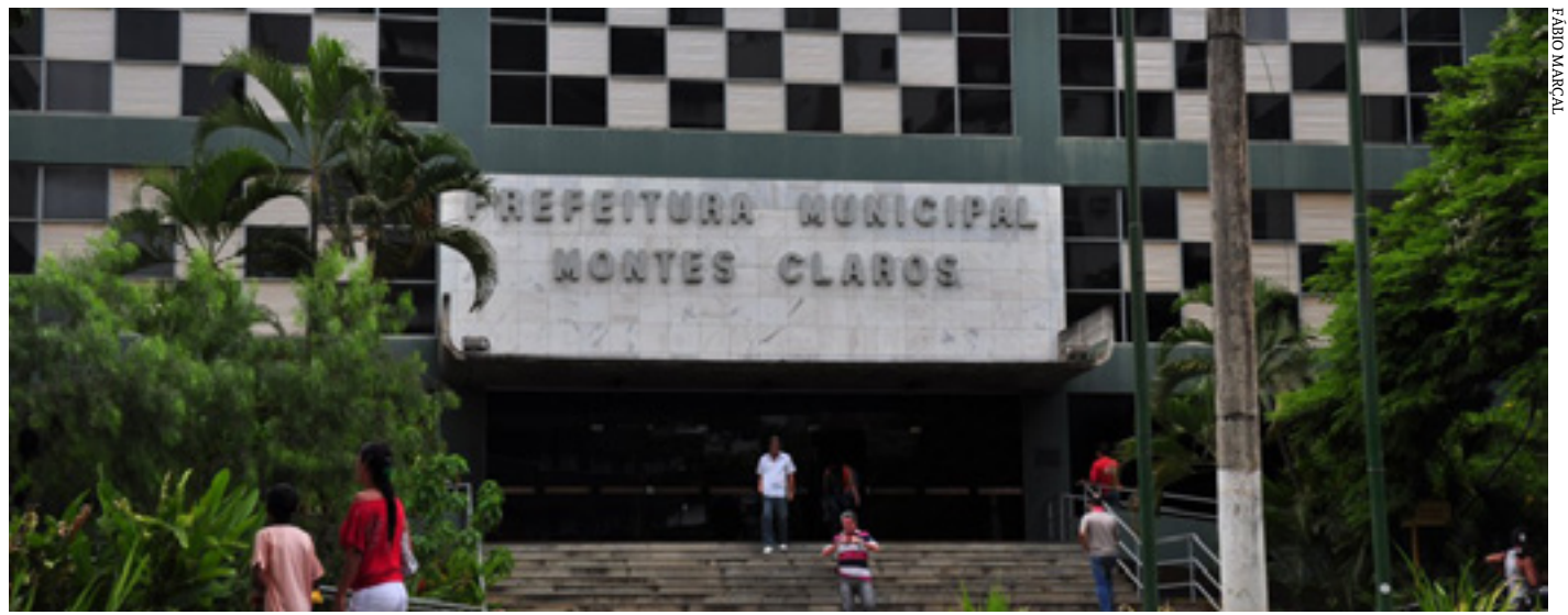
O resultado das eleições deste ano podem apontar futuro postulante ao cargo de chefe do Executivo de Montes Claros