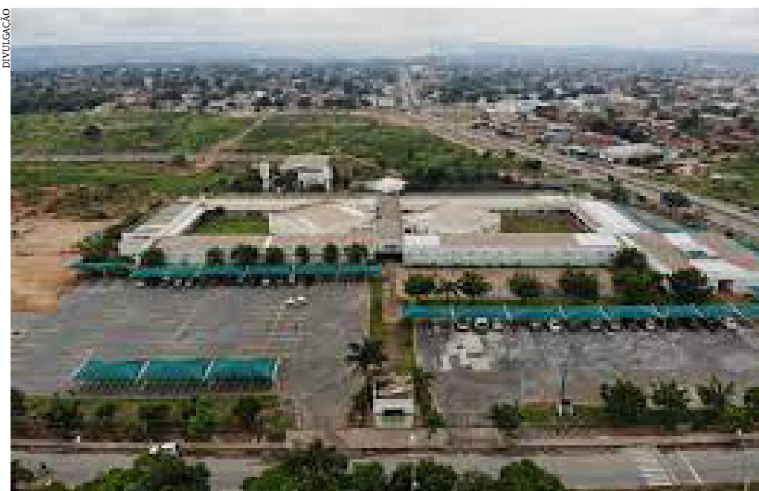
O prédio do Instituto Federal do Norte de Minas, no município

Com mais de 41 mil eleitores aptos, Pirapora se prepara para mais um movimentado domingo de eleições. Diferentemente das Eleições de 2020, quando os eleitores escolheram os vereadores e o prefeito, desta vez, o tempo médio, de votação deverá ser maior, já que serão escolhidos os candidatos a deputado federal, a deputado estadual, senador, governador e presidente.