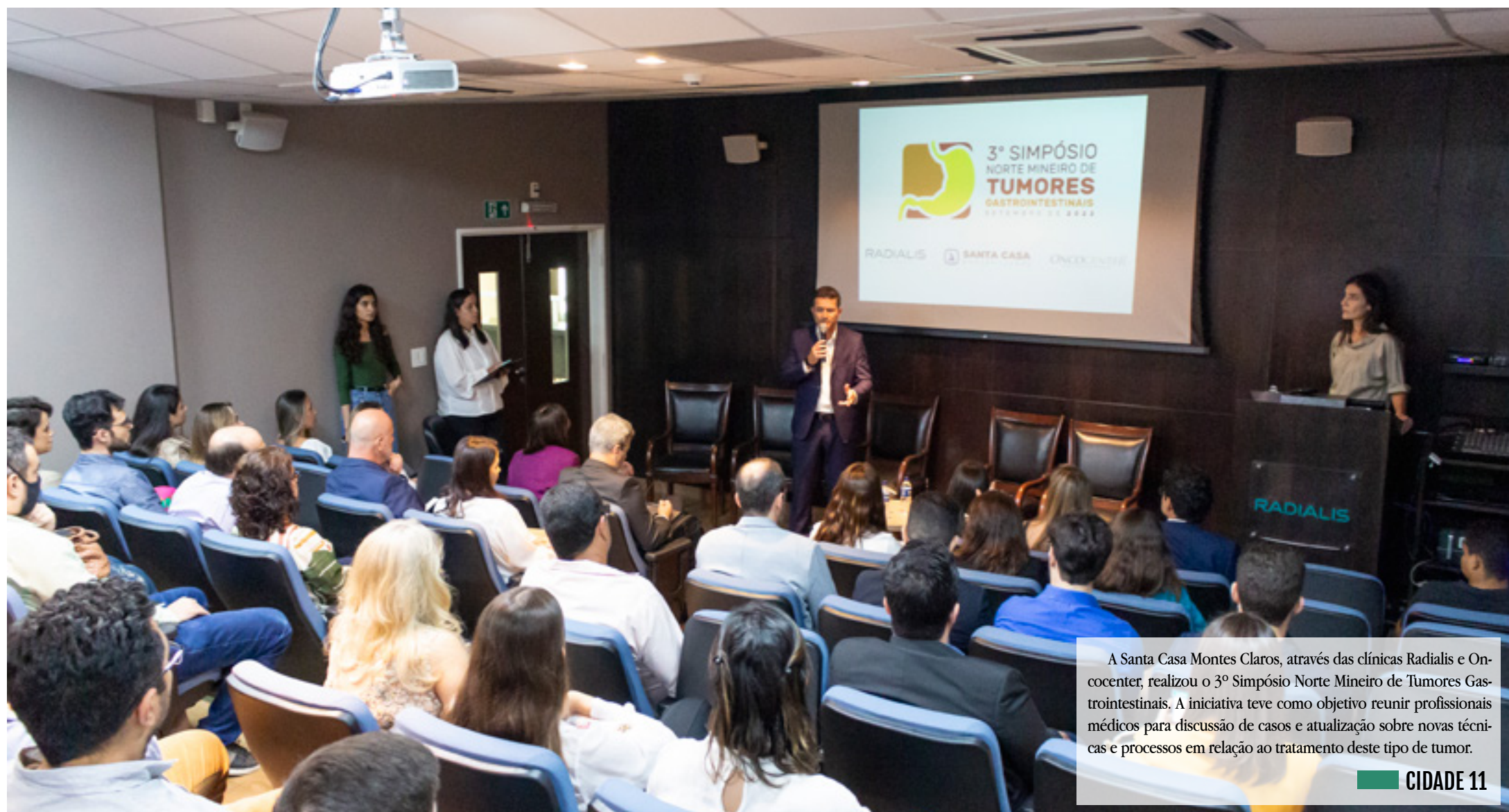
A Santa Casa Montes Claros, através das clínicas Radialis e Oncocenter, realizou o 3º Simpósio Norte Mineiro de Tumores Gastrointestinais. A iniciativa teve como objetivo reunir profissionais médicos para discussão de casos e atualização sobre novas técnicas e processos em relação ao tratamento deste tipo de tumor.