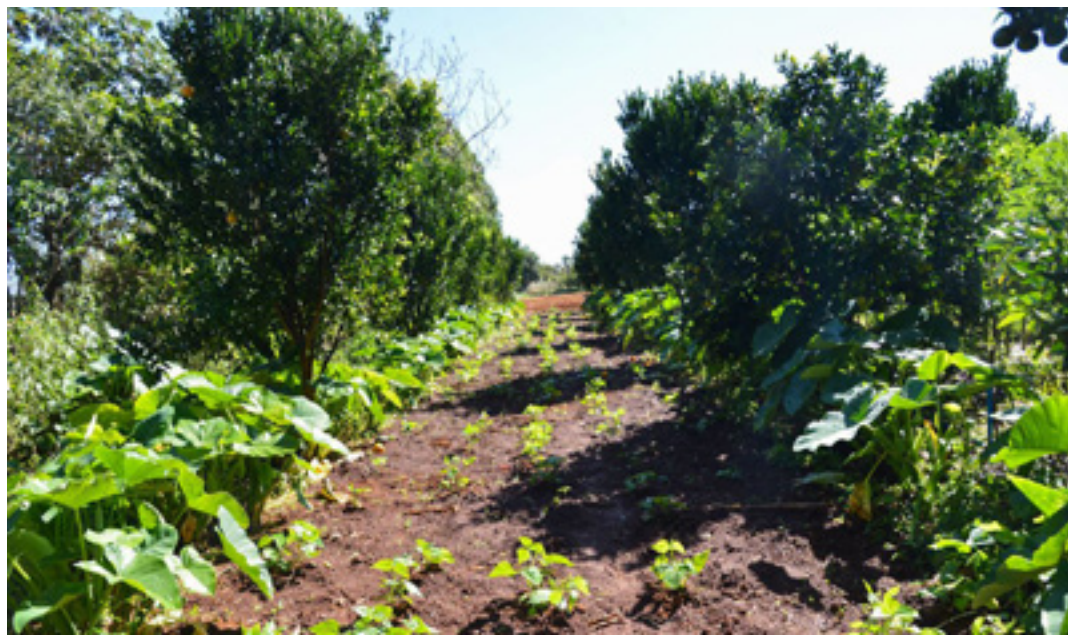
Quase 5 milhões de documentos foram enviados à Receita

Além das orientações, o produtor rural pode obter esclarecimentos sobre o ITR na própria página da Receita Federal, que preparou um questionário com as principais perguntas e respostas sobre o preenchimento e a entrega do documento. (Agência Brasil)