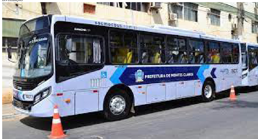
Os veículos do transporte coletivo de Montes Claros