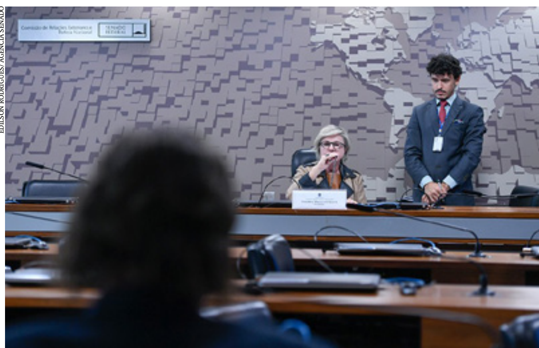
CRE vota amanhã, sete projetos de decretos legislativos.

A Comissão de Relações Exteriores (CRE) agendou reunião semipre-