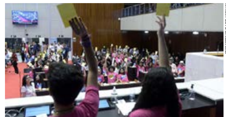
Plenária enfatiza que é preciso gostar de política para mudar a realidade

“Comemoro nesta edição o fato de estarmos aqui após o isolamento decorrente da pandemia, os 30 anos de educação legislativa no Brasil, na qual o PJ Minas se insere, e a ampliação de 120 para 150 alunos presentes nesta etapa final”, disse. (Portal ALMG)