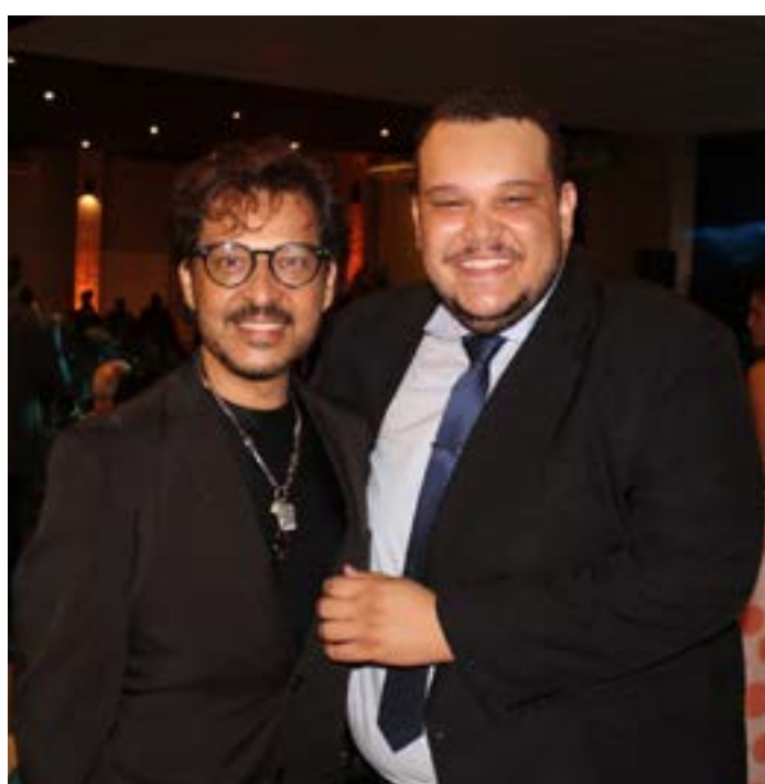
O quadro doado pelo artista plástico e produtor de beleza Walles Mota foi um dos mais disputados da noite