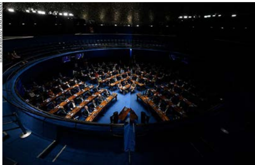
Suspensão de utilização de crédito tributário sobre combustíveis com alíquota zero e ampliação de prazo de migração de servidores públicos para regime de previdência complementar estão na pauta

A Funpresp foi criada para complementar a aposentadoria dos servidores que entraram na administração pública após 2013 e que perderam o direito à integralidade e à paridade dos proventos. Cada Poder tem seu próprio fundo. (Agência Senado)