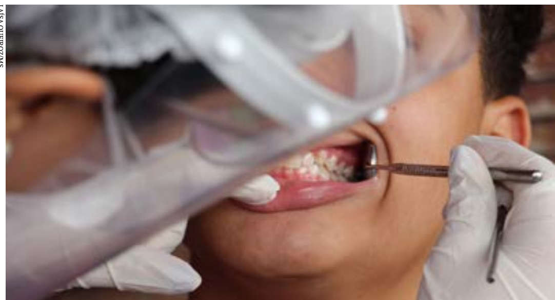
Medida é adotada para atingir a meta de 50 mil participantes

A fase de coleta de dados para a SB Brasil, pesquisa nacional de saúde bucal, foi prorrogada até 30 de setembro. A previsão inicial era de que o prazo fosse encerrado em agosto. De acordo com o Ministério da Saúde, a etapa foi prorrogada para que se consiga atingir a meta de 50 mil participantes.