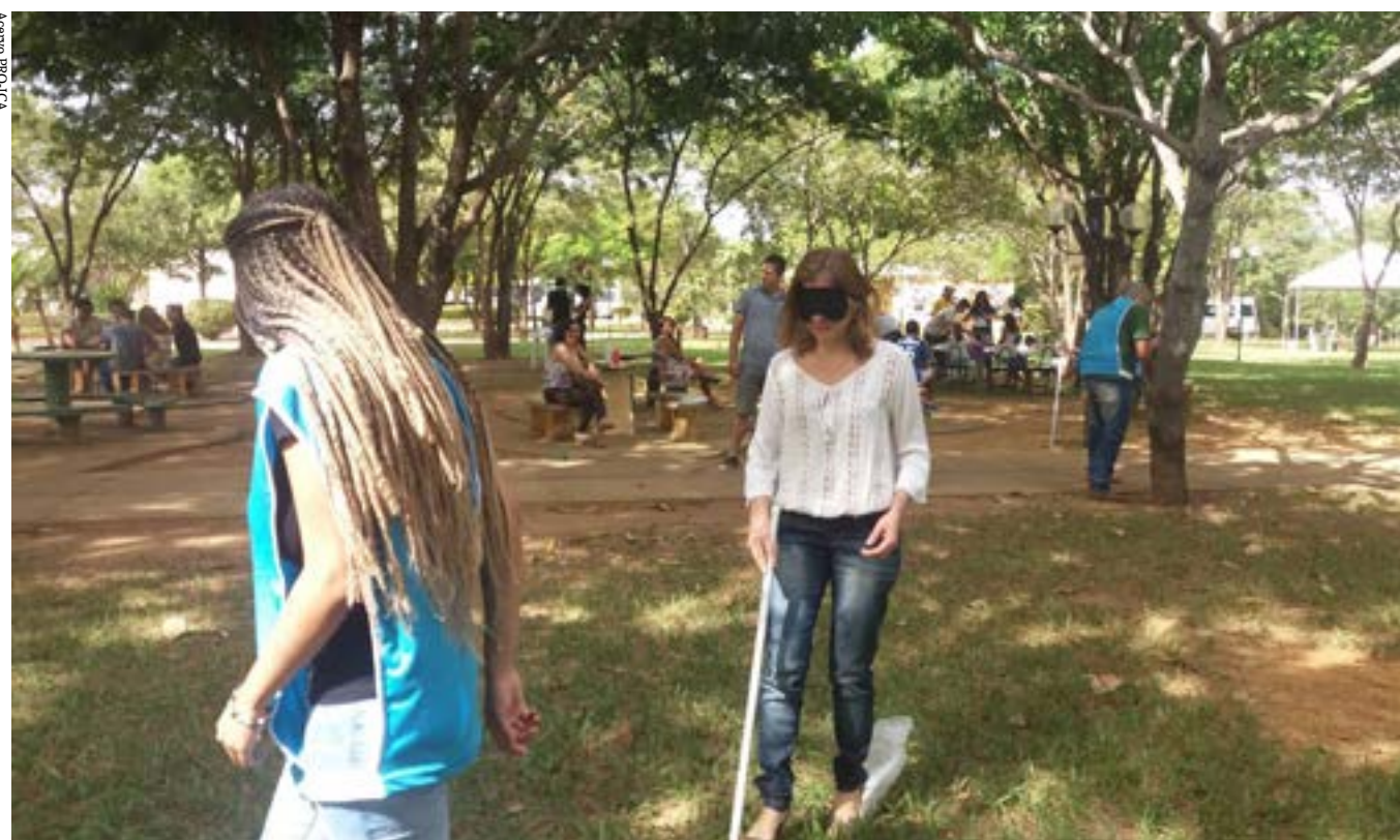
“O que os olhos não veem, o coração sente!”. A atividade tem objetivo de levar à reflexão sobre realidade de pessoas com deficiência visual

Uma manhã de lazer, arte e cultura no Instituto de Ciências Agrárias (ICA) da UFMG. Depois de dois anos de pausa devido à pandemia da Covid-19, o Domingo no Campus está de volta. A terceira edição do evento foi realizada ontem (25), entre 9h às 13h, na Unidade Acadêmica. A programação gratuita teve atividades para todas as idades.