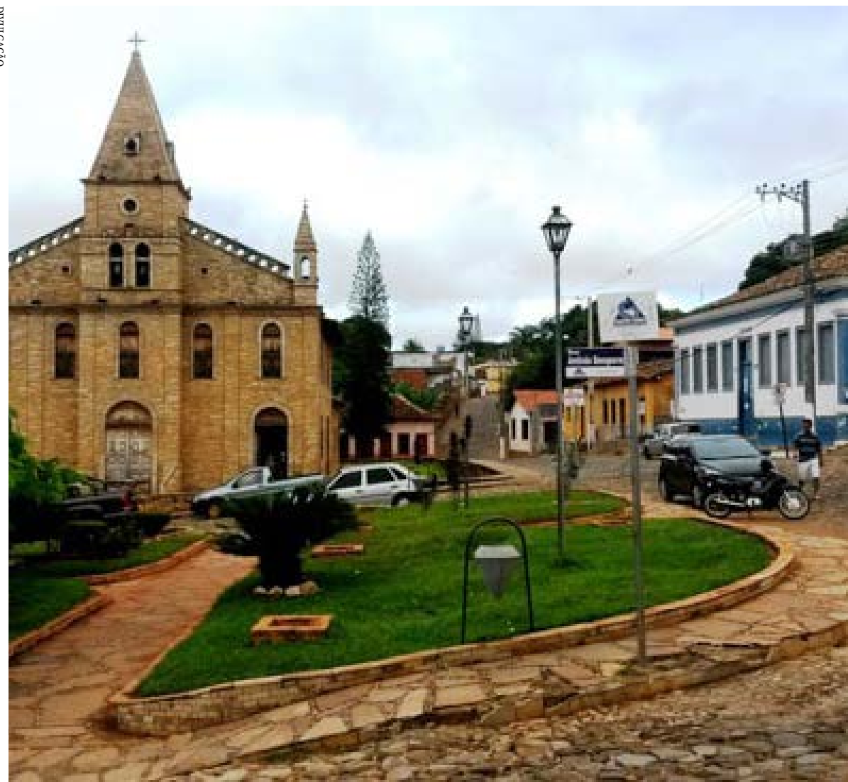
Fruto de parceria entre o Sebrae Minas e a prefeitura local, evento gratuito abordará diretrizes para desenvolver a atividade turística na região

Para marcar a passagem do Dia Mundial do Turismo, comemorado nesta terça-feira (27), Grão Mogol, no Norte de Minas, sediará o seminário "Repensando o Turismo". Gratuito, o evento é fruto de uma parceria entre o Sebrae Minas, prefeitura local e entidades de apoio ao turismo, e tem o objetivo de reunir e conscientizar empresários e representantes do setor para a utilização de estratégias capazes de alavancar a atividade na região, de forma sustentável e segura. O seminário será realizado na Casa de Cultura, de 10h às 16h, com a participação de especialistas do setor. As inscrições devem ser feitas pelo site Sympla. As vagas são limitadas.