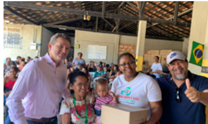
A doação das cestas básicas