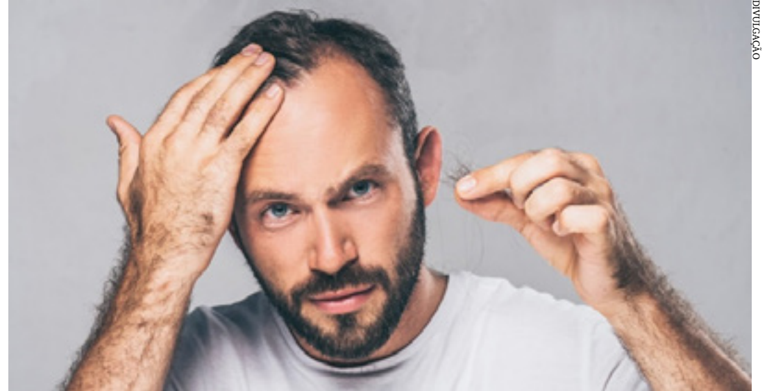
A quantidade de testosterona ou DHT não define as causas da calvície

O tratamento para esse problema, não se associa necessariamente apenas visando o controle dos hormônios da testosterona. Uma das maneiras que se mostram mais eficazes é o tratamento de transplante de folículo capilar.