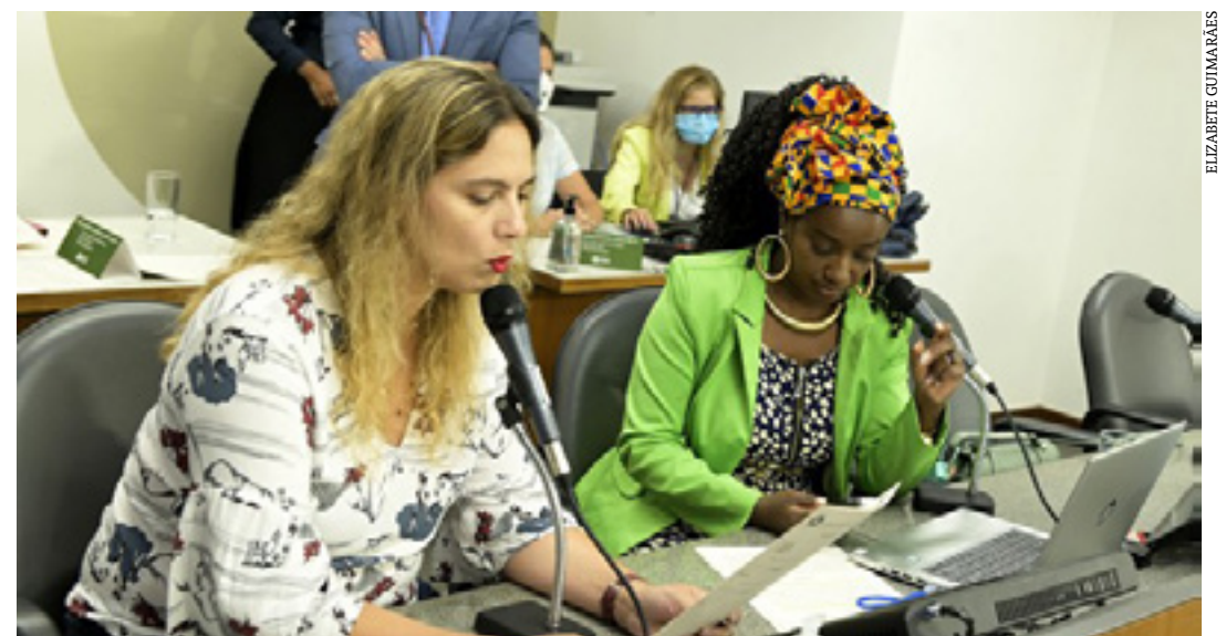
A Comissão de Direitos Humanos analisou a proibição da chamada arquitetura hostil, que prejudica a população em situação de rua

O PL 94/19 já pode seguir para discussão e votação em 1º turno no Plenário. (Portal ALMG)