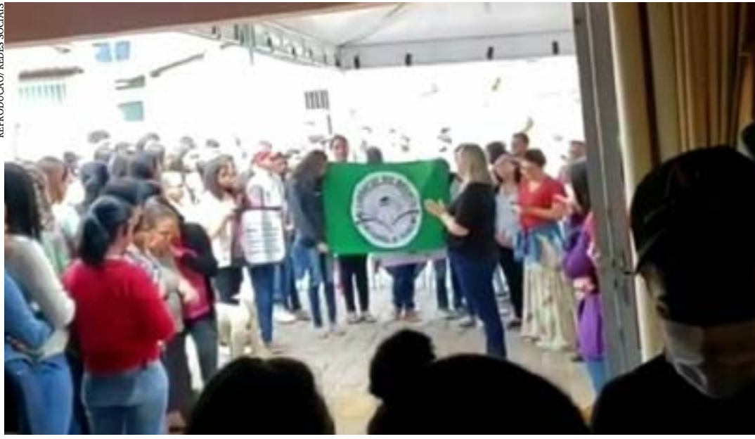
A menina foi enterrada na manhã de ontem (19), em Cachoeira do Pajeú

A Polícia Civil em Pedra Azul investiga as causas que levaram um adolescente de 16 anos ter estuprado e matado uma menina de