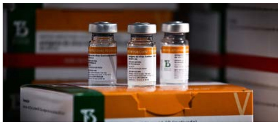
Anvisa aprovou em junho uso do imunizante na faixa de 3 a 5 anos

Segundo o instituto, ainda em setembro, mais 2,5 milhões de doses do imunizante estarão disponíveis para aplicação. (Agência Brasil)