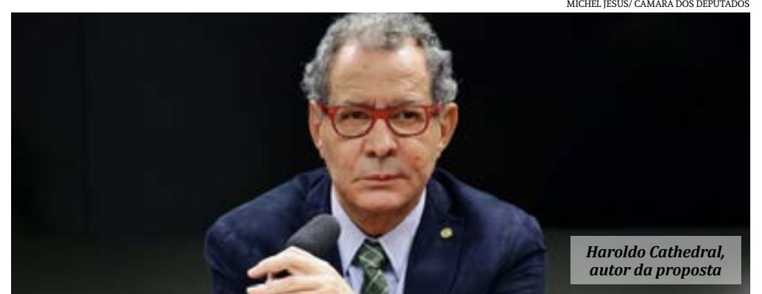
Haroldo Cathedral, autor da proposta

A proposta que tramita em caráter conclusivo será analisada pelas comissões de Viação e Transportes; e de Constituição e Justiça e de Cidadania. (Agência Câmara)