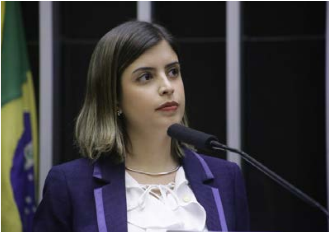
A autora da proposta, deputada Tabata Amaral

O Projeto de Lei 1410/22 cria o Seguro Obrigatório de Danos Pessoais e Materiais, para indenização de prejuízo causado por desastre natural relacionado a chuvas. O texto em análise na Câmara dos Deputados prevê que a cobrança do seguro se aplicará a todo imóvel residencial localizado em área urbana ou rural.