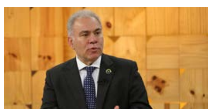
Imunizante nacional está previsto para o segundo semestre de 2023

A varíola dos macacos tem sinais e sintomas que se caracterizam por lesões e erupções de pele, febre, dores no corpo, dor de cabeça, calafrio e fraqueza. (Agência Brasil)