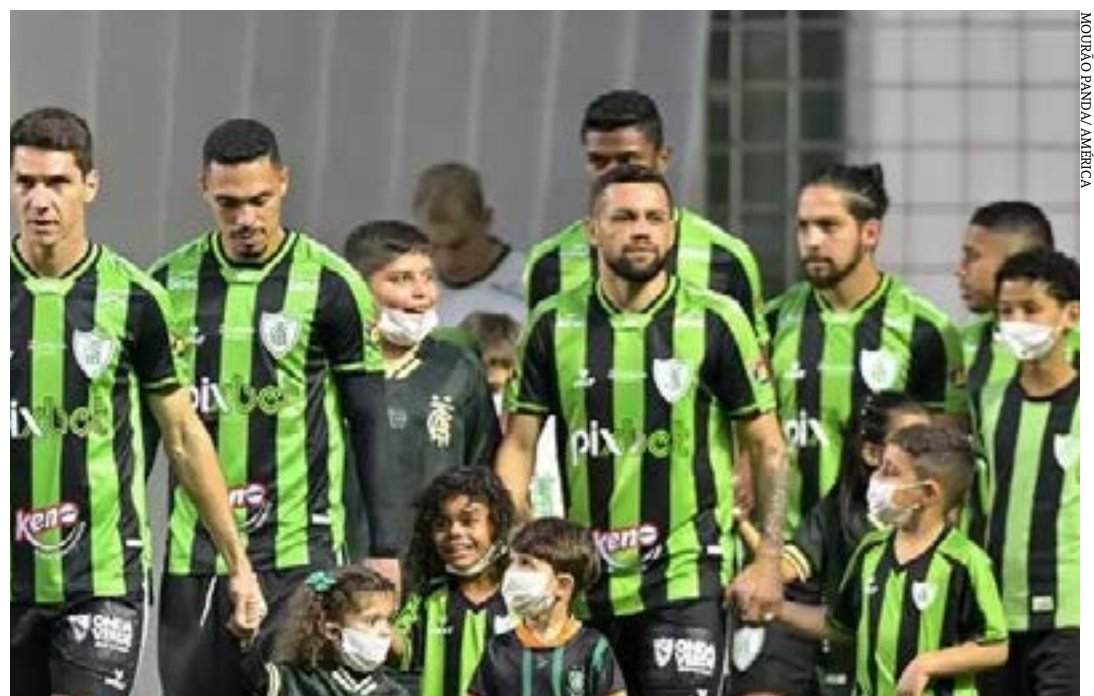
Jogadores do América antes de partida contra o Corinthians, pelo Campeonato Brasileiro, no Independência

No ano passado, a equipe alviverde terminou a Série A na oitava colocação e se classificou para a segunda fase da Libertadores de 2022. Após passar por Guarani, do Paraguai, e Barcelona de Guayaquil, o América avançou à fase de grupos, onde acabou sendo eliminado na quarta posição. (Superesportes)