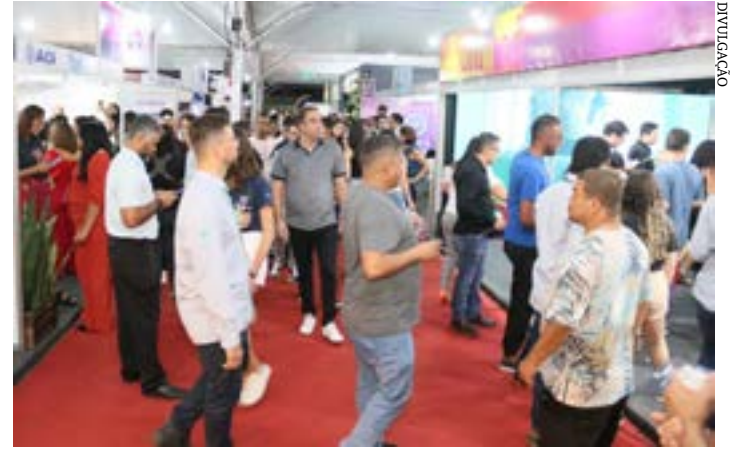
ACI comemora os resultados positivos da maior feira multissetorial no Norte de Minas

A Associação Comercial, Industrial e de Serviços de Montes Claros, com a correalização da Fiemg Regional Norte, encerrou a 27ª edição da Feira Nacional da Indústria, Comércio e Serviços, nesse domingo. A feira se consolida mais uma vez como o maior evento de prospecção de negócios multissetorial do interior de Minas. Centenas de expositores mostraram seus produtos em 100 mil metros quadrados de área coberta, em quatro dias de muitos negócios e network, com a