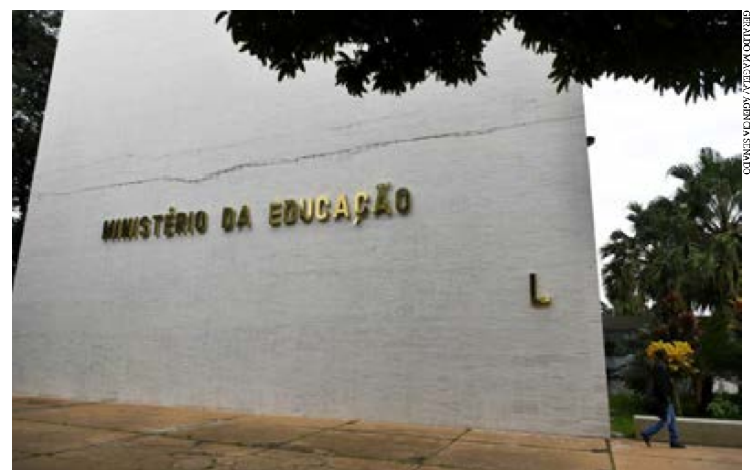
Uma emenda constitucional aumentou de 10% para 23% a participação da União no Fundeb

Os consultores ainda destacam que o aumento de arrecadação da contribuição social do salário-educação não foi alocado para a educação básica; mas para uma reserva