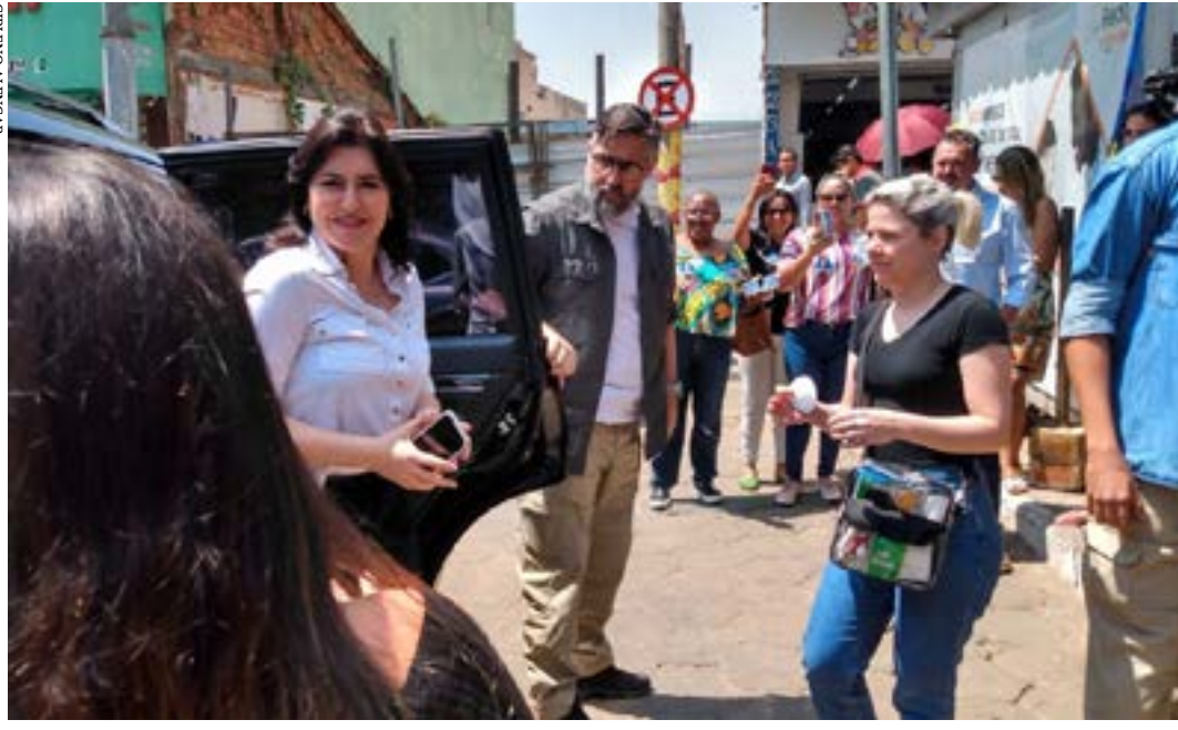
A candidata do MDB, Simone Tebet cumpriu agente nessa segunda-feira, em Montes Claros

A cidade de Montes Claros virou palco esta semana dos candidatos à Presidência da República, depois de passar despercebida em 2018, quando nenhum candidato a visitou, apesar de reunir 1,5 milhão de votos no Norte de Minas. Na manhã de ontem (12), a senadora e candidata do MDB, Simone Tebet, chegou de surpresa a cidade, acompanhada do