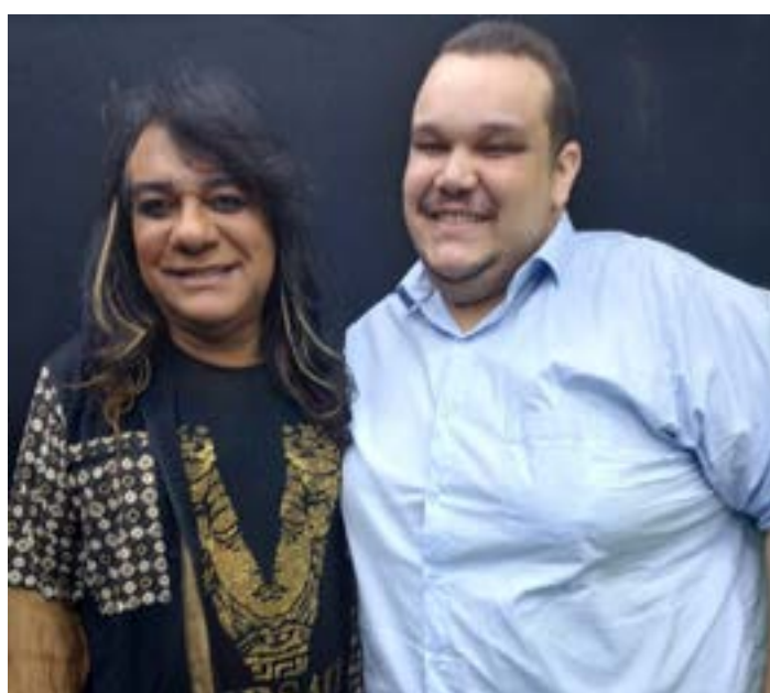
Na última semana recebemos o grande jornalista João Jorge no programa Tudo Vip para um inteligente bate-papo sobre conjuntura política. JJ deu uma verdadeira aula durante suas sábias análises nacional, estadual e regional. Confira em nosso canal do YouTube