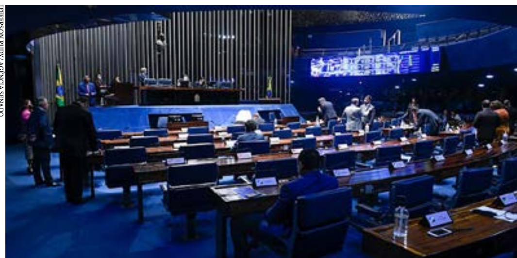
As medidas provisórias 1.118 e 1.119 perderão a validade em 27 de setembro e 5 de outubro

Além disso, foi aprovado um artigo determinando que a aplicação do sinal locacional nas tarifas de energia elétrica, pela Aneel, deverá considerar diretrizes do Conselho Nacional de Política Energética (CNPE). O sinal locacional é um modelo tarifário que permite cobrar a mais dos consumidores que mais exigem dos sistemas de transmissão ou distribuição, como os que residem distantes das subestações. (Agência Senado)