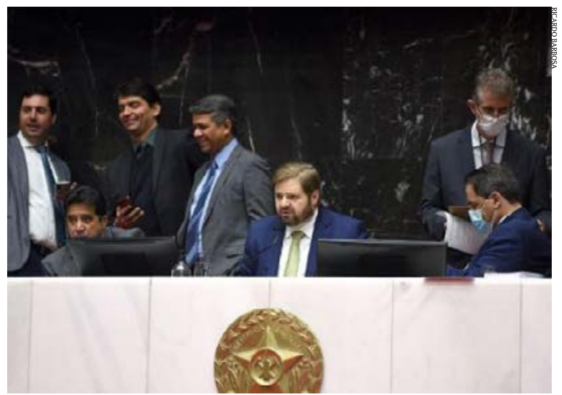
Após a sabatina, o nome do deputado Agostinho Patrus será submetido à aprovação do Plenário

Na legislatura anterior (2015-2019), Agostinho Patrus liderou o Bloco Compromisso com Minas Gerais. Também foi presidente da Comissão Extraordinária das Barragens e vice-presidente da Comissão de Administração Pública. Foi ainda secretário de Estado de Turismo