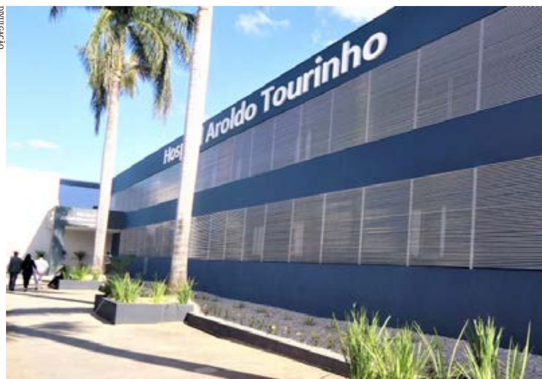
O Hospital Aroldo Tourinho receberá R$ 74 mil destinados às cirurgias