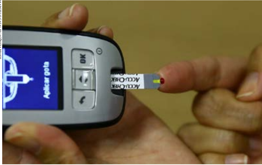
Pessoas com diabetes são mais suscetíveis a infecções

A Comissão de Defesa dos Direitos da Pessoa Idosa e a Comissão de Seguridade Social e Família da Câmara dos Deputados promovem debate na quarta-feira (14) sobre a vacinação das pessoas com diabetes e com obesidade. A audiência pública foi solicitada pelo deputado Zacharias Calil (União-Go).