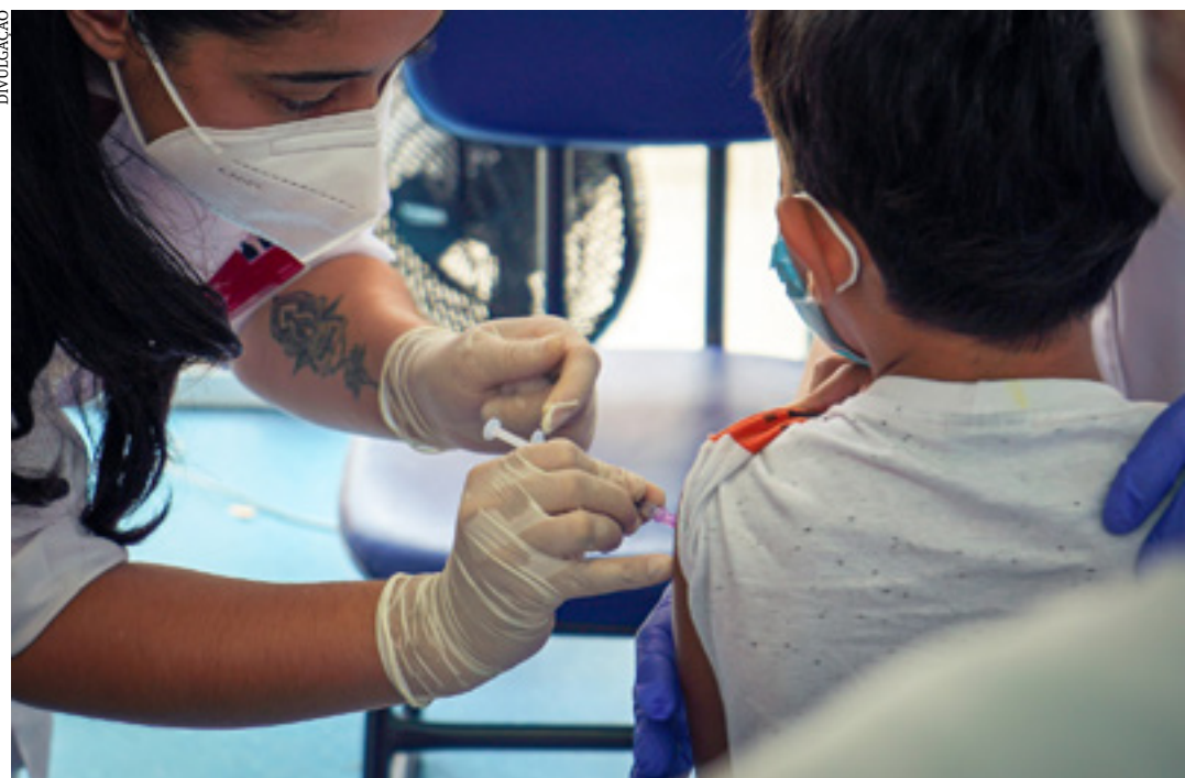
A vacinação visa atingir meta de imunização na região

Para a realização das campanhas de multivacinação e contra a poliomielite a Superintendência Regional de Saúde repassou aos 54 municípios que integram a sua área de atuação imunizantes Pentavalente contra difteria, tétano, coqueluche; Hepatite B e bactéria haemophilus, responsável por infecções no nariz, meninge e na garganta; Pneumo 10; Rotavírus; Meningocócica C; Febre Amarela; Tríplice Viral contra o sarampo, caxumba e rubéola; Hepatite A; Varicela; Meningocócica ACWY Conjugada e HPV contra o Papilomavírus Humano, doença sexualmente transmissível.