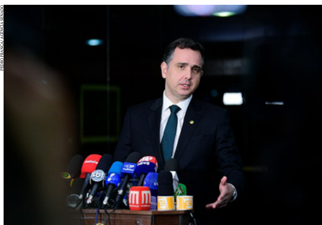
Rodrigo Pacheco lamentou a ausência do presidente Jair Bolsonaro na sessão solene do Congresso Nacional

"Votamos a lei e queremos que seja aplicada. Agora temos que dar alternativa e vou me desdobrar nesse trabalho. Queremos resolver o mais rápido possível, até porque é obrigação nossa, do Congresso, dar uma solução a isso", destacou. (Agência Senado)