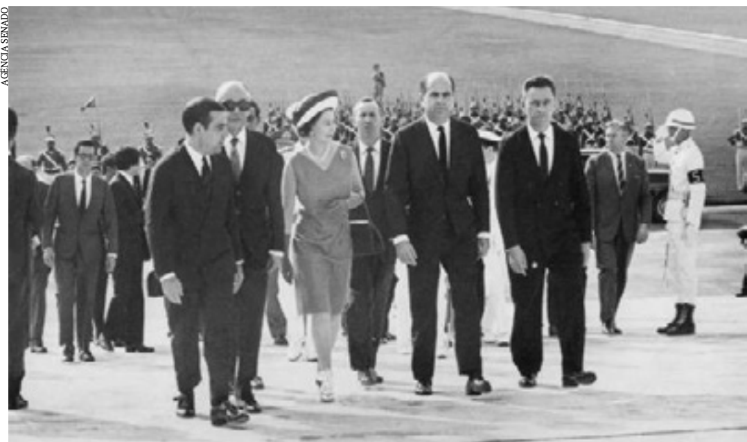
No dia 5 de novembro de 1968, a rainha e seu marido, o príncipe Philip, foram recepcionados por deputados e senadores.

A recepção à rainha acabou sendo um dos últimos atos realizados pelo parlamento brasileiro em muito tempo. No dia 13 de dezembro, pouco mais de um mês depois de seu trabalho ser exaltado pela monarca britânica, o Congresso Nacional foi fechado pelo Ato Institucional nº 5 (AI-5). Ele só seria plenamente reaberto mais de um ano depois. (Agência Senado)