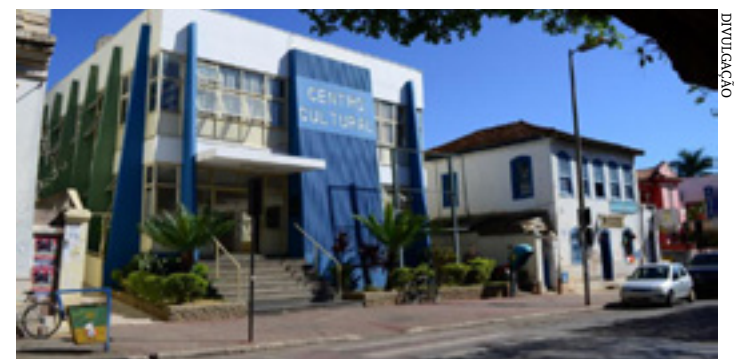
A reunião com os participantes acontece no Centro Cultural Hermes de Paula

Outras informações sobre o festival podem ser obtidas pelos e-mails psiu35anos@gmail.com e aroldopereirapoeta@yahoo.com.br ; pelos telefones (38) 9 8412-4749, 2211-3380 e 2211-3374; ou ainda pelo whatsapp (38) 9 9112-7011.