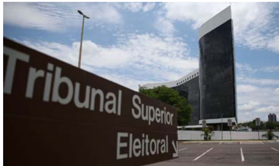
Descumprimento da resolução pode caracterizar crime eleitoral

O voto foi acompanhado pelos ministros Mauro Campbell Marques, Benedito Gonçalves, Cármen Lúcia, Carlos Horbach e o presidente, Alexandre de Moraes.