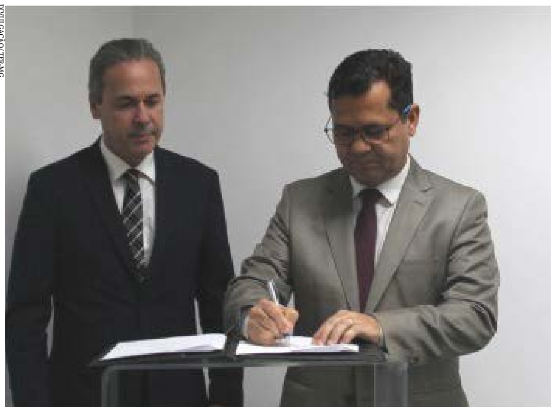
TJMG vai auxiliar em ações de enfrentamento à desinformação e ceder servidores para atuarem no teste de integridade das urnas