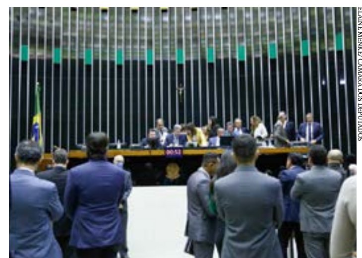
Uma das loterias, de acordo com a PL, tem como propósito financiar o Sistema Único de Saúde (SUS)