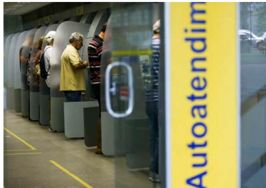
MP em vigor desde abril aumenta em 1 ponto percentual a CSLL paga por bancos e outras instituições financeiras

A MSF 52/2022, por exemplo, pede contratação de operação de crédito entre o governo do Amazonas e o Banco Interamericano de Desenvolvimento (BID) para financiamento parcial do Programa Social e Ambiental de Manaus e Interior. Já a MSF 50/2022 refere-se a negociações entre o município de São Caetano do Sul (SP) e a Corporação Andina de Fomento (CAF), para financiamento parcial do Programa de Desenvolvimento e Saneamento Ambiental da cidade do ABC paulista. (Agência Senado)