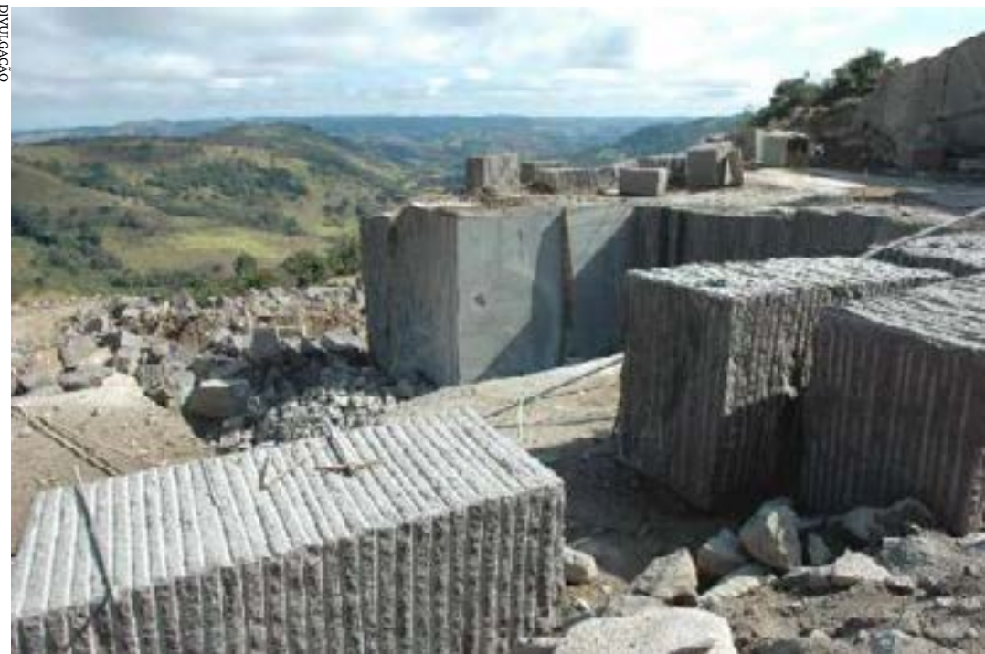
Segundo o gabinete, órgãos consultivos tem atuado em favor dos empreendimentos minerários

Para a audiência pública desta terça (30), foram convidados, entre outros, o titular da CGE, o controlador-geral do Estado, além de representantes do Ministério Público, das entidades com atuação nas áreas social e ambiental. (Portal ALMG)