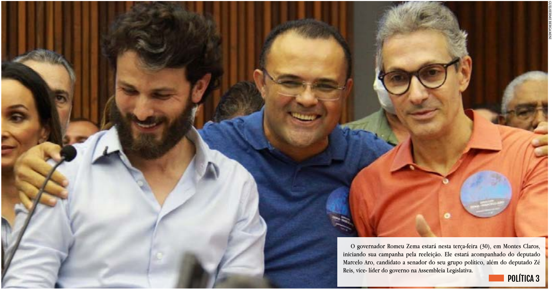
O governador Romeu Zema estará nesta terça-feira (30), em Montes Claros, iniciando sua campanha pela reeleição. Ele estará acompanhado do deputado Marcelo Aro, candidato a senador do seu grupo político, além do deputado Zé Reis, vice-líder do governo na Assembleia Legislativa.