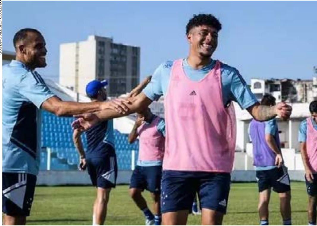
Cruzeiro encerrou, nesta segunda-feira, em São Luís, a preparação para jogo com Sampaio Corrêa

O Cruzeiro lidera a Série B do Brasileiro, com 57 pontos - 10 a mais que o Bahia e 19 à frente do Londrina, primeiro time fora do G4. Já o Sampaio Corrêa é o 10º colocado, com 34. ( Superesportes )