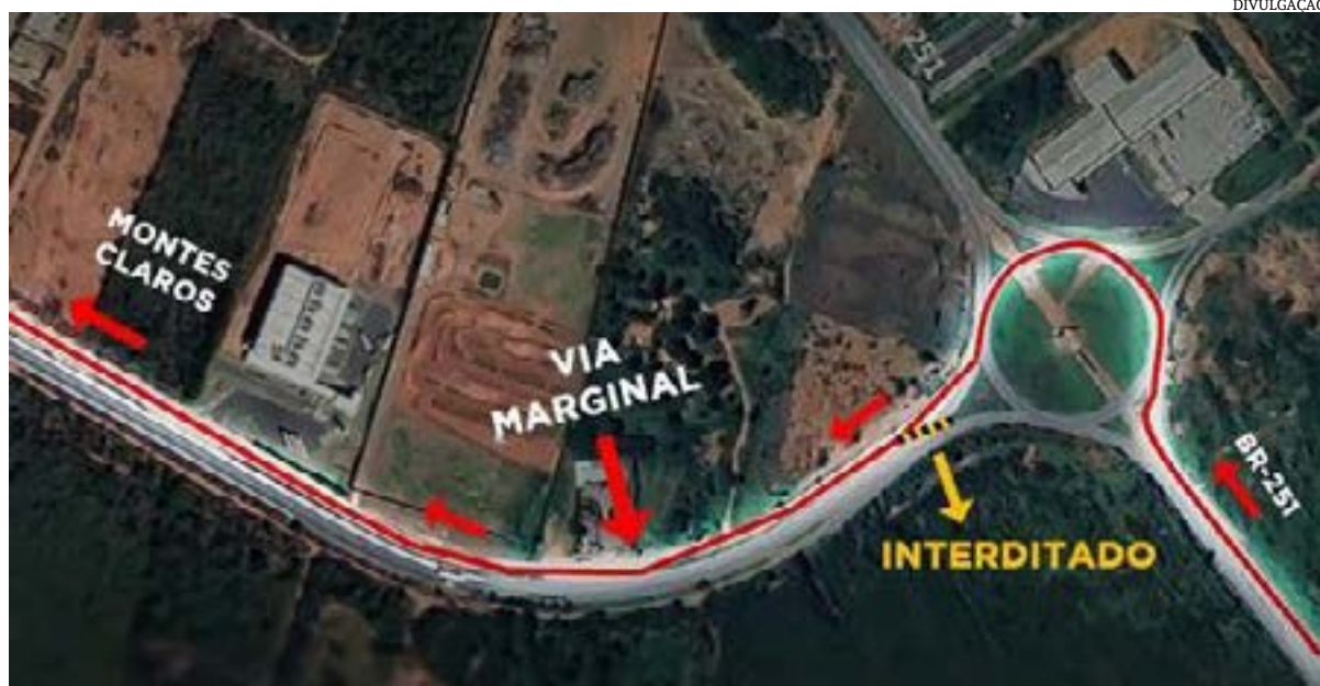
A concessionária que administra a BR-135, inicia hoje (30), a primeira etapa de recapeamento do trecho leste do Anel Viário de Montes Claros. A obra de mobilidade urbana iniciará pelo do segmento C, que consiste na restauração e adequação de 9,64 quilômetros de trecho já existente da interligação entre a BR-251 ao Batalhão do Exército.