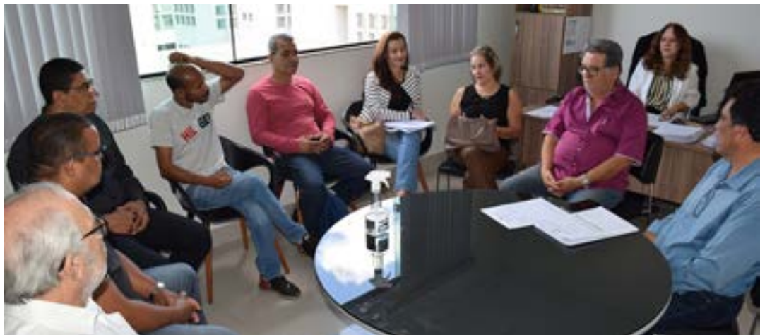
Os projetos estão na Ordem do Dia da próxima sessão ordinária

A concessão de Utilidade Pública possibilita à entidade firmar convênios com o Poder Público e reivindicar, nos órgãos competentes, isenção de contribuições destinadas à seguridade social e pagamento de taxas cobradas por cartórios. Após o parecer positivo da Comissão, as propostas foram colocadas na Ordem do Dia da sessão ordinária desta terça-feira (30/8). (Portal CMMC)