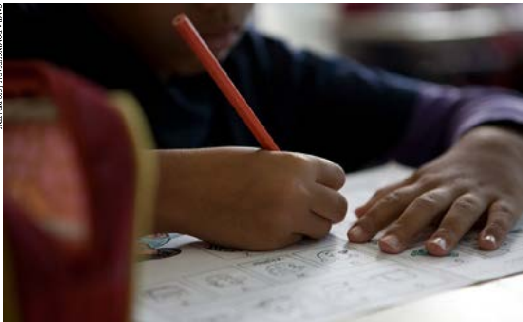
Universalização da educação básica é objetivo do PL 713/2021, que prevê punição a gestores negligentes

Também na pauta o (PL) 570/2020, da senadora Mara Gabrielli (PSDB-SP), que inclui as modalidades esportivas para surdos no programa Bolsa Atleta. Atualmente, atletas surdos não participam das Paralimpíadas, disputando uma competição separada, as Surdolimpíadas. De acordo com a Confederação Brasileira de Desportos de Surdos (CBDS), os surdos não se consideram pessoas com deficiência e sim uma minoria linguística e cultural. O relator, senador Randolfe Rodrigues (Rede-AP), é favorável à aprovação do texto.