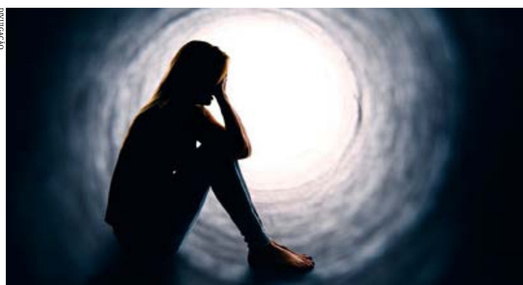
Projeto obriga plataformas de internet a retirar postagens que induzam usuários, especialmente crianças e jovens, a lesionarem a si próprios ou a outros

O senador Telmário Mota (Pro-RR) apresentou um projeto de lei para determinar às plataformas de internet a retirada de circulação de conteúdos que possam instigar a atentar contra a própria vida ou a de outras pessoas (PL 2.184/2022). A proposta altera pontos do Marco Civil da Internet (Lei 12.965, de 2014) para coibir a divulgação, em sites ou redes sociais, de conteúdo que induza, instigue ou constranja alguém a atentar contra sua incolumidade física e psicológica ou de outros.