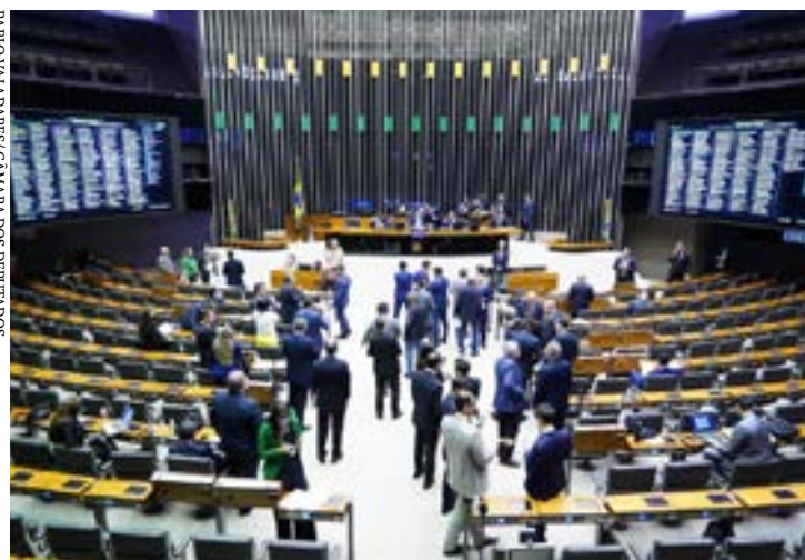
Deputados analisam propostas em sessão do Plenário

A Câmara dos Deputados vai ter semana de esforço concentrado com votações a partir de segunda-feira (29), em sessão virtual marcada para as 17 horas. No total, a pauta do Plenário contém 37 itens, entre projetos de lei, medidas provisórias e requerimentos de urgência.