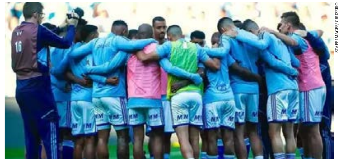
Cruzeiro empatou com Grêmio por 2 a 2 na Arena, pela 25ª rodada da Série B

Técnico: Hélio dos Anjos (Ponte Preta). (Superesportes)