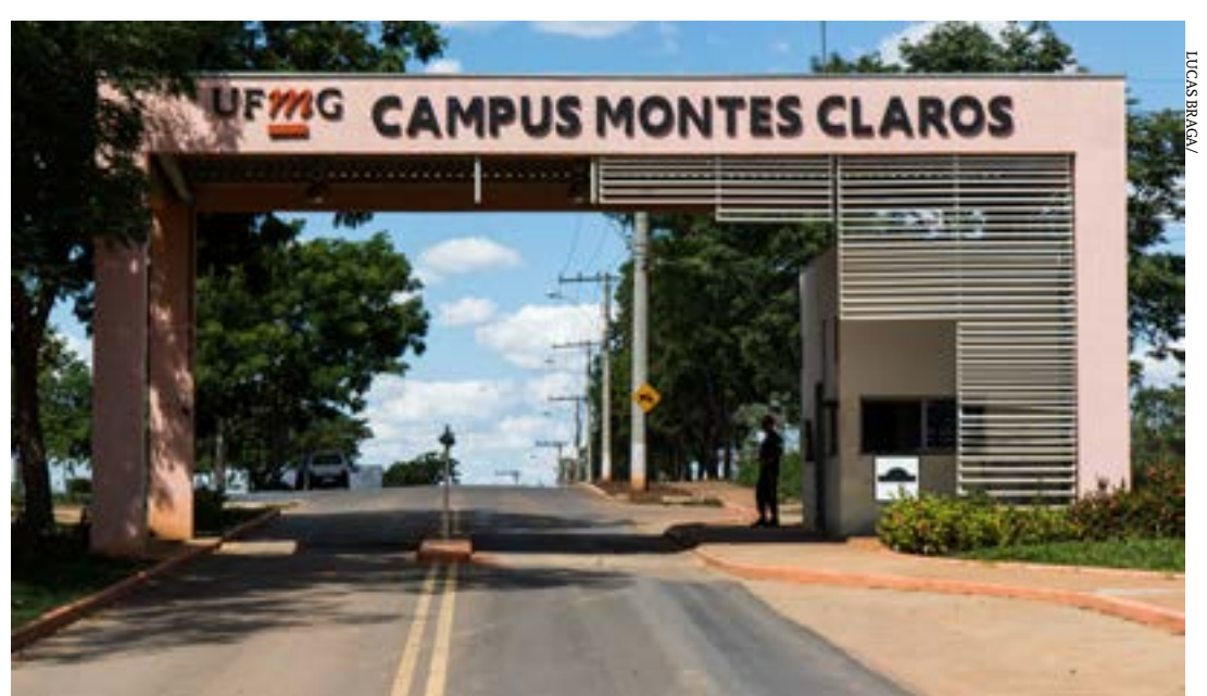
Inscrições em oficinas devem ser realizadas até o dia 24 de agosto

Com carga horária de 15 horas, as atividades não têm relação direta com a grade curricular, mas podem ser aproveitadas como crédito de atividades acadêmico-científico-culturais (AACC), dependendo das normas de cada colegiado. (ANA CLÁUDIA MENDES) Colaboradora