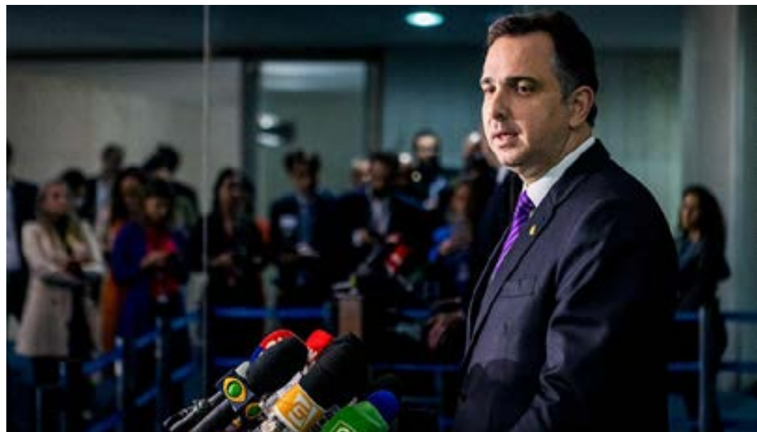
Em entrevista na manhã desta terça, Pacheco falou sobre segurança do pleito e sobre a pauta de votações do Senado

definição de pauta. É provável que ele não seja pautado no dia 29”, afirmou. (Agência Senado)