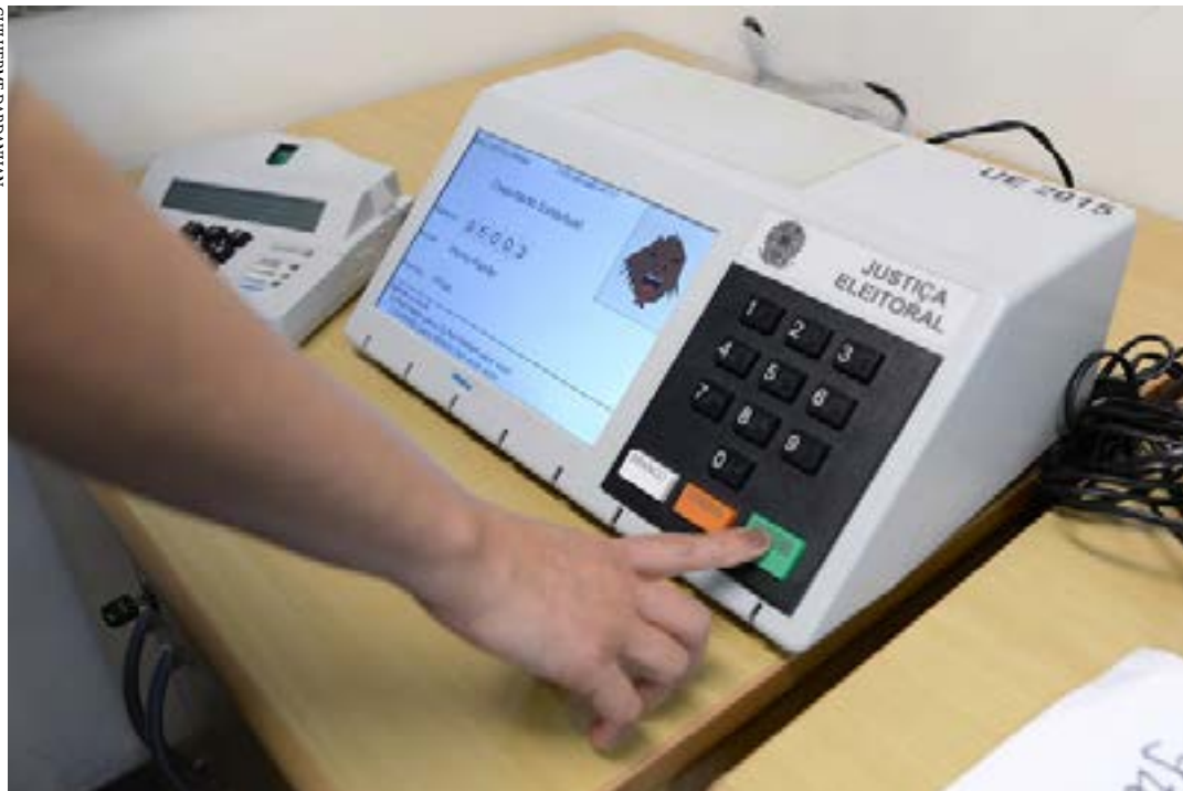
A valorização da democracia e a confiabilidade das urnas eletrônicas serão destacadas na campanha

Por meio do projeto Parceiros da Democracia, o tribunal buscou garantir a realização das eleições com estrutura e segurança sanitária. Também foram parceiros o Governo de Minas, o TJMG e Tribunais Regionais Federais. (Portal ALMG)