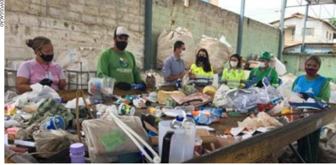
O projeto EcoGalpão, com atividade no bairro Santos Reis, em Montes Claros é um dos contemplados

Este ano, a instituição vai investir R$ 200 mil em cinco iniciativas nos municípios de Barroso, Montes Claros e Pedro Leopoldo