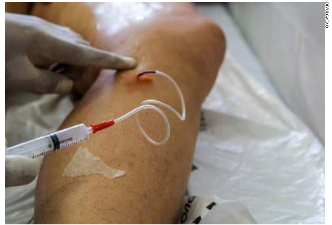
Doença vascular mais prevalente no país são as varizes

DVC tem em comum com a doença arterial. É uma inflamação do corpo que acaba levando a uma possibilidade de ter a trombose arterial, que é o risco de infarto, derrame e tudo o mais".