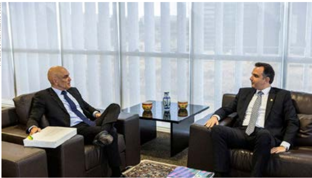
O presidente do Senado, Rodrigo Pacheco (à dir.), encontrou-se com o presidente do TSE, ministro Alexandre de Moraes, nesta segunda-feira

O presidente do Senado, Rodrigo Pacheco, afirmou, na tarde dessa segunda-feira (22), que o Congresso Nacional tem plena confiança na Justiça Eleitoral. A declaração foi feita logo depois da visita de Pacheco ao novo presidente do Tribunal Superior Eleitoral (TSE), ministro Alexandre de Moraes. Segundo Pacheco, a relação entre os poderes deve ser independente, mas com harmonia e cordialidade, dentro de um objetivo comum. Ele ressaltou que é importante manter esse diálogo sadio e produtivo, para o bem da sociedade brasileira.