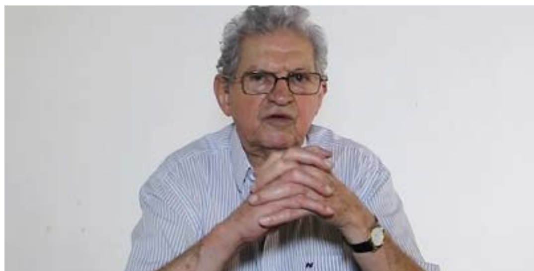
O prefeito fez o anúncio durante, sua participação de forma on line, do lançamento da Base Unificada do Samu e Corpo de Bombeiros

Ainda na solenidade, o prefeito Humberto Souto deu uma notícia até então sigilosa: no mês passado teve de fazer uma cirurgia na próstata em São Paulo, para aperfeiçoar o tratamento realizado anos atrás. O prefeito explicou que isso exigiu ficar de repouso, mas que está se recuperando, devendo voltar em pouco tempo ao atendimento presencial. Desde o dia 7 de março de 2020 que Souto esta despachando em sua casa. O último evento público que ele participou foi dia 8 de março daquele ano, do Encontro do PSL mulher. Depois ficou gripado e com o início da pandemia da Covid-19 se isolou por completo.