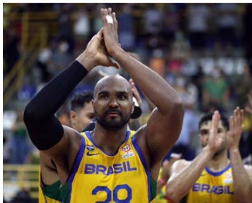
Seleção de basquete enfrenta Porto Rico às 21h da próxima quinta (25)