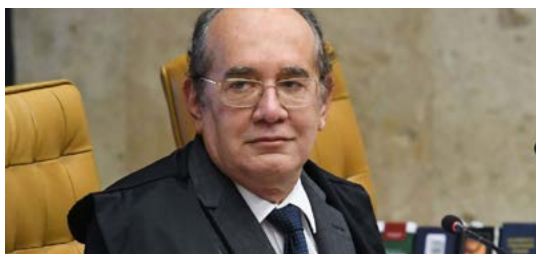
Decisão é do ministro Gilmar Mendes

Pela decisão, o governo federal também não poderá inscrever os estados em cadastro de inadimplência e cobrar encargos moratórios sobre a compensação. (Agência Brasil)