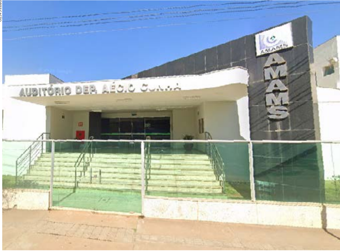
O evento, que acontece no auditório da Amams, irá capacitar equipes de 80 municípios do Norte de Minas

EXCLUSÃO – O Brasil vinha avançando, lentamente, no acesso de crianças e adolescentes à escola nos últimos anos. Mas a pandemia de Covid-19 trouxe uma regressão de duas décadas. Em novembro de 2020, mais de 5 milhões de meninas e meninos não tiveram acesso à educação no Brasil, de acordo com estudos lançados pelo Unicef. A pesquisa indicou que quase 1,5 milhão de estudantes não frequentavam a escola (remota ou presencialmente) e outros 3,7 milhões que estavam matriculados, não tiveram acesso a atividades escolares e não conseguiram se manter aprendendo em casa.