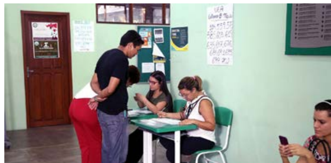
Das eleições passadas para as de 2022, aumento foi de 93%

cracia, os mesários voluntários recebem diversos benefícios, como contagem dos dias trabalhados como horas complementares em cursos universitários, desempate em concursos públicos, além de dois dias de folga no trabalho, se concluir o treinamento. (Agência Brasil)