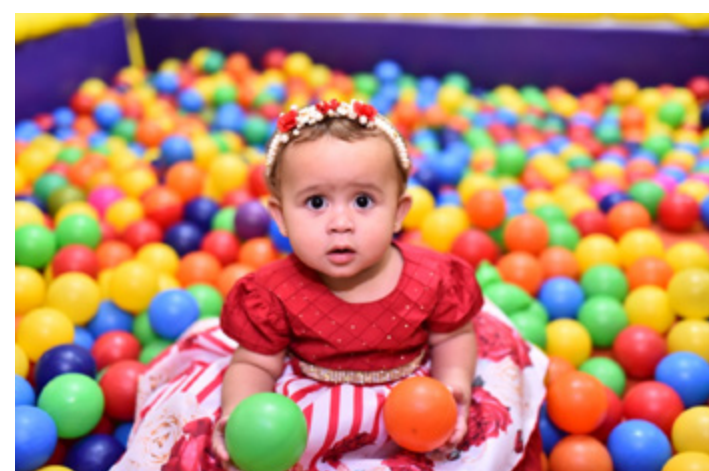
A princesa aproveitou todos os detalhes preparados para celebrar o seu 1º aninho