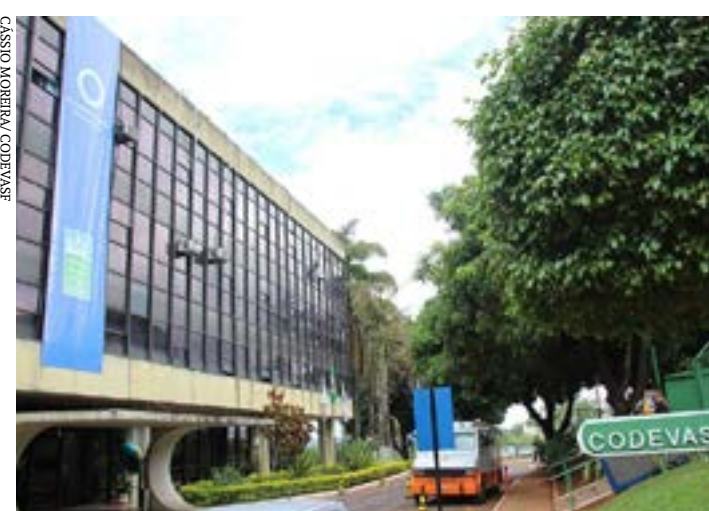
A Codevasf é uma empresa pública vinculada ao Ministério do Desenvolvimento Regional

Senadores e deputados vão analisar um projeto de lei do Congresso que destina R$ 550 mil para reforçar o orçamento deste ano da Companhia de Desenvolvimento dos Vales do São Francisco e do Parnaíba (Codevasf). A tramitação do PLN 25/2022 deve começar pela Comissão Mista de Orçamento (CMO).