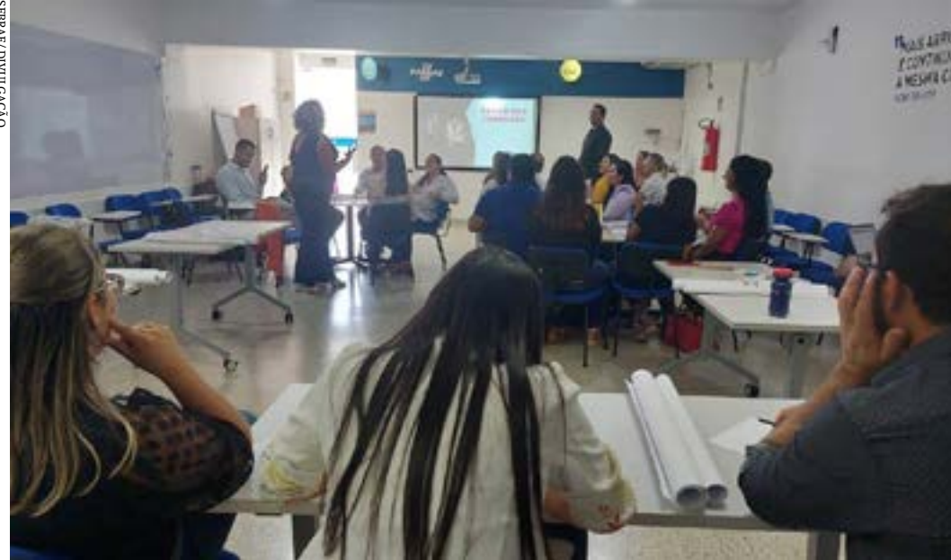
Representantes de oito municípios participaram das oficinas

O Índice Sebrae de Desenvolvimento Econômico Local (ISDEL) é uma medida criada a partir da Abordagem DEL com o intuito de representar de forma quantitativa o estágio de desenvolvimento dos municípios brasileiros. O índice visa contribuir para compreensão dos territórios analisados, colaborando também para o desenho e a avaliação de políticas públicas, ações e esforços para estimular o desenvolvimento econômico local. Ele se baseia em cinco pilares: Capital Empreendedor, Tecido Empresarial, Governança, Organização Produtiva e Inserção Competitiva. (Agência Sebrae)