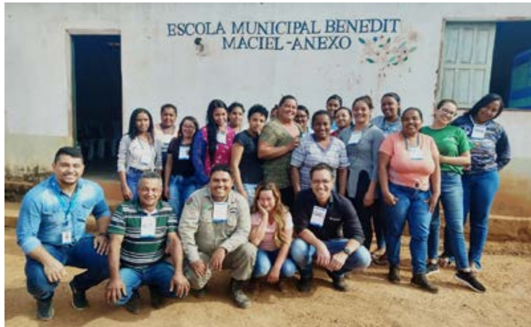
Moradores que participaram das capacitações

SOBRE O PARQUE - O Parque Estadual da Lapa Grande é uma Unidade de Conservação de Proteção Integral, localizado a 12 quilômetros da região Central de Montes Claros. Com 15.360 hectares, é uma das maiores unidades de conservação urbana de proteção integral do Brasil. Criado em janeiro de 2006, recebe grande número de turistas em função da riqueza da fauna e da flora. O local também é muito utilizado para trilhas e roteiros ciclísticos. (Agência Sebrae)