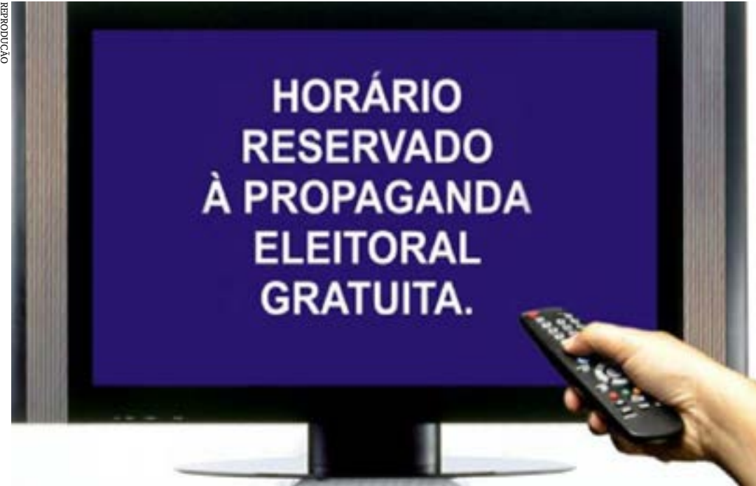
Propaganda no rádio e na TV começa dia 26 e vai até 29 de setembro

Caso haja segundo turno para a disputa presidencial e para governos estaduais, a votação será em 30 de outubro. (Agência Brasil)