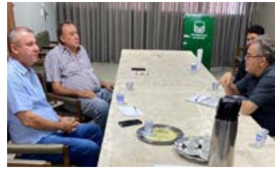
Representantes da empresa se reuniram com o Sindicato Rural local