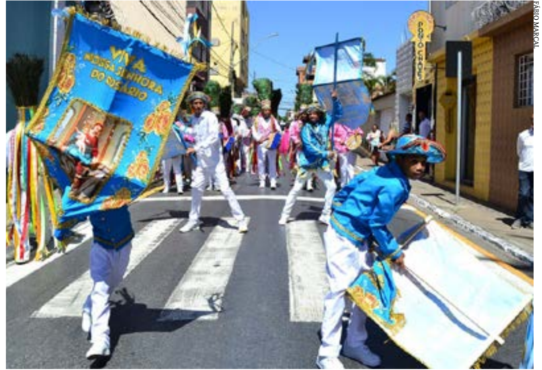
O desfile dos grupos na área central de Montes Claros

Os festejos continuam até amanhã (21), com atrações culturais gratuitas.