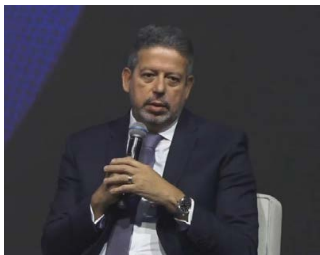
Lira: partido do qual faço parte não achincalha

"A imprensa queria que o conflito fosse acima das intuições. Agora, temos que aprimorar a cada dia nosso sistema eleitoral", afirmou Nogueira. (Agência Câmara)