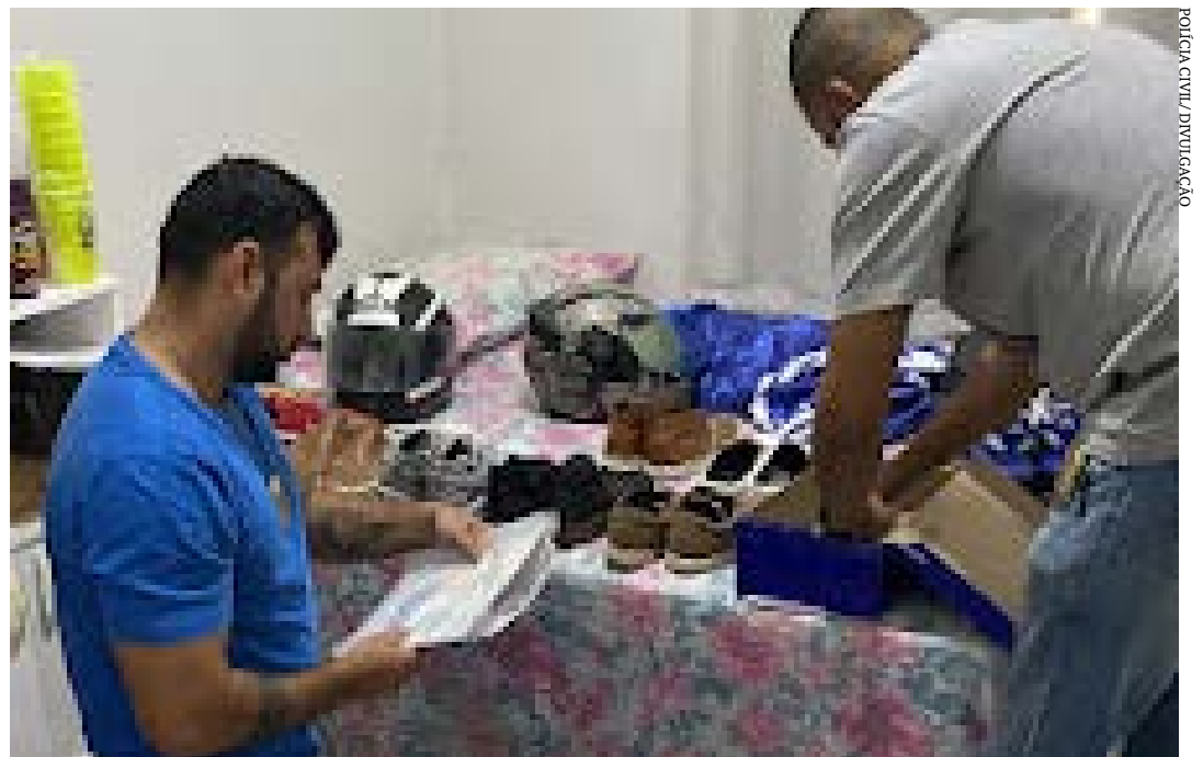
Polícia Civil durante mandado de busca e apreensão na residência de suspeito em aplicar golpes financeiros na região de Porteirinha