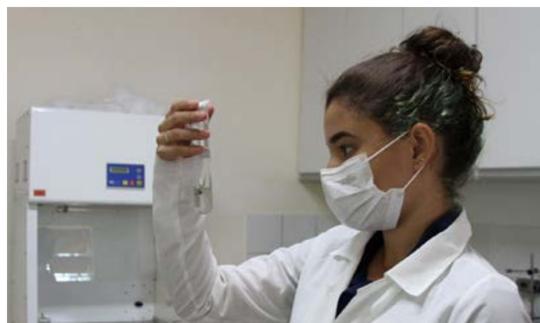
No viveiro, acadêmicos de graduação e pós-graduação desenvolvem pesquisas sobre o processo de produção de mudas.

O viveiro de mudas do Instituto de Ciências Agrárias funciona de segunda a sexta-feira, das 8h às 12h e das 13h às 17h. Interessados em adquirir mudas podem entrar em contato pelo whatsapp: (38) 99102 3263.