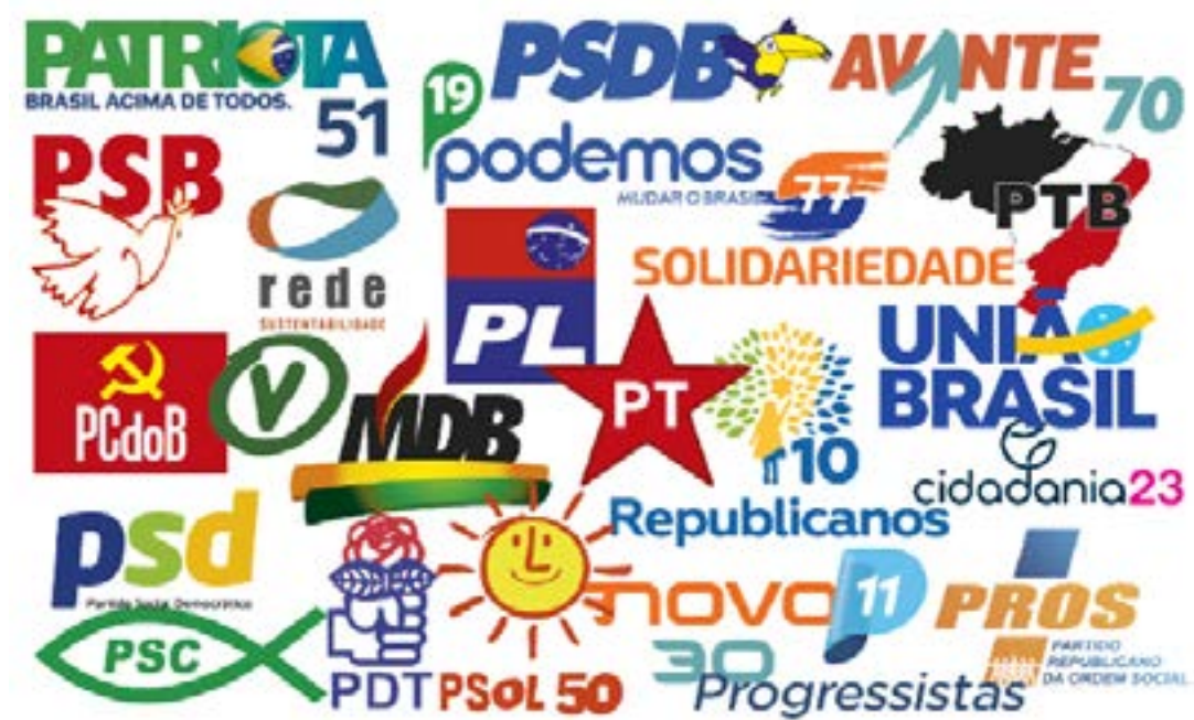
Quadro reflete em parte as mudanças no sistema partidário e nas regras eleitorais desde 2018

sobras para definição das cadeiras na Câmara. Apenas partidos que alcancem 80% do quociente eleitoral e candidatos que obtenham 20% do desse quociente participarão do rateio. (Agência Câmara)