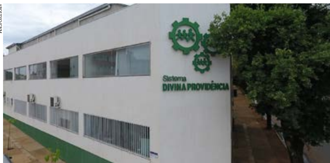
A entidade filantrópica, sem fins lucrativos, atende anualmente cerca de 1000 adolescentes em situação de vulnerabilidade social