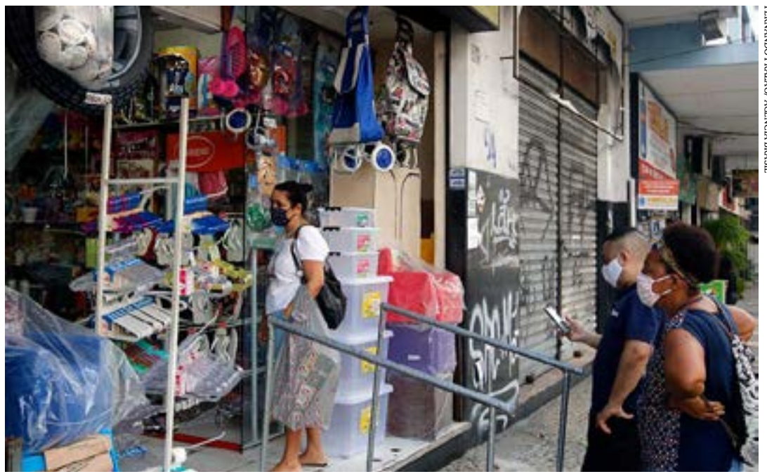
Segundo relatório da Instituição Fiscal Independente, crescimento do consumo ficará abaixo do previsto, devido ao aperto econômico efetuado pelo Banco Central

“O reajuste do teto do Judiciário impactará também os demais Poderes. O aumento de 18%, se concretizado, elevará, em particular, a remuneração dos ministros do STF, que é o teto salarial do funcionalismo da União. A remuneração de R$ 39.293,32 passaria para R$ 46.366,12. O novo teto levaria uma parte dos servidores federais a obter ganho salarial automático. Estes servidores são