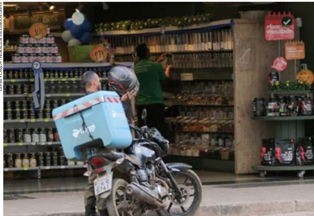
Dados fazem parte da Pesquisa Anual de Comércio

O Brasil tinha, em 2020, 1.339.460 empresas comerciais, que somavam 1,5 milhão de lojas em todo o país. Naquele ano, o setor empregava 9,8 milhões de trabalhadores, aos quais foram pagos R$ 241,6 bilhões em salários, retiradas e outras remunerações. Os dados fazem parte da Pesquisa Anual de Comércio (PAC), divulgada hoje (17) pelo Instituto Brasileiro de Geografia e Estatística (IBGE).