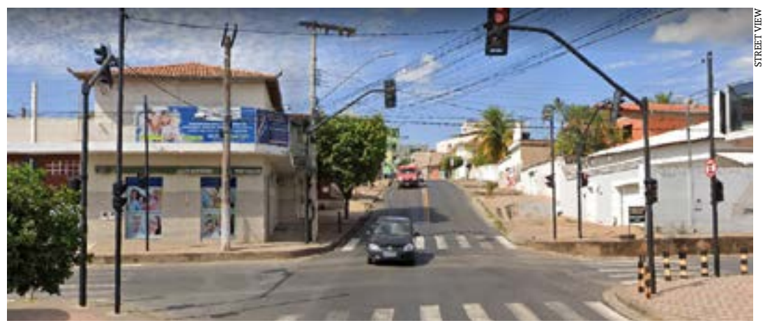
O acidente aconteceu no cruzamento avenida dos Militares com a rua José Soares de Paulo, no bairro Santa Rita II

Os policiais recolheram imagens de câmeras no local e todo o material foi repassado para a Polícia Civil.