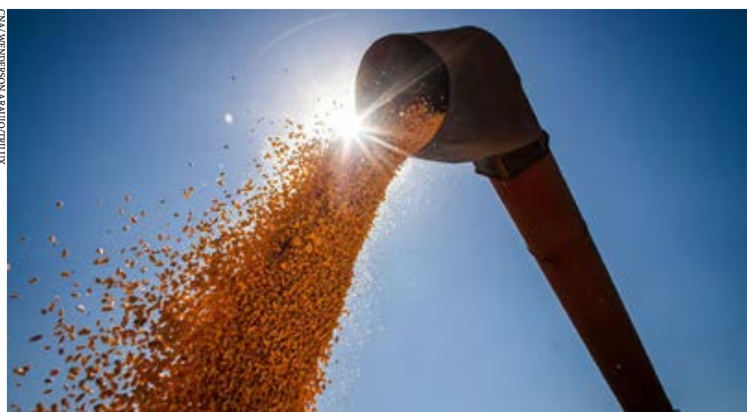
Parte desses recursos serão provenientes de bancos, diz Mapa

O aumento de demanda por financiamentos de custeio levou o governo a aumentar em R$ 6,54 bilhões os recursos a serem disponibilizados via Programa Nacional de Fortalecimento da Agricultura Familiar (Pronaf). Dessa forma, o total reservado para este tipo de financiamento ampliou-se em 12%, passando de R$ 53,6 bilhões para R$ 60,1 bilhões.