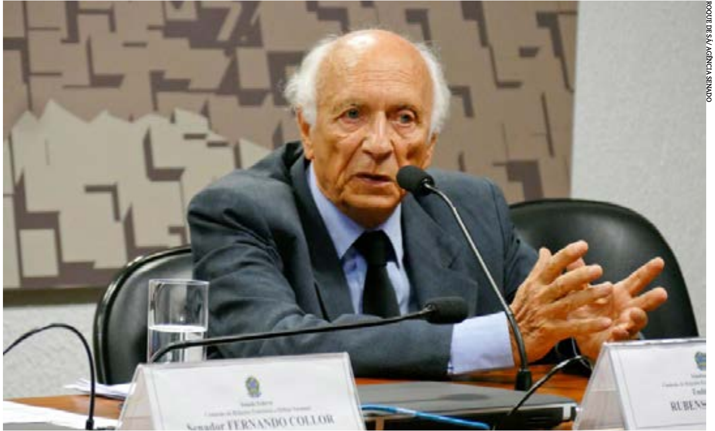
O historiador e diplomata Rubens Ricupero

Nesse balanço, há muitos aspectos que precisamos levar em conta. A desigualdade social é um deles. Passamos muito tempo fazendo vista grossa para os efeitos da escravidão sobre o presente. É verdade que nos últimos tempos tomamos algumas medidas para combater o racismo estrutural, mas ainda faltam muitas outras. Até hoje uma parcela diminuta da população controla uma grande parte da riqueza. Como podemos