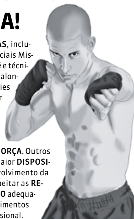
ILUSTRAÇÃO: RAFAEL MONTEIRO

Cada vez mais praticado nas ACADEMIAS , inclusive por MULHERES , o MMA (Artes Marciais Mistas) envolve GOLPES de COMBATE em pé e técnicas de LUTAS no CHÃO . As aulas incluem alongamento e AQUECIMENTO , além de séries para SOCAR , chutar, agarrar, correr, pular corda e levantar peso. O esporte ajuda no EMAGRECIMENTO , defesa pessoal, definição MUSCULAR e condicionamento físico, pois combina exercícios cardiorrespiratórios, FLEXIBILIDADE e FORÇA . Outros benefícios são sensação de bem-estar, maior DISPOSIÇÃO , melhora da AUTOESTIMA e desenvolvimento da disciplina. Para isso, é fundamental respeitar as REGRAS do esporte, realizar o preparo FÍSICO adequado, ter o conhecimento TÉCNICO dos movimentos e seguir todas as ORIENTAÇÕES do profissional.