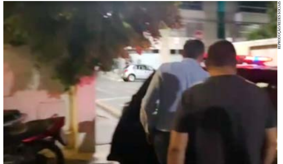
Os advogados de defesa alegam que “o médico é inocente e a prisão foi arbitrária”