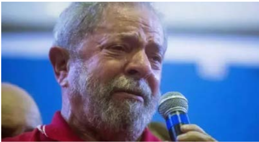
Ex-presidente Luiz Inácio Lula da Silva (PT), segundo o programa de governo protocolado no TSE, pretende fazer a "regulação" da produção agrícola do país como forma de "agregar valor à produção agrícola"; Agora o PT se diz arrependido

O trecho não explica exatamente como isso ocorreria, apenas a palavra "regulação" foi acrescentada ao documento, apontou a Valor Econômico. "É imprescindível agregar valor à produção agrícola, com regulação e a constituição de uma agroindústria de primeira linha, de alta competitividade mundial, e fortalecer a produção nacional de insumos, máquinas e implementos agrícolas, fomentando o desenvolvimento do complexo agroindustrial".