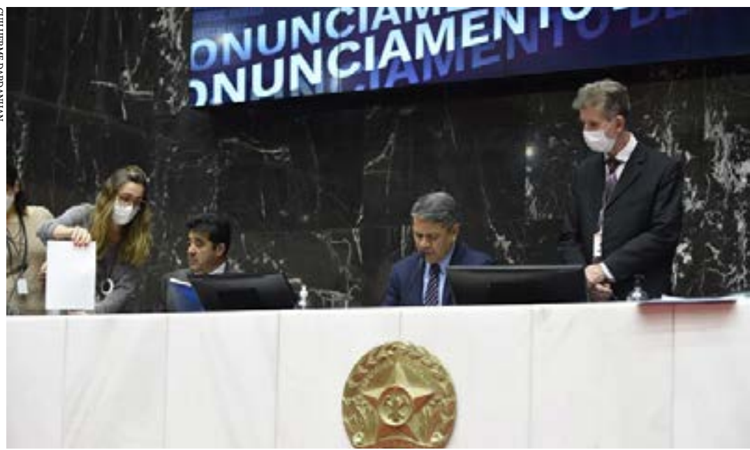
Conflito de competências entre comissões da ALMG motivou pronunciamento nesta terça (9)