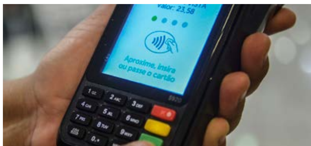
Foi movimentado R$ 1,6 trilhão com cartões no primeiro semestre

PANDEMIA - Segundo a associação, o alto crescimento está relacionado à base de comparação ruim do ano passado, momento crítico da pandemia de Covid-19. Sendo assim, a expansão também reflete o fim das restrições às movimentações e às atividades econômicas neste ano. (Agência Brasil)