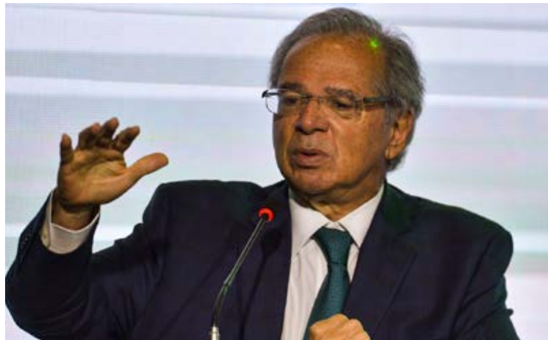
Paulo Guedes pediu abertura de mercado europeu a produtos brasileiros

“Vocês estão ficando irrelevantes para nós. É melhor vocês nos tratemem bem porque se não vamos ligar o f... para vocês e vamos para o outro lado porque estão ficando irrelevantes”, acrescentou. (Agência Brasil)