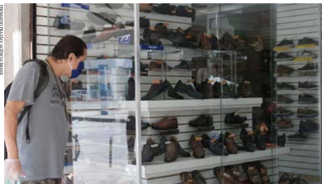
É o segundo mês seguido com queda

O comércio varejista no país registrou queda de 1,4% no volume de vendas, na passagem de maio para junho. Esta é a segunda redução seguida no setor, que, com isso, acumula retração de 0,8% em dois meses, na comparação com o