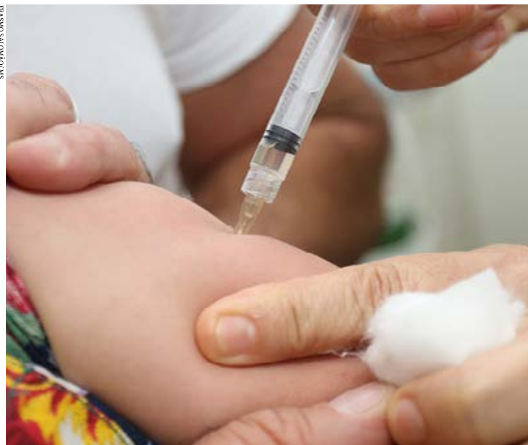
Ação tem o objetivo de definir e implementar estratégias para a interrupção da circulação do vírus no Brasil

vacinas disponíveis para crianças e adolescentes menores de 15 anos. A dose da tríplice viral, que protege contra o sarampo, faz parte desses imunizantes do Calendário Nacional de Vacinação. O principal objetivo é aumentar as coberturas vacinais. (Portal Ministério da Saúde)