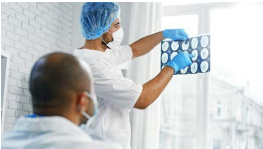
A trombectomia é usada na fase aguda do problema

risco de AVC são a hipertensão, o diabetes tipo 2, colesterol alto, sobrepeso; obesidade; tabagismo; uso excessivo de álcool; idade avançada; sedentarismo; uso de drogas ilícitas; histórico familiar; ser do sexo masculino. Para prevenir, o ideal é manter uma vida saudável, sem fumar, consumir álcool ou drogas ilícitas, além de manter alimentação equilibrada, peso ideal, beber bastante água, praticar atividades físicas regularmente e manter a pressão e a glicose sob controle. (Agência Brasil)