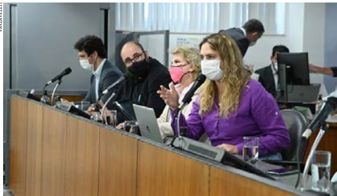
Autonomia de gestão financeira para universidades, sem vinculação com o orçamento do Estado, foi defendida

Subfinanciamento tem prejudicado as atividades de ensino, pesquisa e extensão na Uemg e na Unimontes