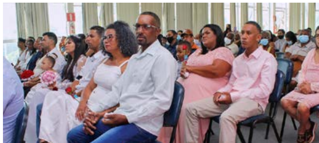
Um grupo numeroso de casais, de vários municípios, foi beneficiado pela ação

Mais de 150 casais da comarca de Pirapora, formalizaram os seus relacionamentos, sem qualquer tipo de custo. A ação foi realizada pelo Tribunal de Justiça de Minas Gerais, por meio do Centro Judiciário de Solução de Conflitos e Cidadania (Cejusc) local.