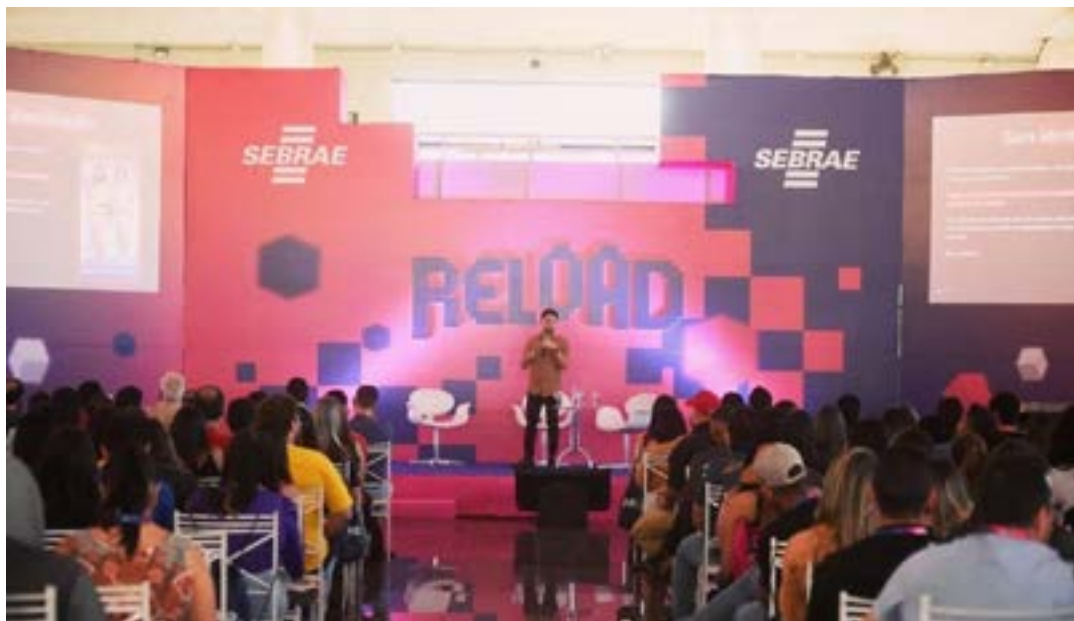
Evento promovido pelo Sebrae Minas acontece nos dias 30 e 31 de agosto