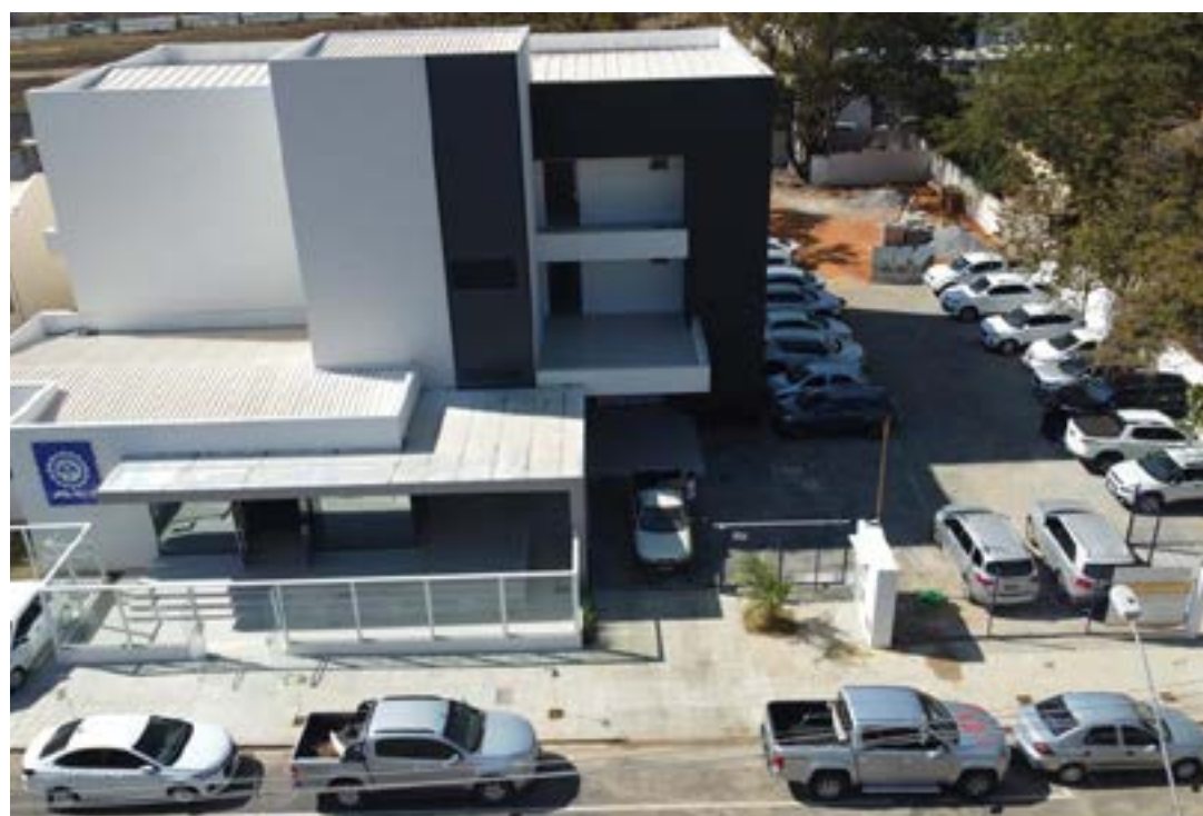
O evento foi realizado no novo prédio da ACI

Na última terça-feira (9), a Associação Comercial Industrial e de Serviços de Montes Claros e a Federaminas realizaram o Circuito E-Minas, evento que reuniu representantes do Governo de Minas e lideranças em um momento inédito para o desenvolvimento regional. Na oportunidade, representantes das associações comerciais de 10 cidades norte-mineiras conheceram as linhas de investimentos, as cadeias produtivas e mostraram os gargalos do Norte de Minas, que representa 9% do PIB estadual.