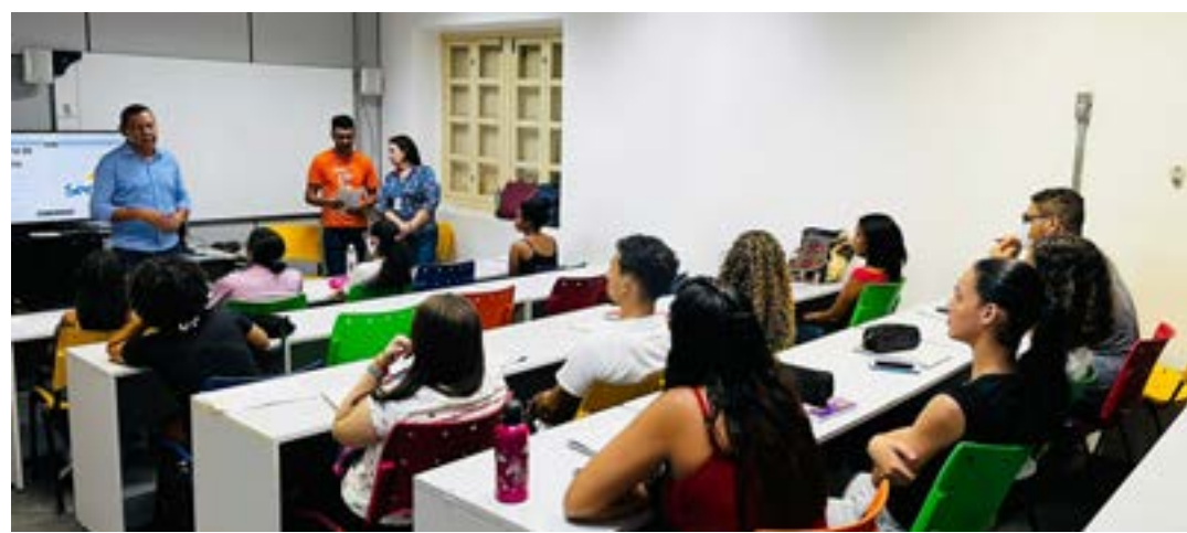
A capacitação dos alunos da turma do curso de Assistente de Recursos Humanos

Em menos de um mês, o prefeito assinou e começou a executar duas grandes obras de asfaltamento, nos bairros Nova Pirapora e Cidade Jardim. "Com muita responsabilidade com o dinheiro público, estamos indo bairro a bairro com o intuito de melhorar a vida da população", comentou o secretário de Projetos e Obras, Luciano Rodrigues. (TIAGO RODRIGUES - Colaborador)