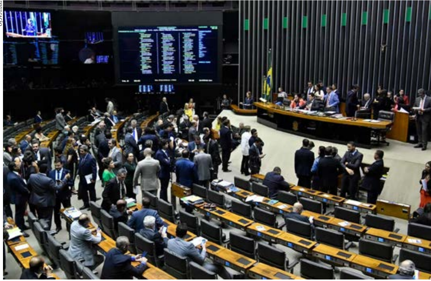
Congresso irá analisar os vetos presidenciais à Lei de Diretrizes Orçamentárias

Ainda segundo o presidente, o não cumprimento dessas regras fiscais, ou mesmo a mera existência de risco de descumprimento, poderia provocar insegurança jurídica e impactos econômicos adversos, tais como elevação de taxas de juros, inibição de investimentos externos e elevação do endividamento.