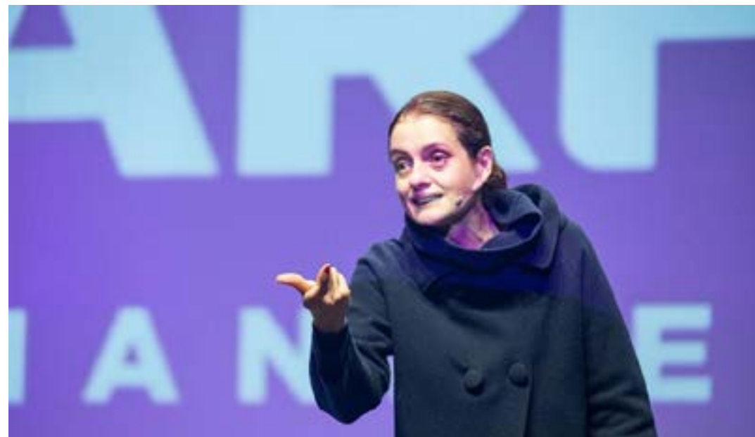
A atriz e colunista Denise Fraga será uma das palestrantes

Apoiar empreendedores a impulsionarem sua presença on-line e aumentarem as vendas é o objetivo Reload na Estrada, o maior evento de marketing digital realizado pelo Sebrae Minas, que acontece entre os dias 30 e 31 deste mês, em Montes Claros. As inscrições podem ser feitas no site do evento.