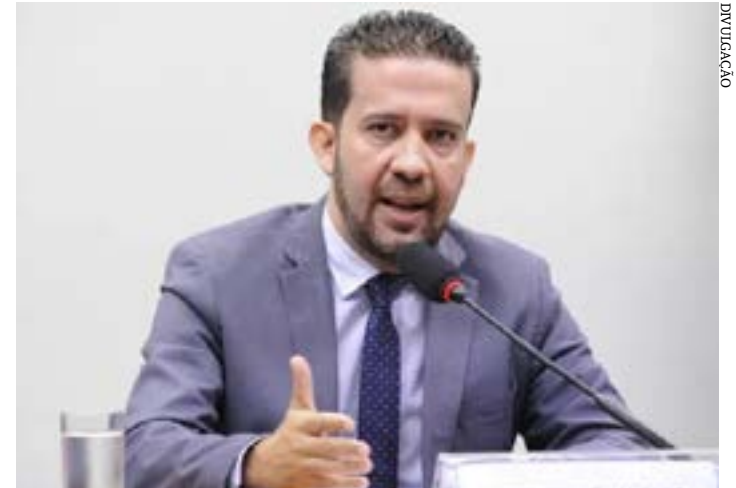
André Janones desistiu de concorrer à presidência e tentará se reeleger deputado