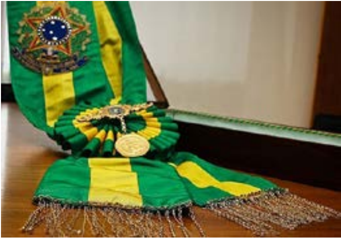
Segundo a maioria das pesquisas, nenhum candidato - fora Bolsonaro e Lula - chegam a 10% das intenções de votos; registros de novos nomes podem ocorrer até dia 15

José Maria Eymael, Vera Lúcia e Soraya Thronicke se somam à disputa; já André Janones e Luciano Bivar confirmaram a desistência e vão tentar a reeleição a deputado federal