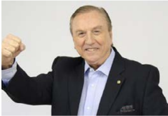
Com 82 anos, José Maria Eymael é advogado e empresário; foi duas vezes deputado federal e concorreu cinco vezes à Presidência da República