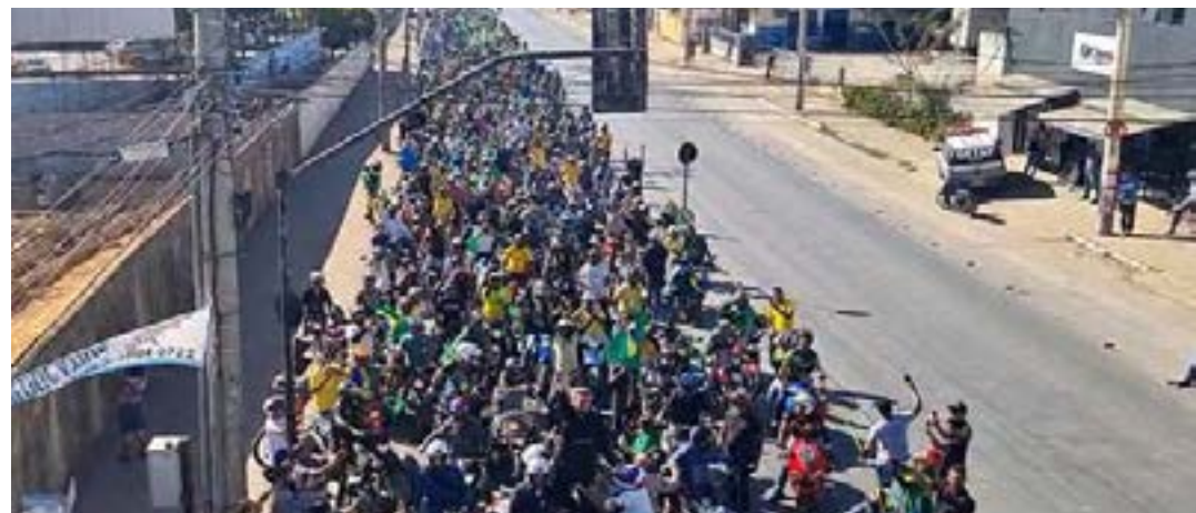
Carreata e motociata de grandes proporções tomaram conta de avenidas, especialmente nas vias de acesso ao Parque João Alencar Athayde