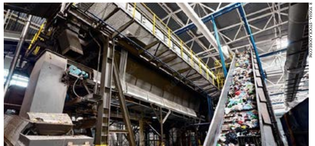
Com a derrubada dos vetos e a promulgação foram restaurados na lei os artigos que tratavam da dedução no imposto de renda do apoio a projetos de reciclagem aprovados pelo Ministério do Meio Ambiente

A dedução, para as pessoas físicas, será limitada a 6% do imposto de renda devido apurado na declaração de ajuste anual. Para as pessoas jurídicas, o limite será de 1% do imposto devido em cada período de apuração trimestral ou anual. (Agência Senado)