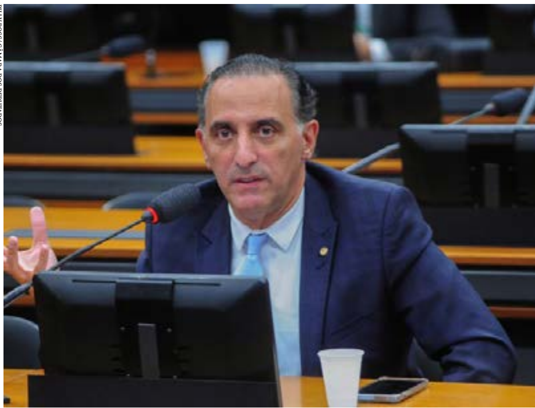
Eduardo Cury defendeu a modernização dos concursos públicos

O Plenário da Câmara dos Deputados aprovou durante sessão deliberativa virtual, proposta que estabelece regras para os concursos públicos para contratação de servidores federais. Estados e municípios poderão definir normas próprias. O texto segue agora para análise do Senado.