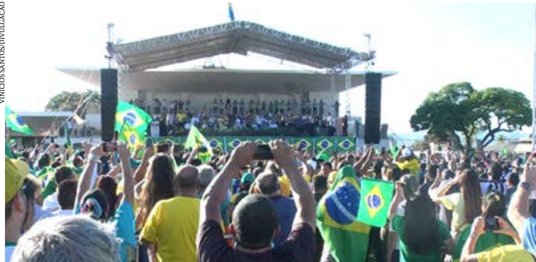
O presidente Jair Bolsonaro discursou para apoiadores no Parque de Exposições João Alencar Athayde