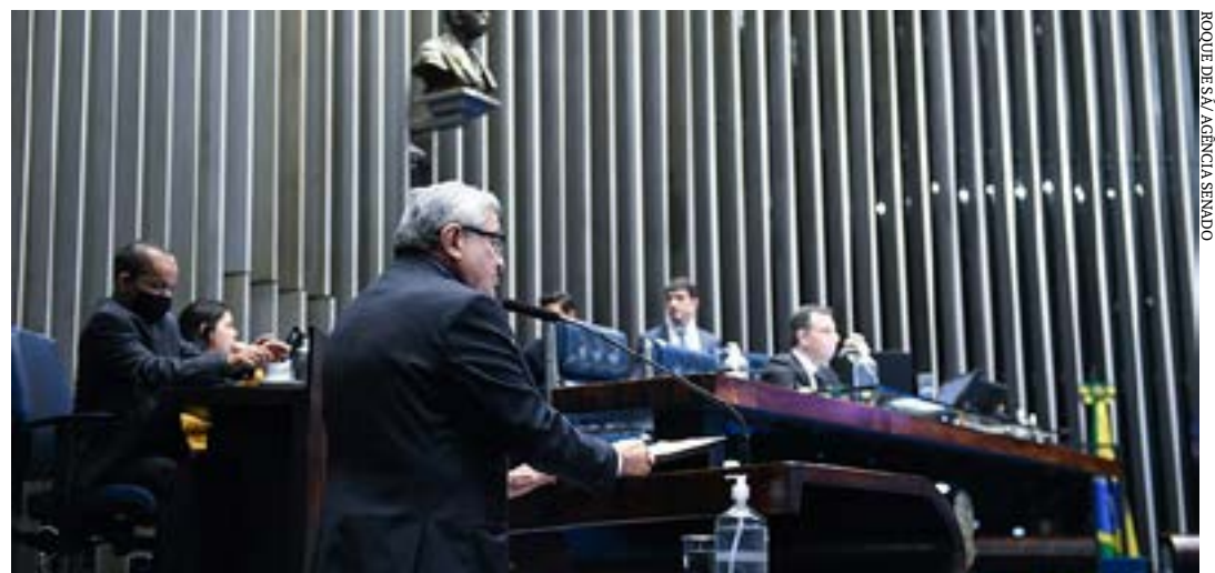
O Senado aprovou a MP 1.111 no dia 13 de julho, com relatório favorável do senador Roberth Bringel (União-MA)

A lei indica como fonte de recursos o superávit financeiro apurado no balanço patrimonial do exercício de 2021, referente a recursos primários de livre aplicação. (Agência Senado)