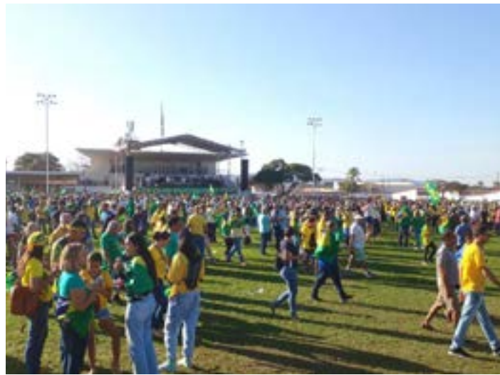
Público compareceu à área de eventos do Parque, onde o presidente foi recebido