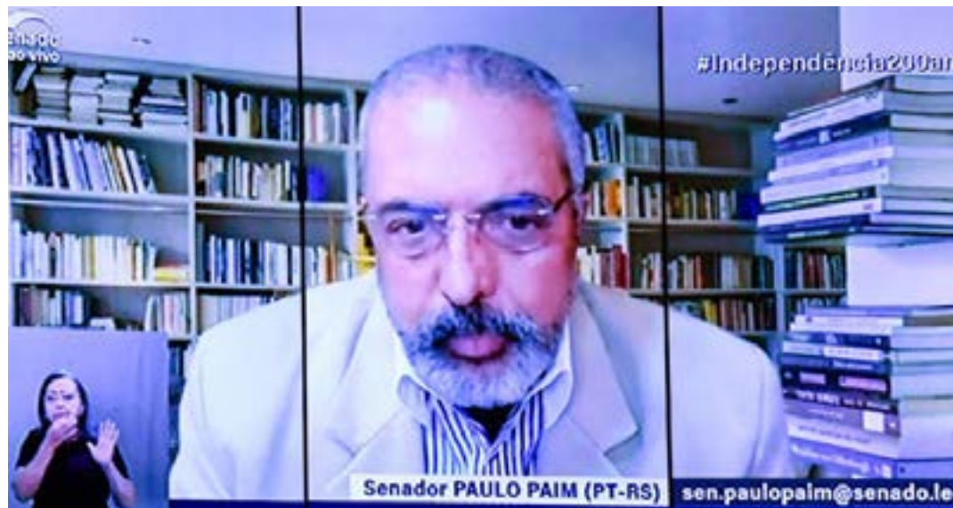
Para o senador Paulo Paim, a falta de consumo de leite só faz aumentar a insegurança alimentar.

“É importante lembrar que o aumento que o consumidor teve no litro de leite chegou a 130% e o aumento para o produtor ficou em torno de 30%. Essa situação não é justa. O consumidor pagando R$ 10 o litro e o produtor vendendo a R$ 2,80 o litro. Essa conta não fecha. É inexplicável”, afirmou o senador. (Agência Senado)