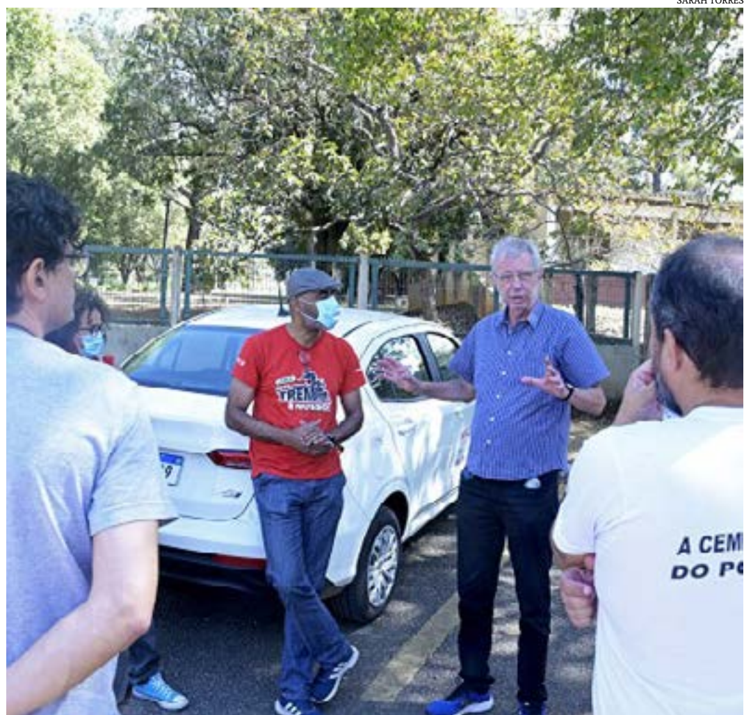
Deputado criticou a postura da empresa de barrar o acesso da comissão ao local, lembrando que uma das prerrogativas da ALMG é fiscalizar órgãos do Estado

“As empresas dão treinamento somente para manuseio de seus comandos, que são diferentes. Aqui a proposta seria ninguém ficar preso a uma só tecnologia”, disse ele. (Portal ALMG)