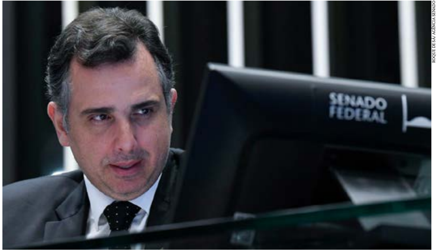
Pacheco disse que as urnas eletrônicas são motivo de orgulho nacional

Na carta, a Coalizão em Defesa do Sistema Eleitoral pediu para que o Congresso reafirme seu compromisso com o processo eleitoral e “reaja às ameaças do Senhor Presidente da República manifestando-se claramente contrário a qualquer aventura golpista”. (Agência Brasil)