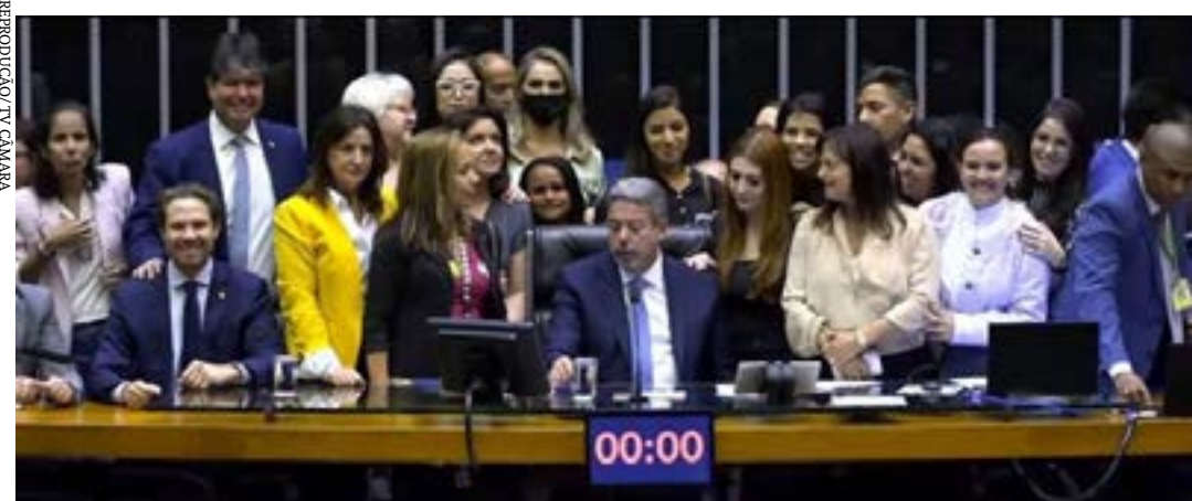
Mães de pacientes prejudicados pela decisão do STJ acompanharam a votação em Plenário