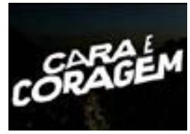
entra em surto, e Regina cuida do rapaz. Ítalo abre a caixa de Clarice na casa de Jonathan.

José Lucas tenta convencer Jove a procurar Juma. Irma aceita ir para o Rio de Janeiro consultar um médico, a pedido de Mariana. José Leônico e Filó se emocionam ao se despedir de José Lucas. Juma diz a Muda que só quer saber do filho que está esperando. Mariana avisa a Trindade que não quer que ele interfira na viagem de Irma para o Rio de Janeiro. Tadeu reclama com Trindade, dizendo que José Leônico só tem olhos para Jove. Marcelo e Guta procuram José Leônico para