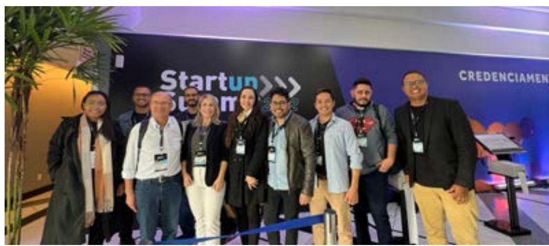
A convite do Sebrae Minas, comitiva visita o Startup Summit, um dos maiores eventos de inovação do país

O Sebrae Minas é apoiador do ecossistema de inovação no Norte do estado. Em parceria com entidades locais, a instituição estimula o desenvolvimento do empreendedorismo inovador entre estudantes, instituições de ensino superior, entidades de fomento e empreendedores locais. (Agência Sebrae)